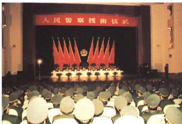
1992年12月23日，天津市公安局在天津宾馆大礼堂举行人民警察授衔仪式