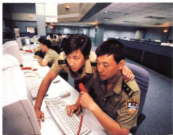
天津市公安局指挥中心大厅