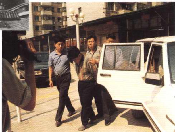
1997年5月23日，公安干警将1996年12月20日天津发生的重大绑架杀人案犯罪嫌疑人抓获