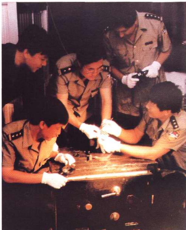
天津市公安局刑侦部门研究分析案情