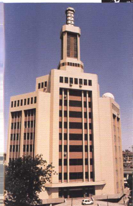
1992年5月28日，天津市公安局计算机通讯指挥中心竣工并启用