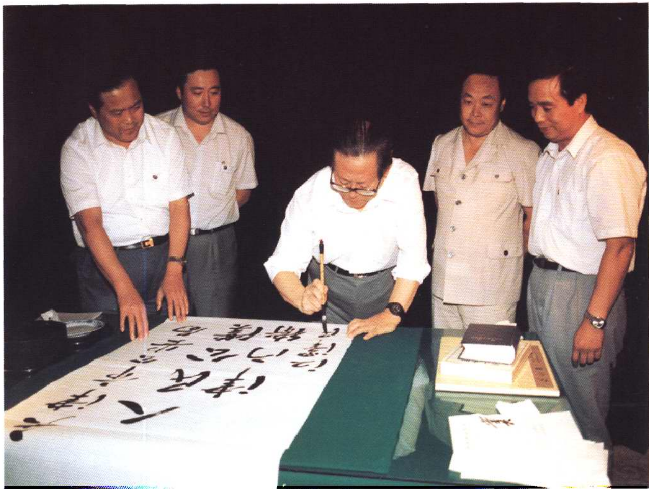
1991年7月29日，中共中央总书记江泽民为天津市公安局题词：“人民公仆，津门卫士”（右1为中共天津市委常委李建国，右2为天津市副市长兼公安局局长宋平顺）