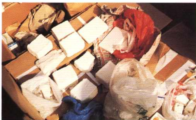
1997年5月19日，天津市公安机关破获建国以来首起跨国贩毒案件