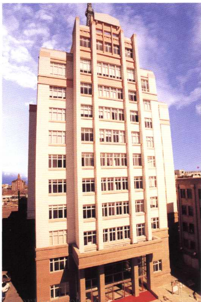
1998年，动工兴建的天津市公安局指挥中心大楼