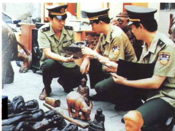
天津市公安机关缴获的走私文物