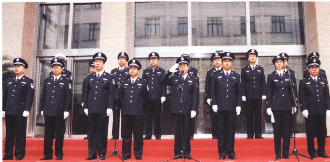
2000年9月29日，天津市公安局举行“99”式新警服换装仪式