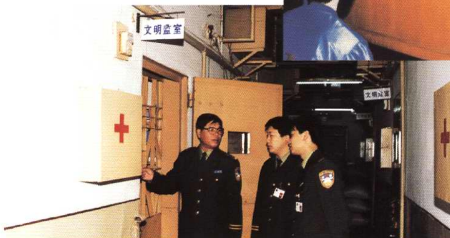
1997年5月，公安部授予天津公安 河东分局看守所“全国模范看守所” 称号