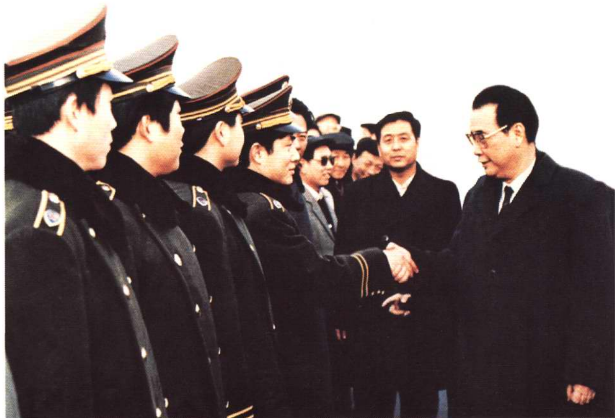
1991年1月，国务院总理李鹏接见天津市公安交通民警