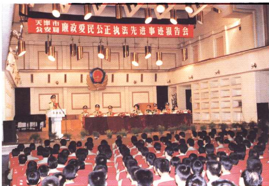
1998年4月，天津市公安局召开廉政爱民公正执法先进事迹报告会