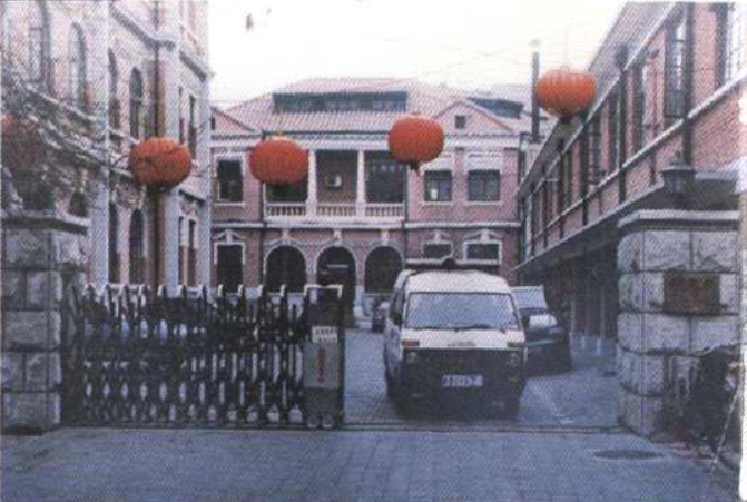
天津市公安刑侦局大楼