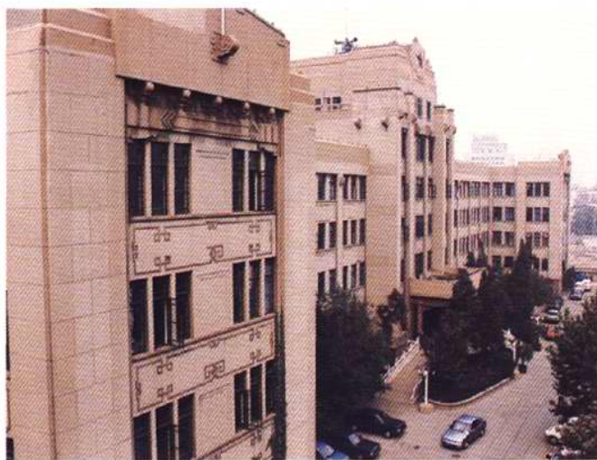
1955年7月，天津市公安局大楼竣工并启用