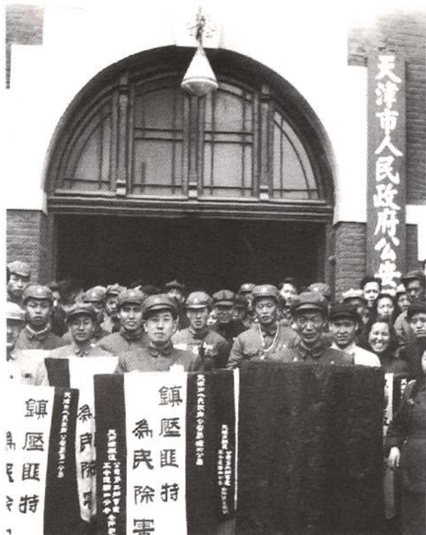
解放初期的天津市人民政府公安局