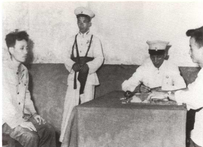
解放初期，公安干警审讯犯罪嫌疑人