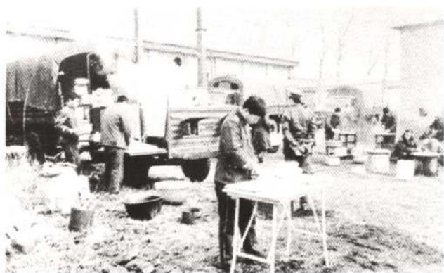
1993年4月查破大邱庄案件