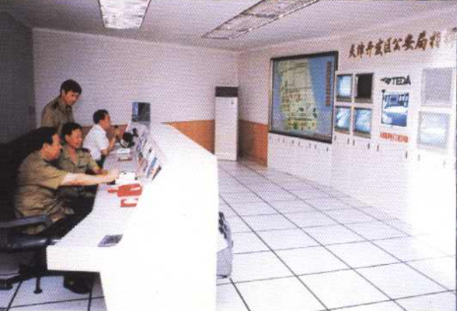
天津市公安局经济技术开发区分局指挥中心