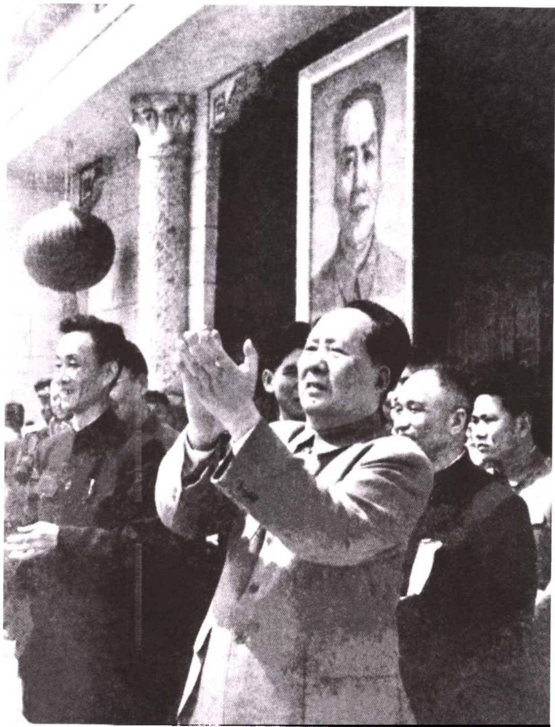
1960年5月1日，中共中央主席毛泽东在天津中心广场观礼台上与天津人民一起欢度“五一”国际劳动节（左1为曾担任天津市第二任公安局局长的中共天津市委第一书记万晓塘）