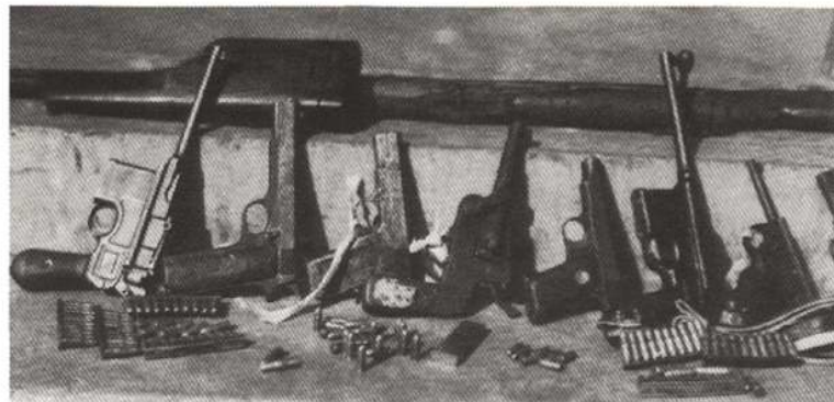
1950年2月，天津市公安局破获杀人、绑票、抢劫三大股匪案缴获的部分枪支弹药