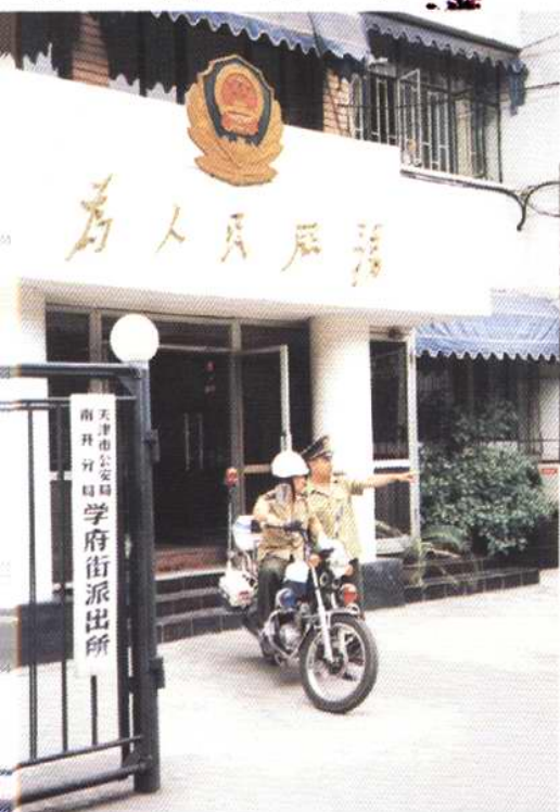
天津市公安局南开分局学府街派出所