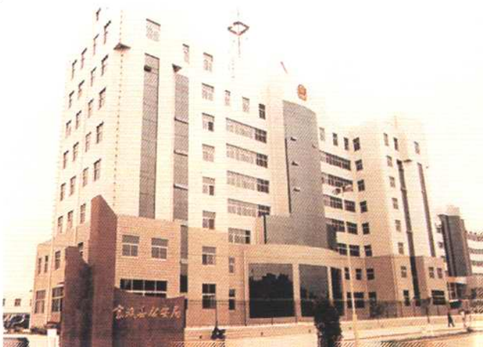
1998年5月8日，天津市宝坻县公安局大楼落成并启用