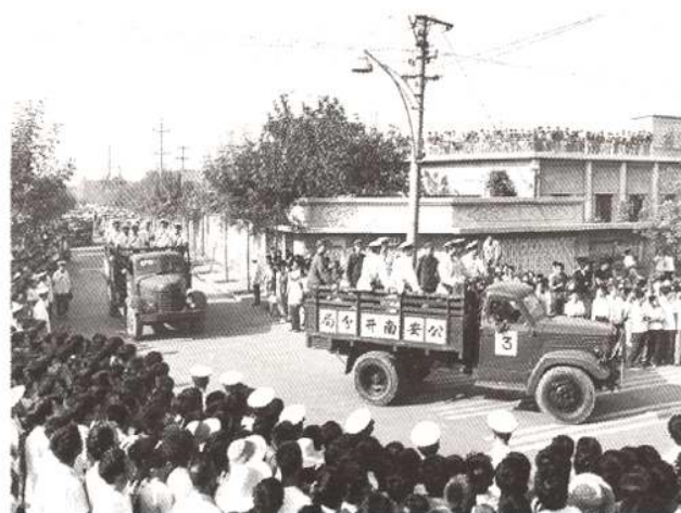
1983年8月至1986年，天津市进行了严厉打击严重刑事犯罪的斗争，将严重危害社会治安的刑事罪犯执行枪决