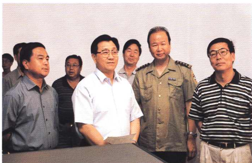
2000年6月12日，中共天 津市委副书记、市长李盛霖 到市公安交通管理局视察交 通管理控制中心