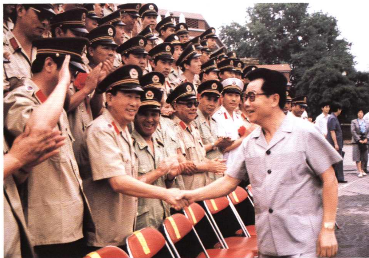
1989年7月30日，中共中央政治局常委、书记处书记李瑞环接见天津市公安干警和立功人员