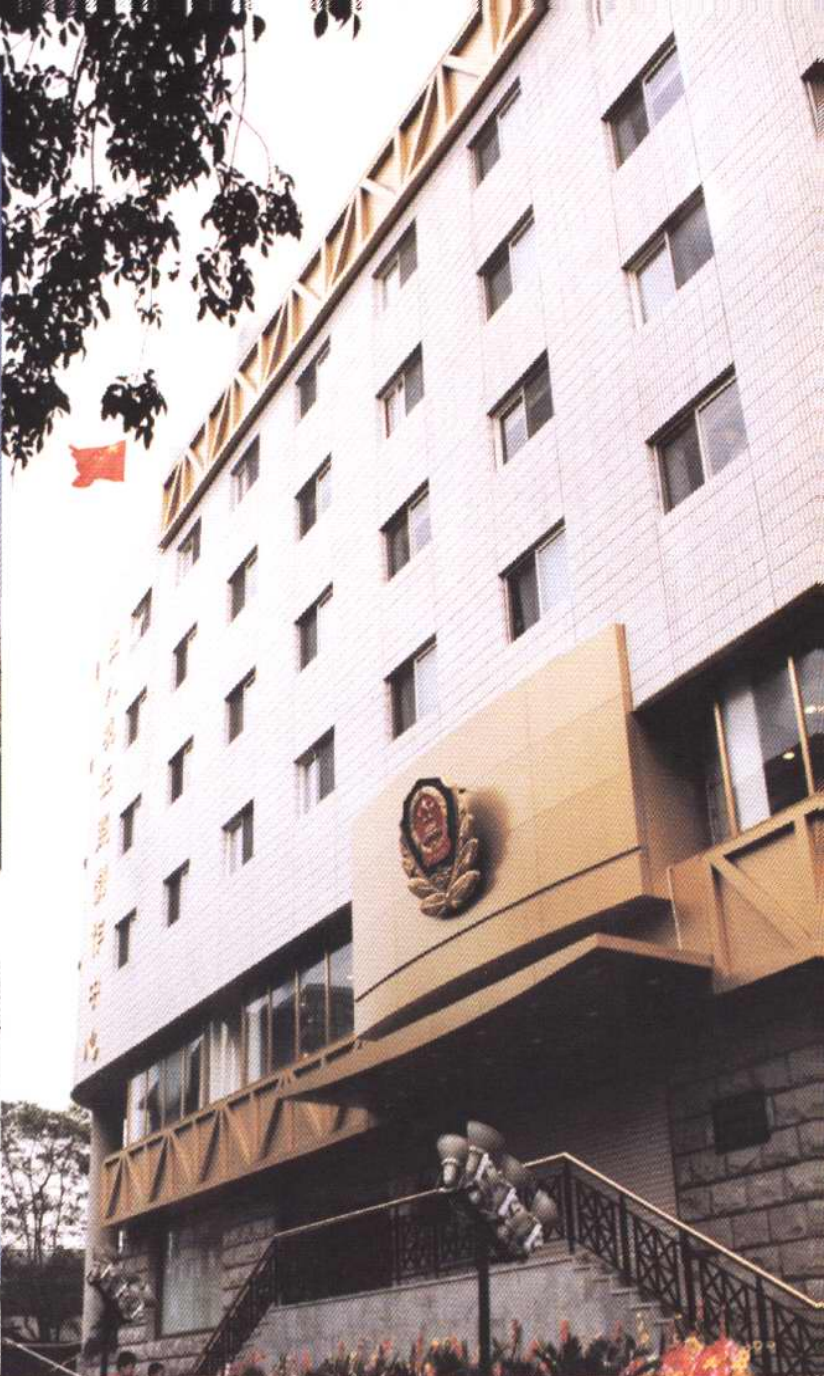
1998年9月8日，天津市公安局出入境证照制作中心落成并启用