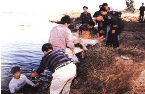
1998年侦破“9·24”劫车杀人案