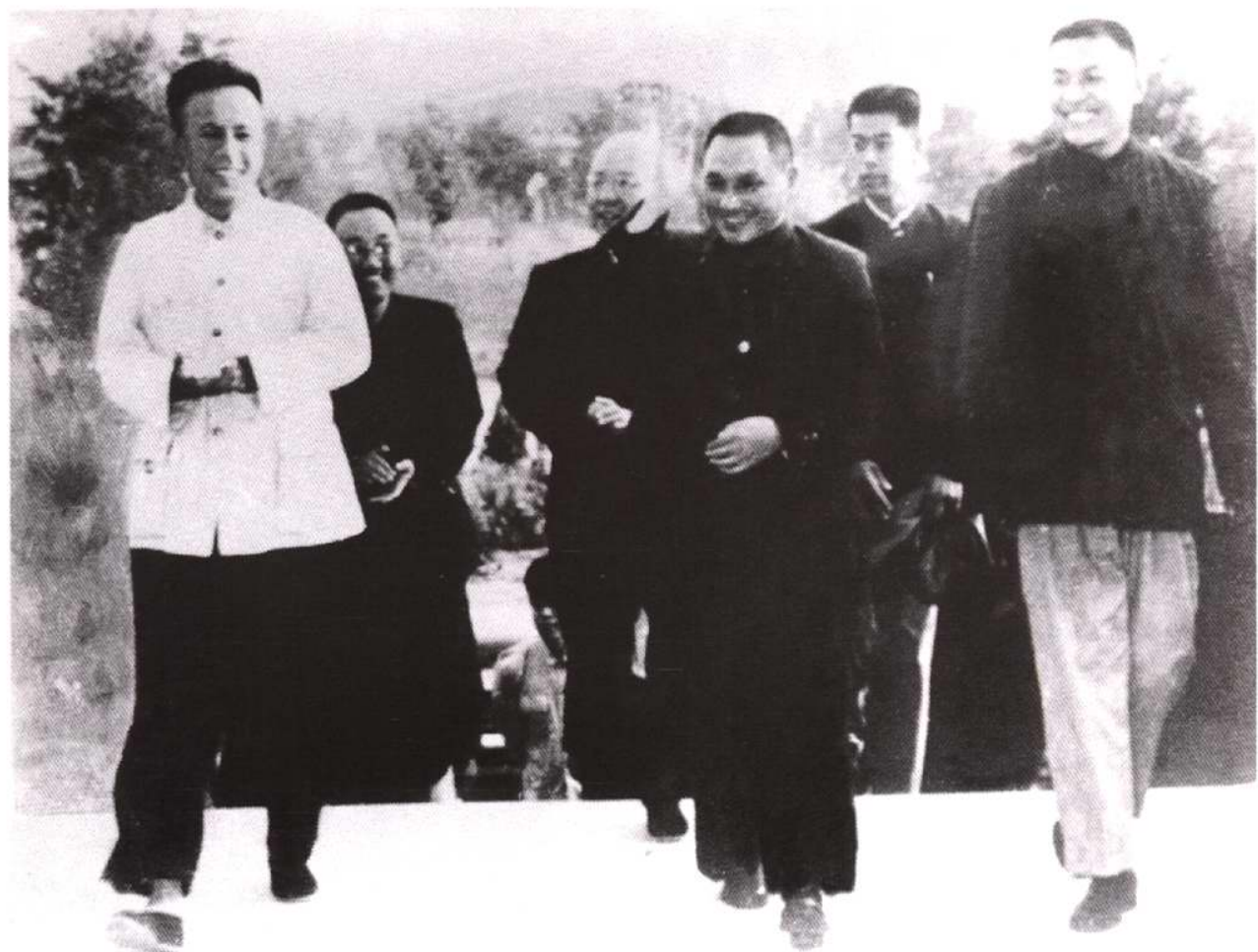
1958年10月9日，中共中央总书记邓小平（中）到天津视察（右1为天津市公安局副局长王诚熙）