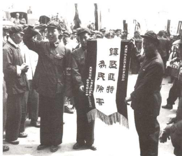
镇反运动期间，人民群众给公安局送锦旗