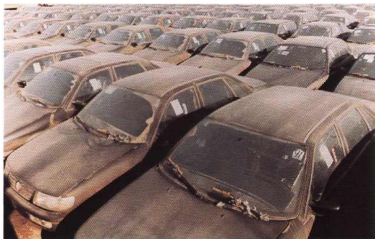
1996年1月查破走私汽车大案