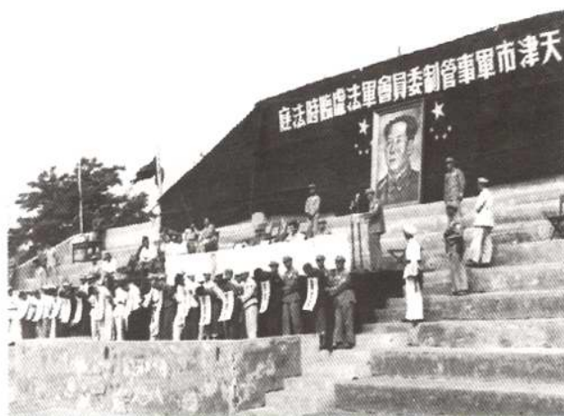
1951年3月31日，天津市军事管制委员会设临时法庭对反革命分子进行公审