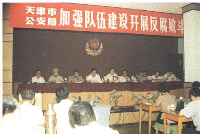
1993年8月，天津市公安局召开加强公安队伍建设，开展反腐败斗争工作会议