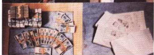
1996年12月侦破“汇票”诈骗大案