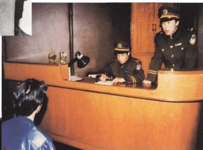
1998年3月，公安干警对绑架案 犯罪嫌疑人进行审讯