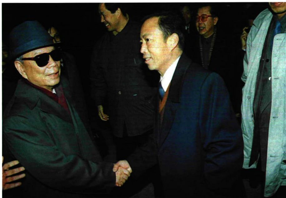
1993年1月19日，全国人大常委会副委员长彭冲（左一）在大连机场