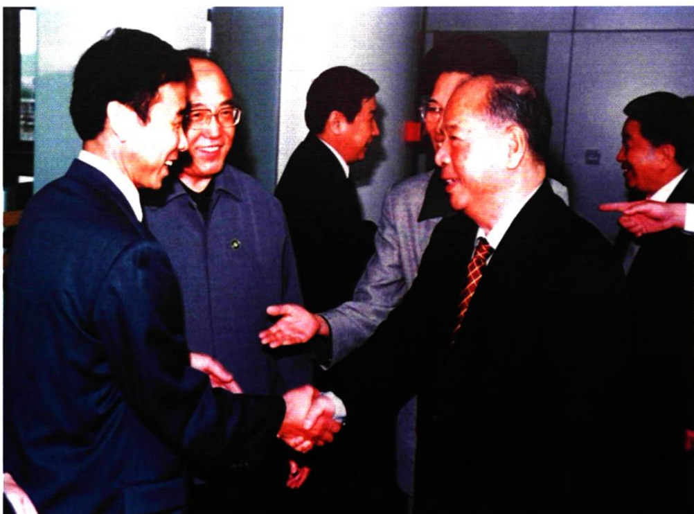
1999年10月5日，中共中央政治局常委、中纪委书记尉健行在大连机场