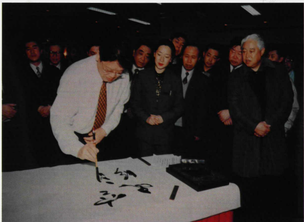
1998年2月11日，中共中央政治局委员李铁映在机场