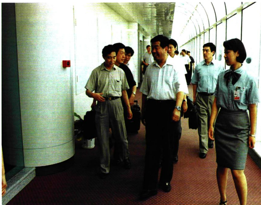
2002年5月11日，中共中央政治局委员贾庆林（中）在大连机场