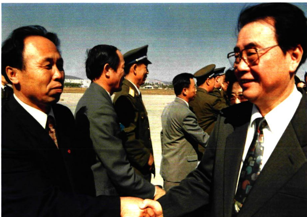
1994年10月13日，中共中央政治局常委、国务院总理李鹏乘专机抵达大连机场