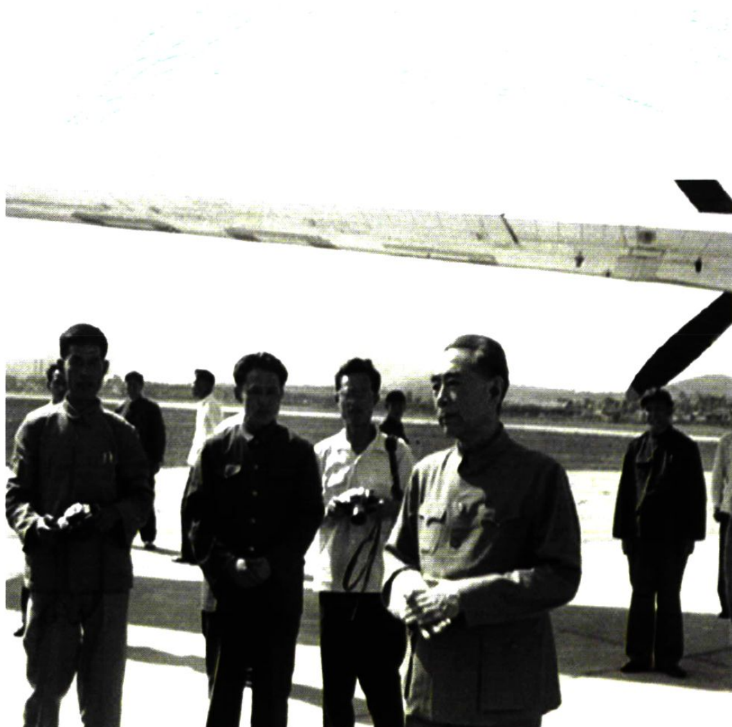
1973年8月1日，周恩来总理在大连机场