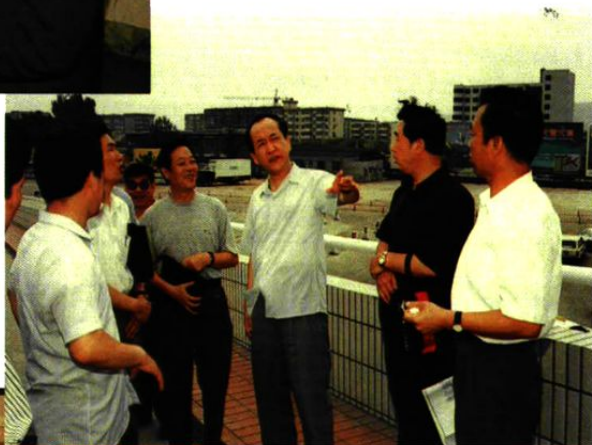
1994年8月2日，民航总局陈光毅局长（右三）视察机场 ▷