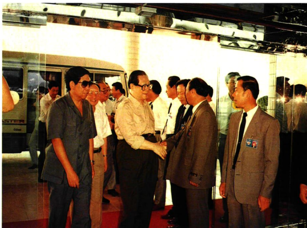
1993年8月31日，中共中央总书记、国家主席江泽民在大连机场视察