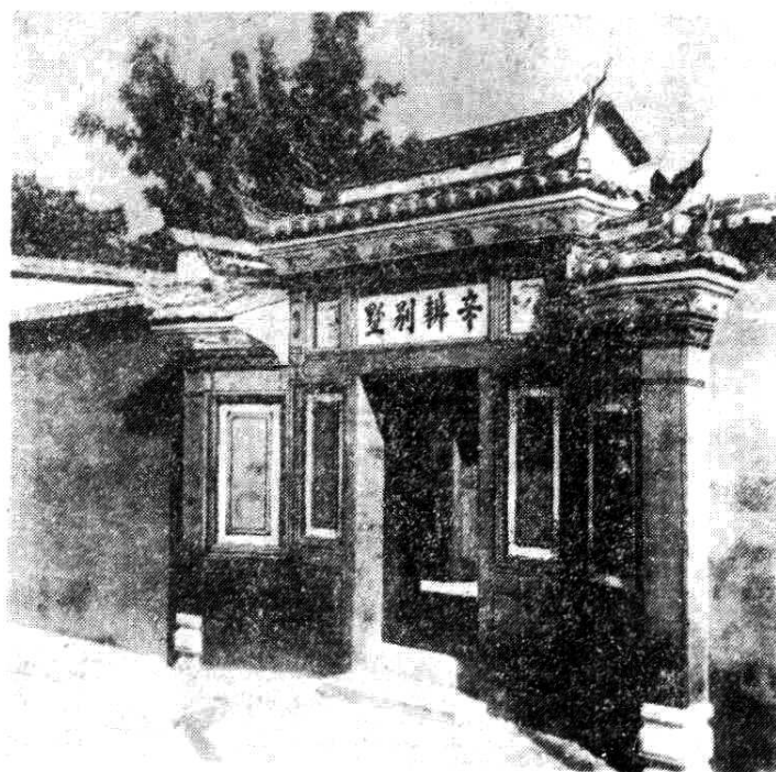
图三 毛主席、朱总司令首次入闽旧居