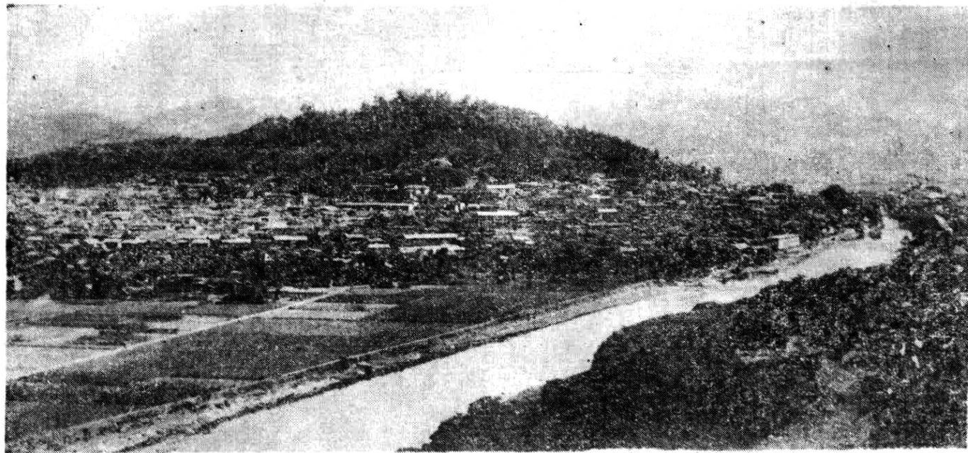
图一 长汀(汀州)县城全景