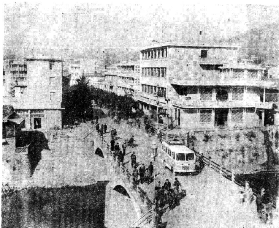
图二 长汀县城风貌（望江楼）