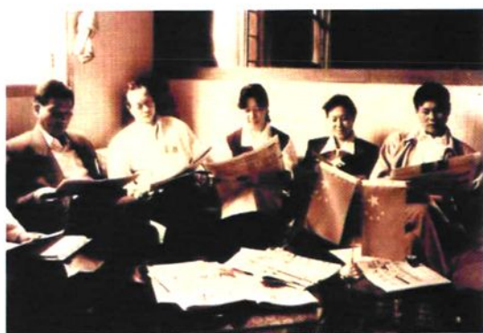
1997年医院领导成员组织学习