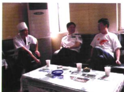
2008年6月省委常委、省政法委书记、公安厅厅长吴永文（中）视察医院