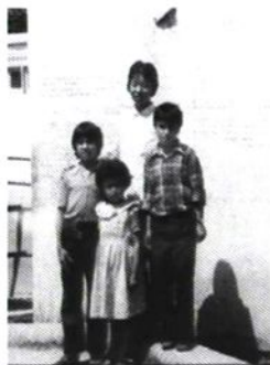
上世纪70年代我院援非 医务人员与当地百姓合影