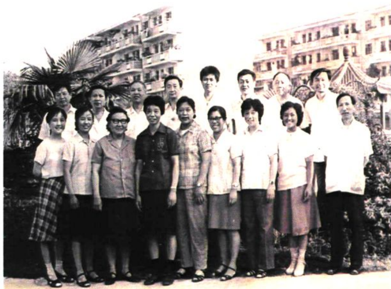
80年代医院部分业务骨干合影