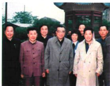
1986年10月原省、市领导关广富、穆常生、王开炳来院视察