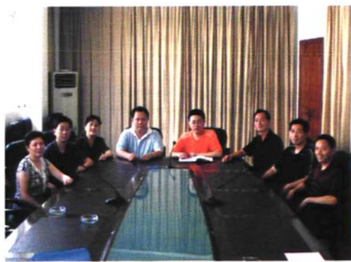
2007年医院领导班子成员