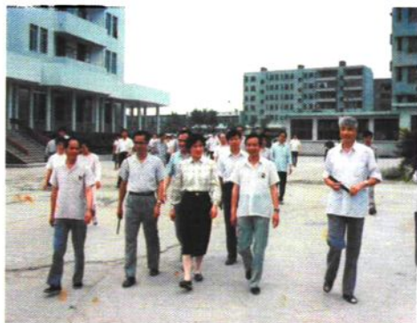
1990年原卫生部副部长何界生来院视察