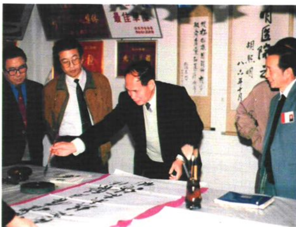
1993年原卫生部副部长郭子恒来院视察并题词