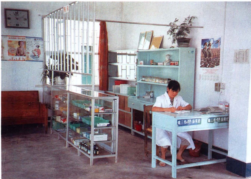
图3: 全县实行乡村卫生服务一体化管理后,村级卫生所建设进一步规范,办医条件显著增强。图为平安乡巨塘村卫生所。