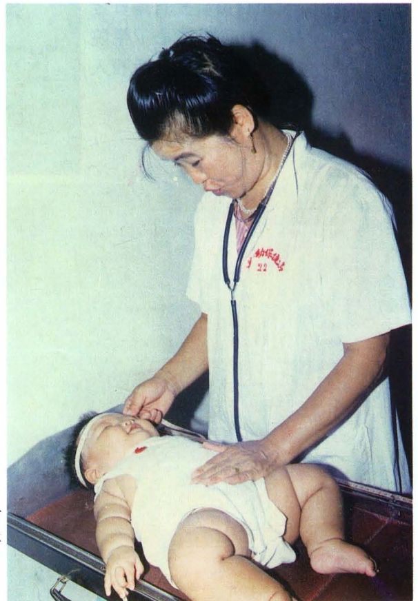
图4: 县妇幼保健院于2001年8月顺利通过“一级乙等妇幼保健院”评审。图为该院儿保医生开展婴幼儿生长发育监测情景。