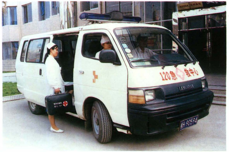
图2: 全县“120紧急救护系统”于2001年9月正式组建, 为及时有效地抢救重症病人发挥了巨大的作用。图为120紧急救护小组紧急出动。