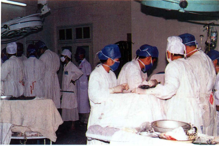
图1: 县人民医院外科手术工作情况。

经过几十年的不断建设和完善,全县三级医疗网点已建立健全,基础设施不断改善,服务功能不断增强,为保护人民身体健康,促进瑶乡社会进步和经济发展发挥了积极作用。