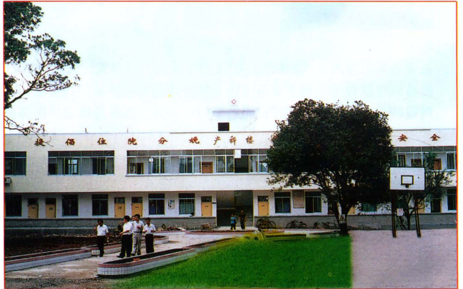
图2 利用自治区人民政府公共卫生基础设施建设项目资金及自筹资金新建的莲花中心卫生院产科楼(2002年7月投入使用)