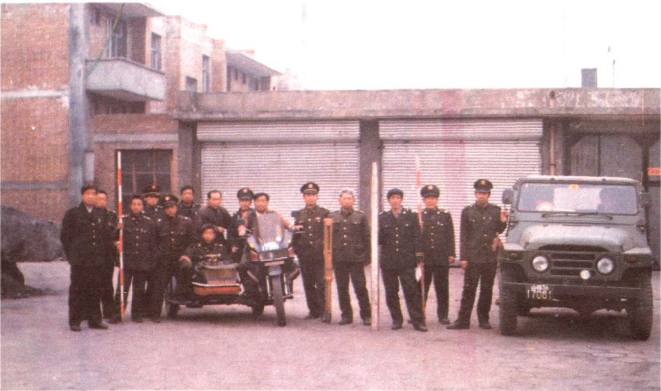
县交通局路政股全员上岗