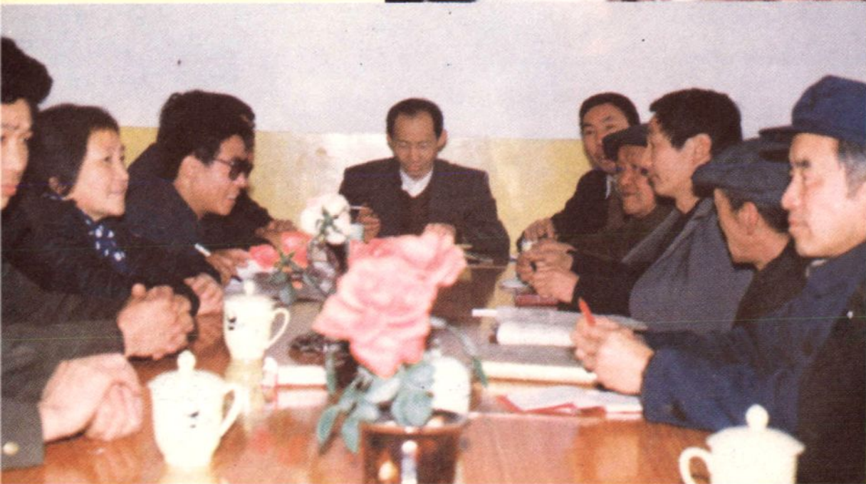
交通志编纂领导 组成员讨论交通志稿