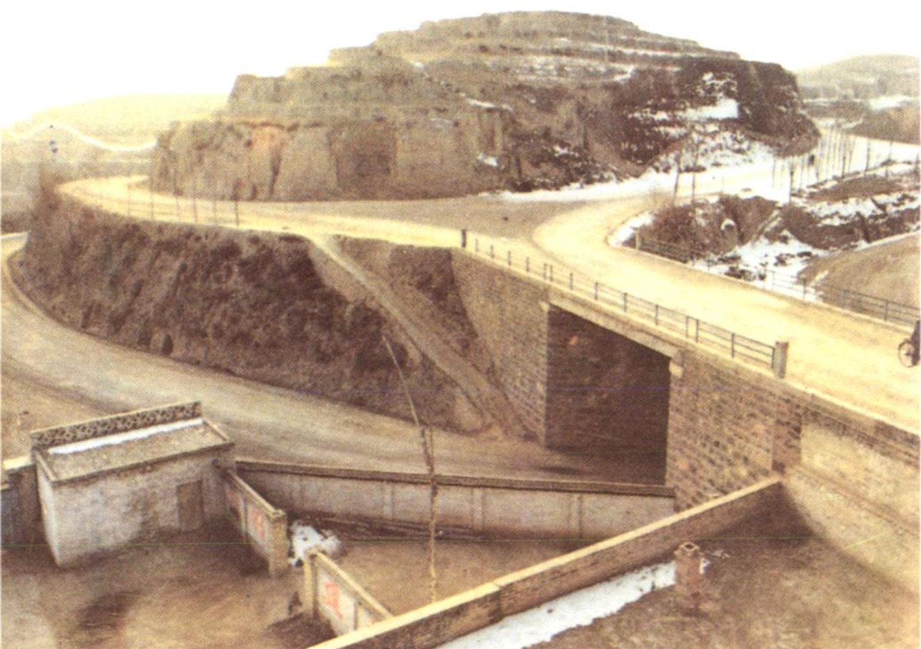
柳结线狐子塬立交桥全景