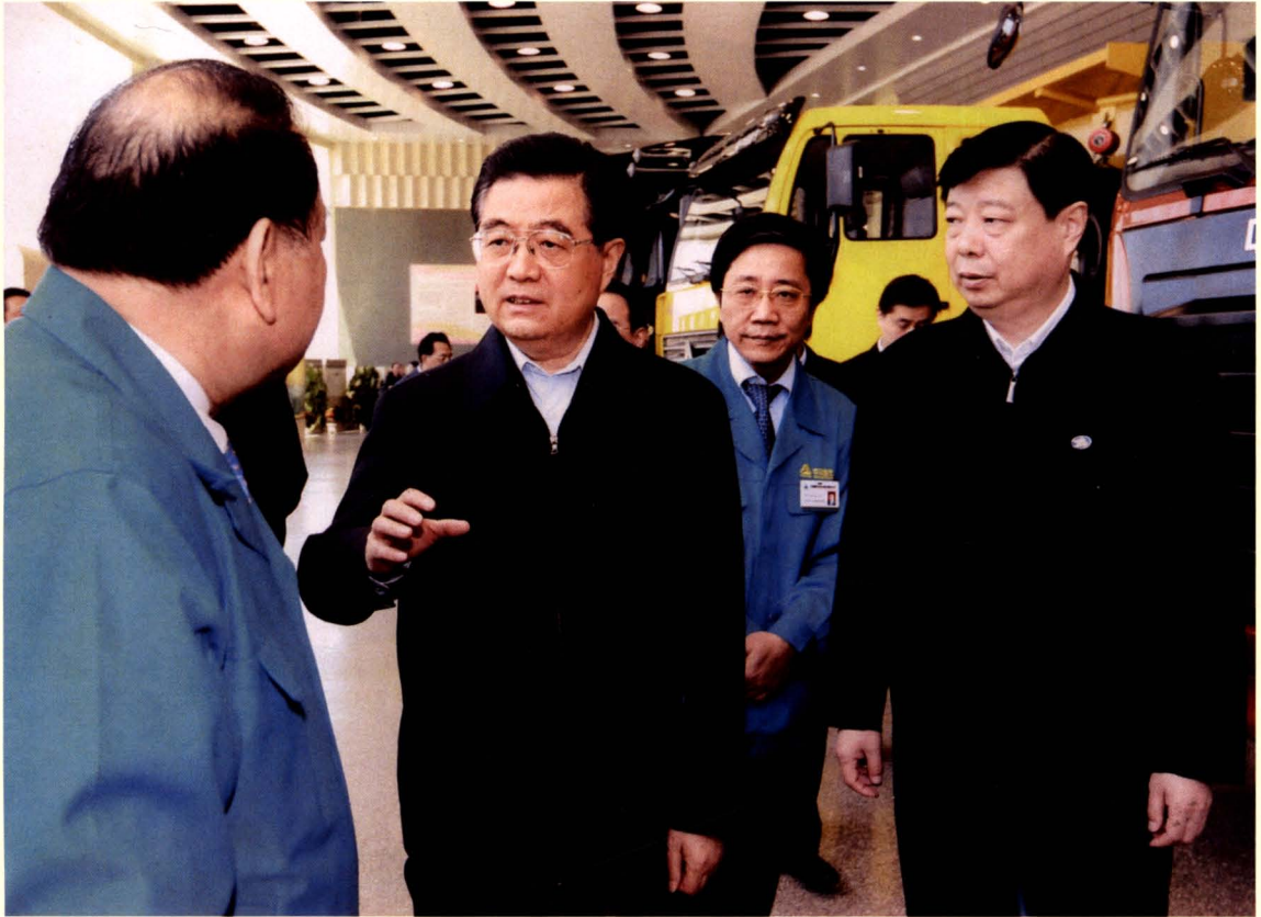
2009年4月21日，时任中共中央总书记、国家主席、中央军委主席胡锦涛（中）到章丘视察中国重汽集团济南商用车有限公司。