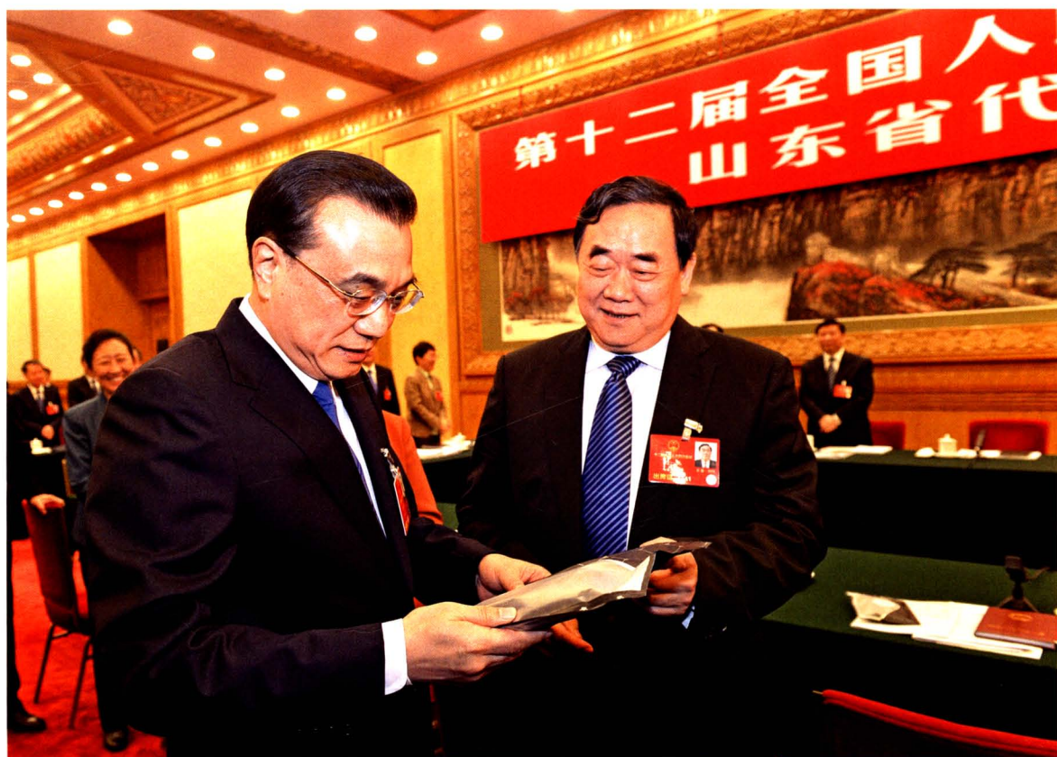
2016年3月6日，中共中央政治局常委、国务院总理李克强在全国人大十二届四次会议期间，听取济南圣泉集团股份有限公司董事长唐一林汇报石墨烯新产品研发情况。