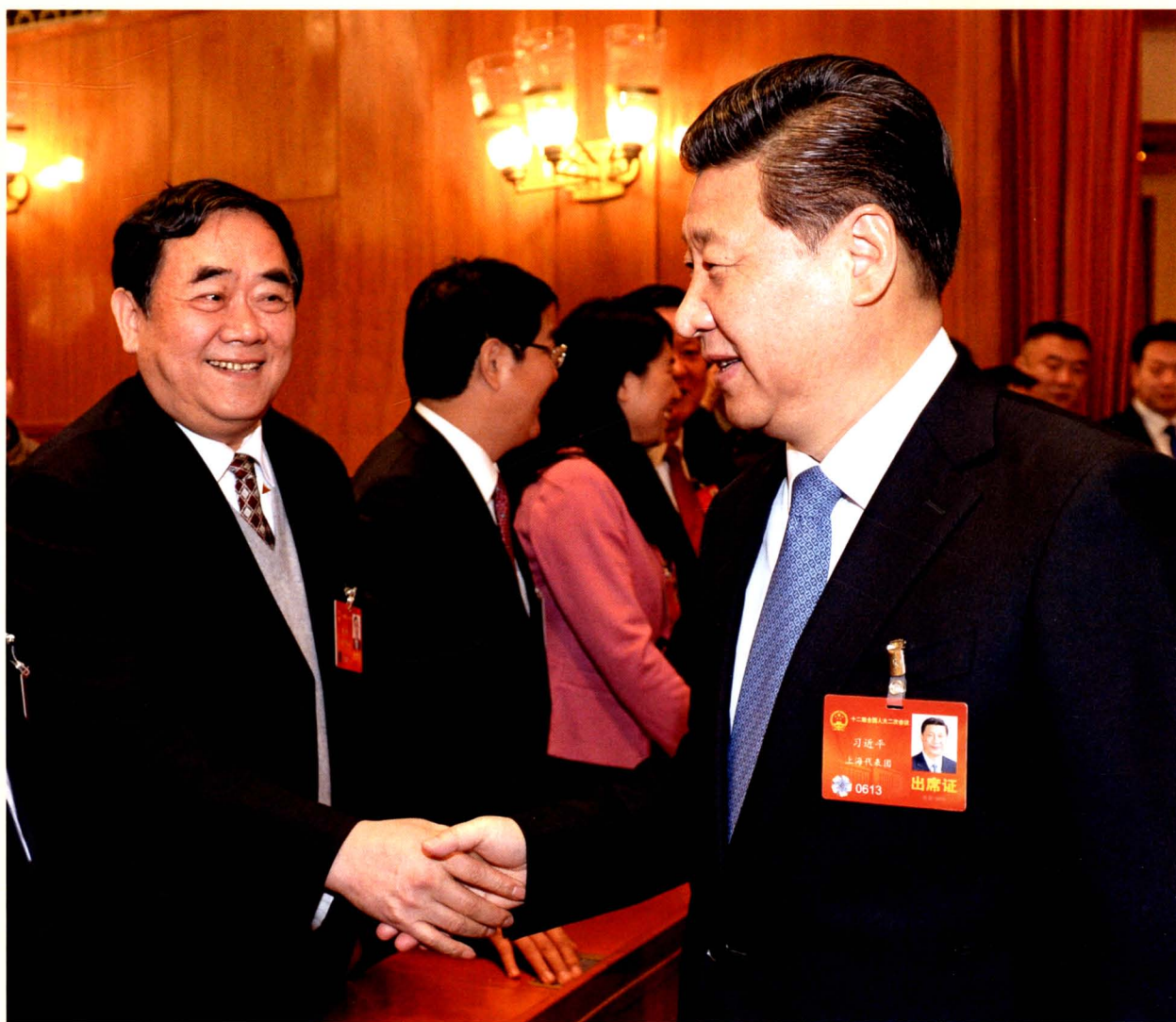
2014年3月4日，中共中央总书记、国家主席、中央军委主席习近平在全国人大十二届二次会议期间，接见济南圣泉集团股份有限公司董事长唐一林。