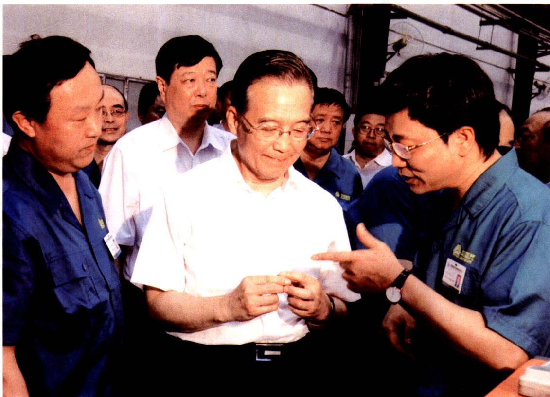
2009年6月27日，时任中共中央政治局常委、国务院总理温家宝（中）到章丘视察中国重汽集团济南商用车有限公司。