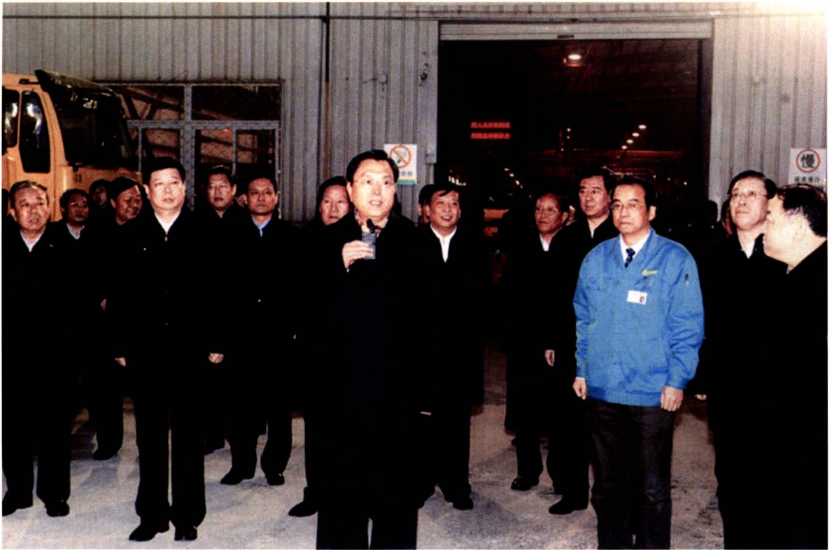
2010年2月8日，时任中共中央政治局委员、国务院副总理张德江（中）视察中国重汽集团章丘工业园。