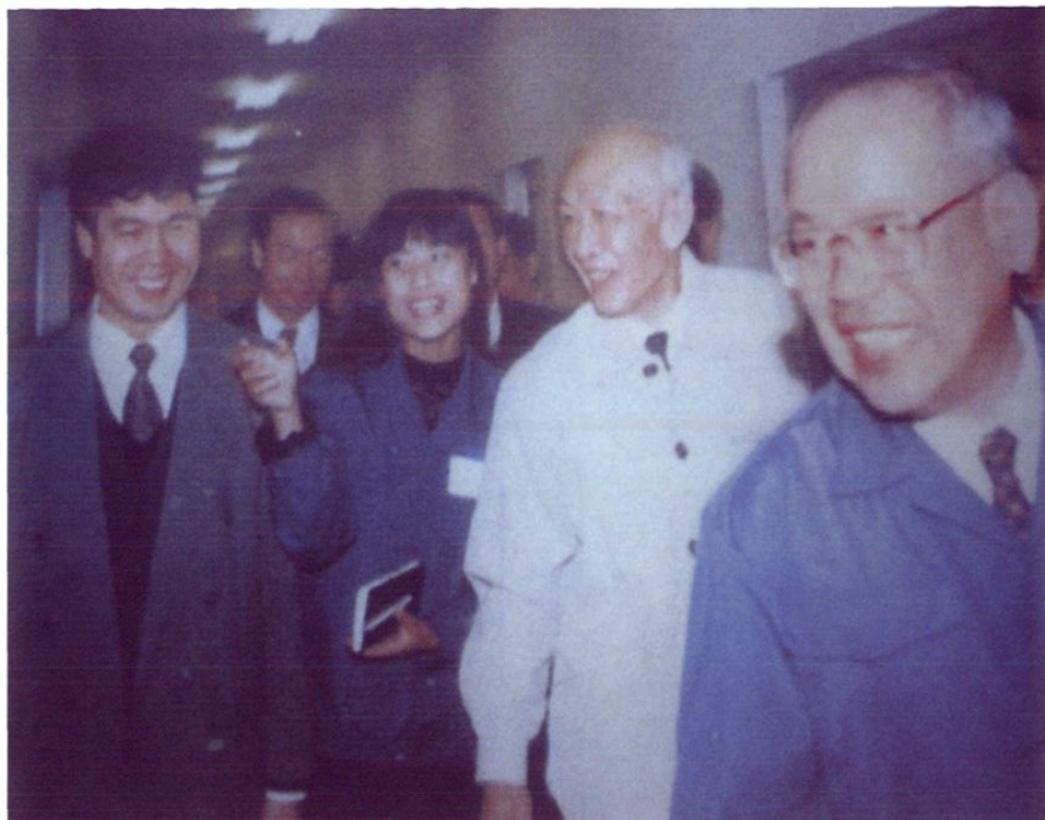
1995年11月27日，全国政协副主席、中国工程院院长朱光亚在武清县委副书记王树培陪同下视察武清开发区大真空公司。