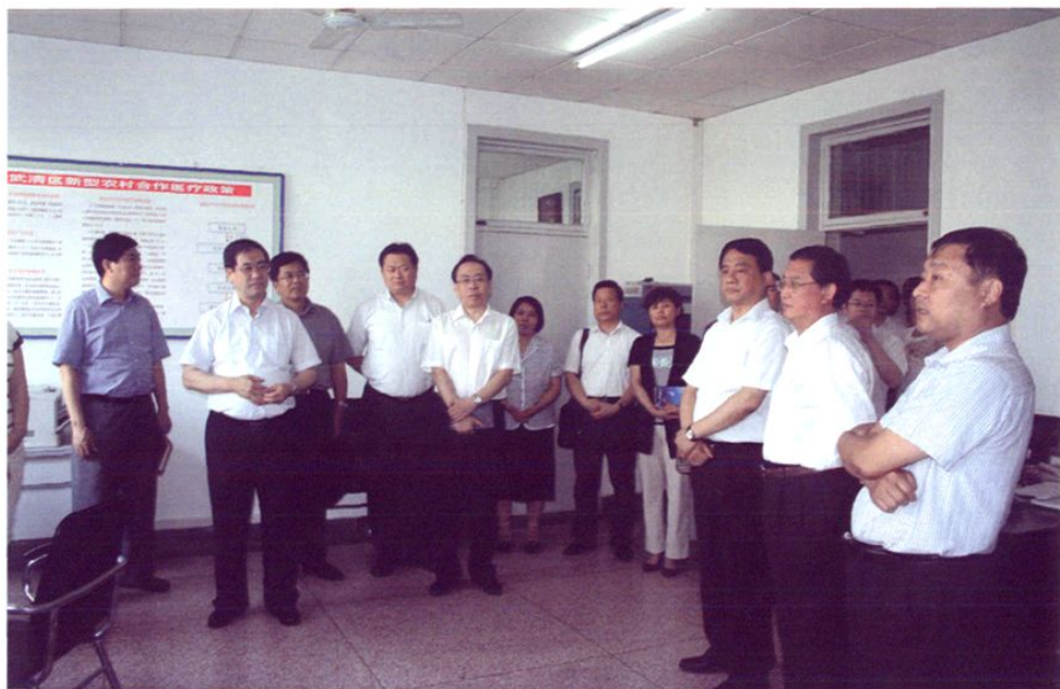
2010年6月22日，市委常委、副市长崔津渡一行，在区长张勇、常务副区长罗福来、副区长王学芝的陪同下，对我区城乡居民基本养老保障和基本医疗保险两项制度运行及企业劳动关系情况进行调研。