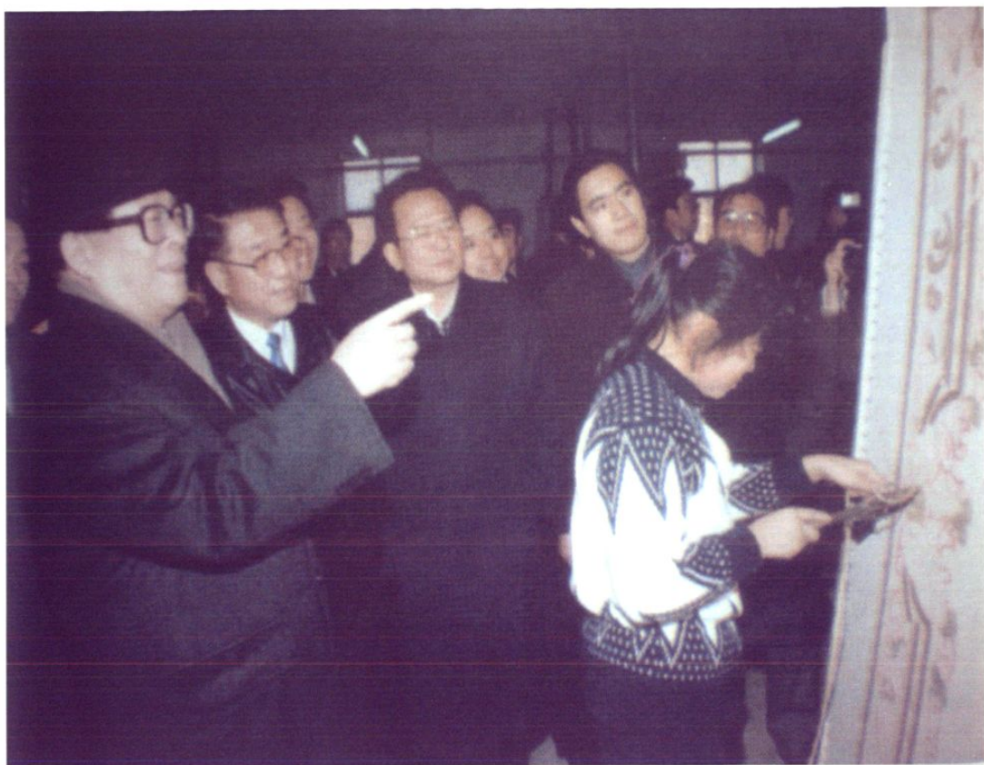
1994年12月13日，江泽民总书记在天津市委书记高德占、市长张立昌、市委副书记李建国及武清县委书记邵久武等陪同下，视察后蒲棒村地毯厂。