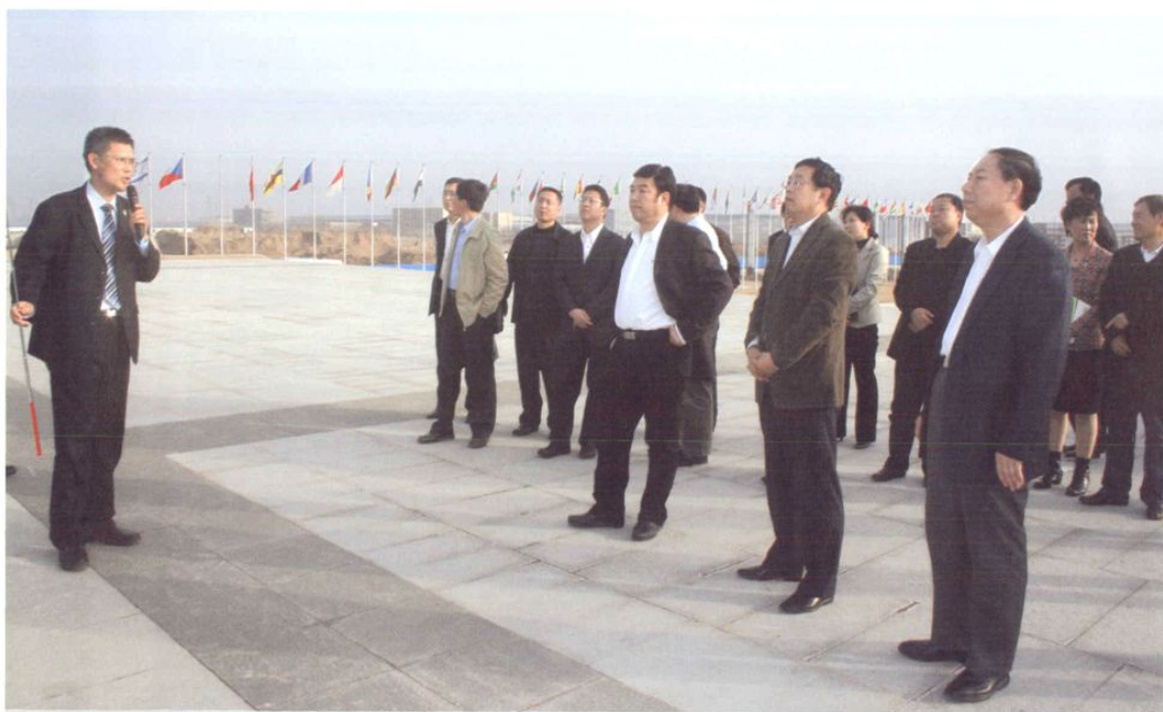
2009年3月18日，国家人力资源和社会保障部工伤保险司司长陈刚一行，在区委常委常务副区长李学鹏和市劳动保障局党组成员吴承明的陪同下，考察我区在金融危机影响下的劳动就业、社会保障和职工维权等情况。