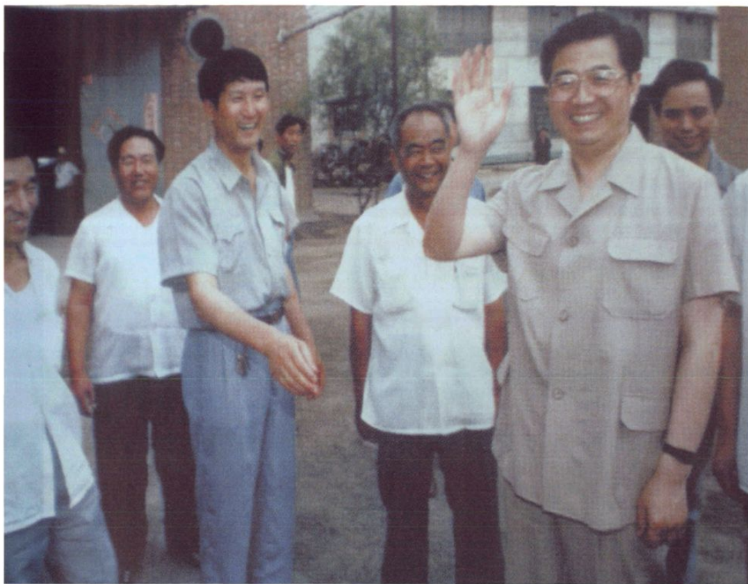
1994年6月22日，中共中央政治局常委、书记处书记胡锦涛在天津市委书记高德占、副书记李建国、组织部长房凤友及武清县委书记梁文忠等陪同下视察武清县张大庄村造纸厂。