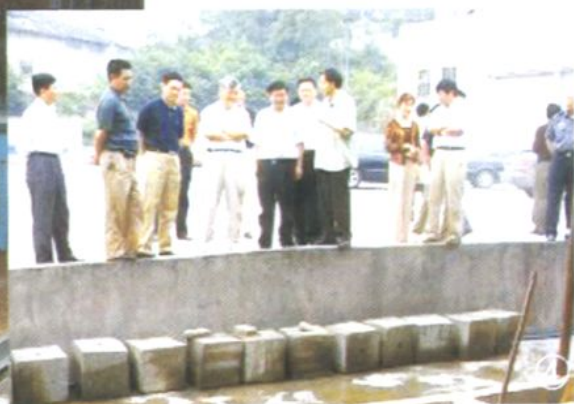
▲省委常委、省纪委书记沈国俊（①右3、②左1、③左1、④左4）一行，在内江、隆昌开展反腐倡廉调研并到川威、资中等地实地考察。