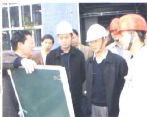
▲2006年3月22日，省委副书记、省纪委书记李崇禧（中图左3、下左图中、下右图右2）一行，与市委和市、县（区）纪委领导座谈并在市委书记、市人大常委会主任叶壮（右图右3）等领导的陪同下，到白马循环流化床示范电站等地考察。