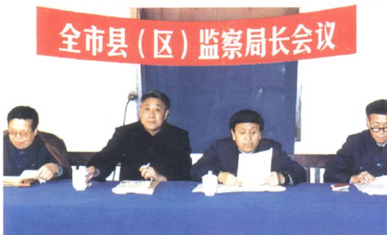
▶1988年4月23日，市委书记黄森荣（左1）、市委常委、代市长鲁绍彬（左2）、市人大常委会副主任杨贵元（右2）、市纪委副书记李利顺（右1）在全市县（区）监察局长会上并讲话。