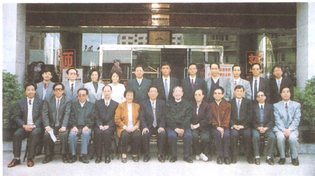
▲1997年3月，中央纪委副书记、监察部部长曹庆泽（前排右7）一行，来内江视察工作并与市领导合影留念。