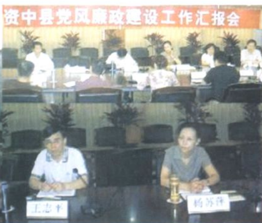
▲2005年5月25日，省监察厅副厅长杨苏萍（女）一行，在市委副书记、市纪委书记王志平等领导陪同下，在资中县就党风廉政建设等工作进行调研。