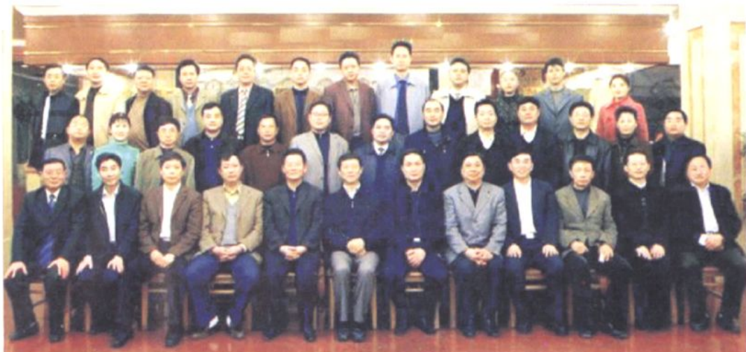
▲ 2006年3月21日，省委副书记、省纪委书记李崇禧（前排右7）一行，来内江检查指导工作并与市委、市政府和市纪委、市监察局领导及县（区）纪委书记、市纪委监察局机关室主任等领导合影。