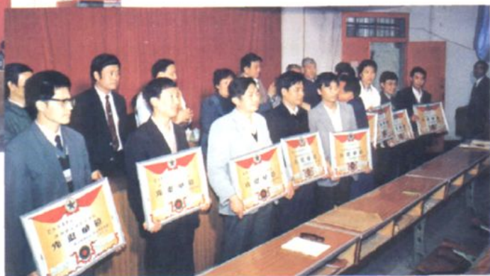
▲1991年4月11日至12日，内江市监察工作会议暨表彰大会召开，并为受表彰的全市监察系统先进集体和先进工作者颁奖。