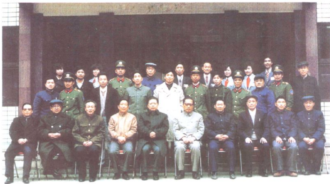
▲1988年2月14日，中共中央政治局常委、中央纪委书记乔石（前排右5）一行，来资阳等地视察工作并与内江市委、市纪委和资阳县等党政领导合影留念。