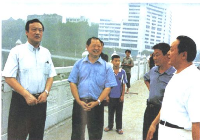
◀2003年7月29日，中央纪委委员、中央纪委驻交通部纪检组组长金道铭（左1）一行，在市委副书记、市纪委书记彭智勇（左2）和副市长王宾（右1）、市交通局局长肖鸣学（右2）的陪同下，考察内江治理公路“三乱”和交通基础设施建设。