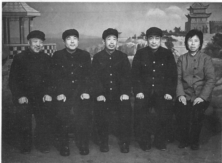
聊城市商业局正、副局长书记合影