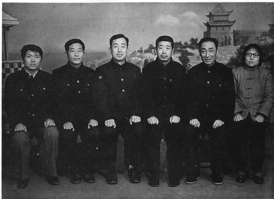
《聊城商业志》编辑组人员合影