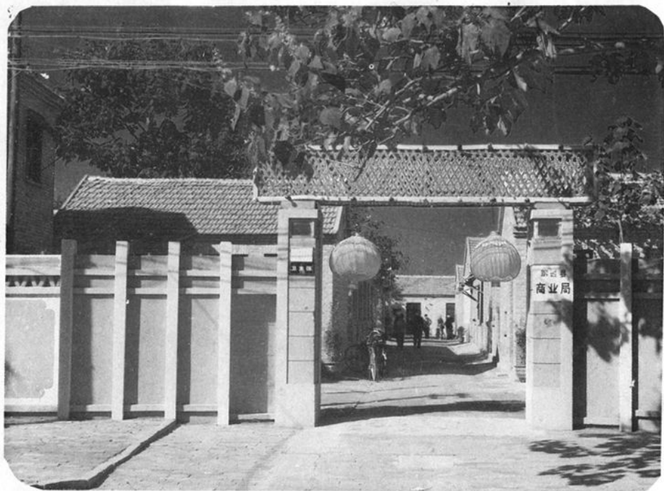
聊城市商业局景照