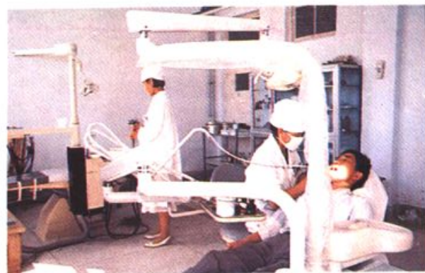
1993年12月,引进美国A-DEC公司产CASCAD E型牙科综合治疗机。