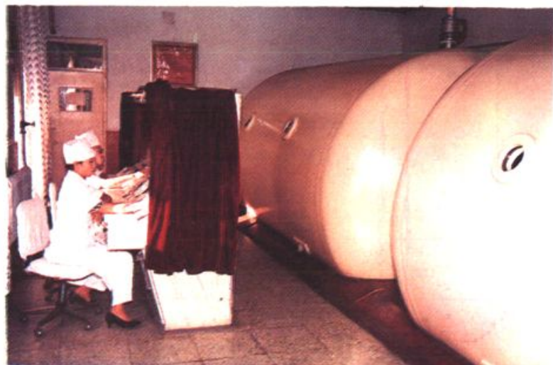
1990年3月,医院自筹资金455600元购进大型高压氧舱