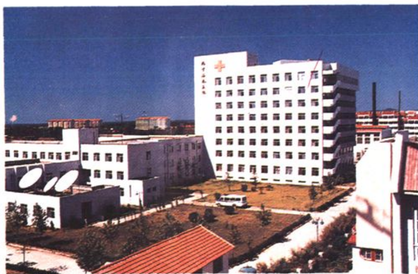
1992年，在烟台市幸福路100号建成占地21298平方米、建筑总面积12867平方米的新医院