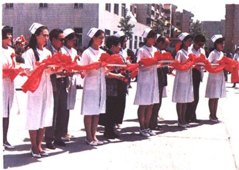
领导为新院开业剪彩(左起:省卫生厅医政处处长孙昭水、卫生部医政司司长迟宝兰、烟台市副市长李皆荣、烟台港务局局长朱毅)