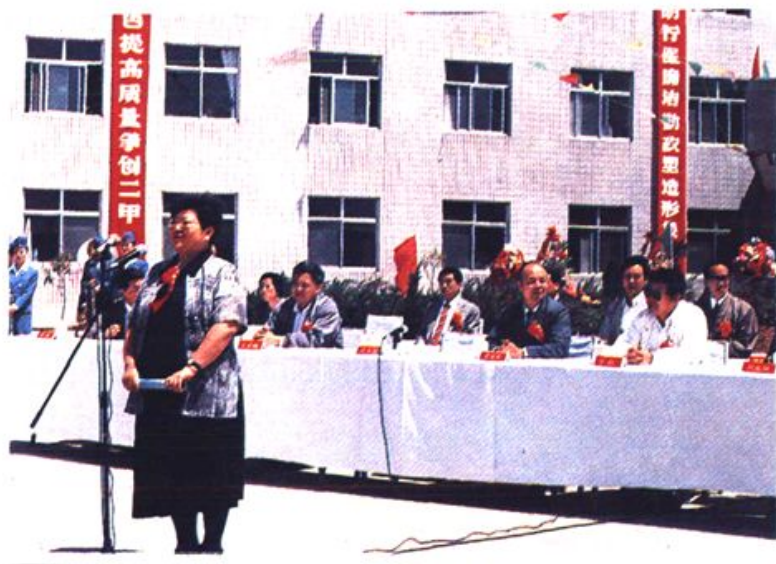
卫生部医政司司长迟宝兰在新院开业典礼上讲话