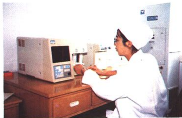
1993年5月,引进日本产F800全血细胞分析仪