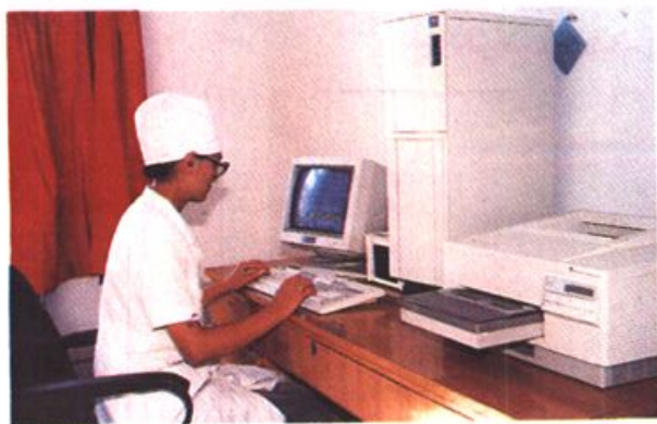
1993年7月,引进美国GP公司产GP-7000型动态心电图仪