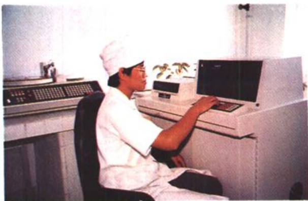
1993年4月,引进美国产安科■型全自动生化分析仪