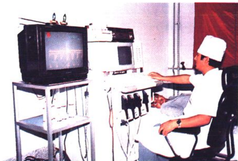
1992年11月,引进美国产ACUSON128-XP彩色电脑声像仪