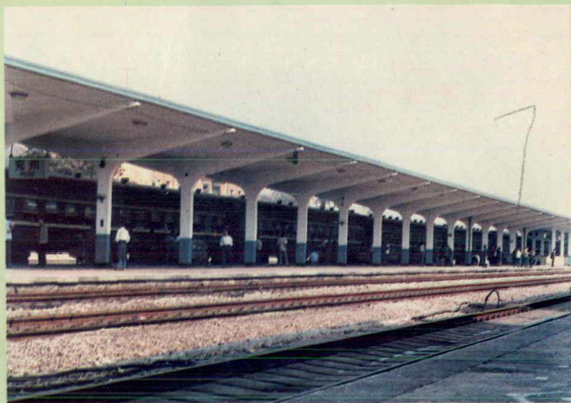
站台、雨棚客运设施