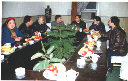
▲ 市政府領導到平原飯店視察工作