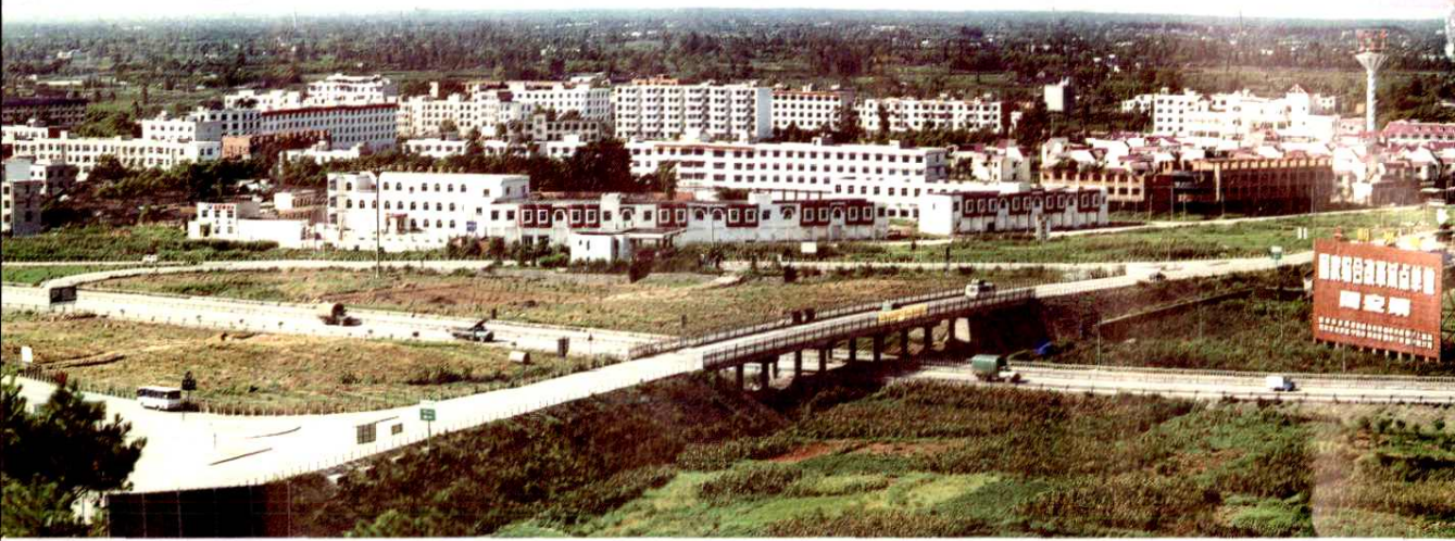
国家综合改革试点单位——同安镇