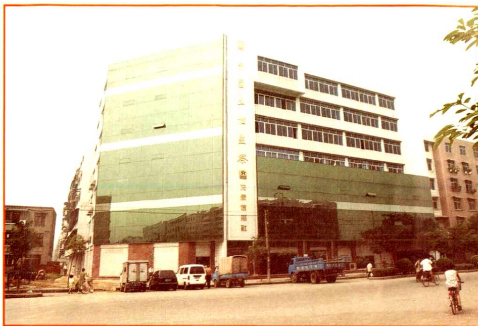
国土局新办公大楼