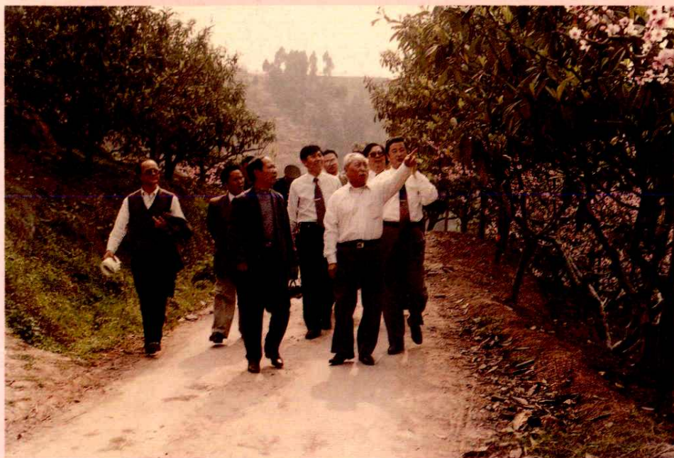
全国政协副主席杨汝岱（前排右一）视察龙泉驿区土地开发