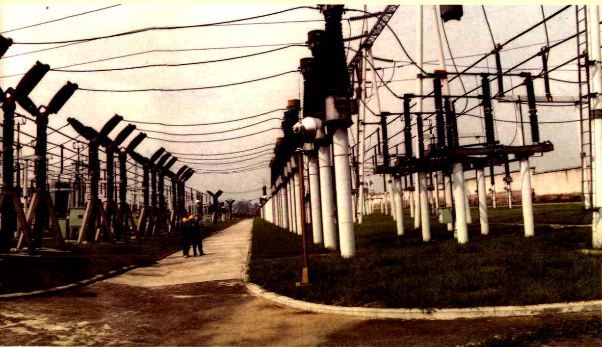
大面镇220千伏变电站