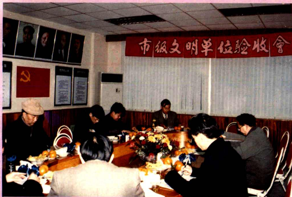
成都市文明单位验收会