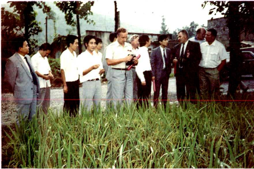
土地开发整治 白俄罗斯总统考察龙泉