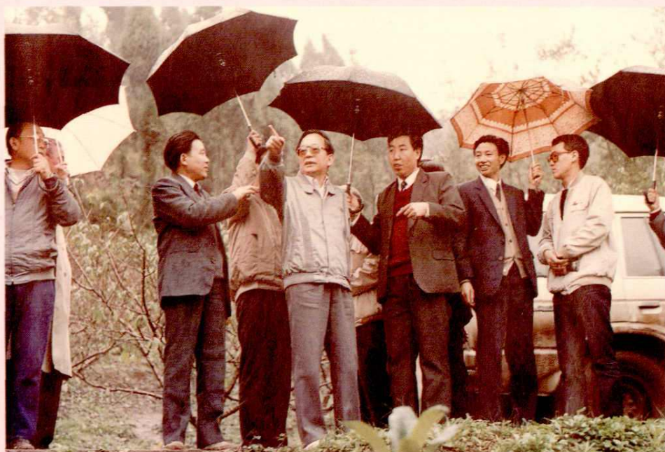
全国人大副委员长田纪云（右四）视察龙泉驿区土地管理工作