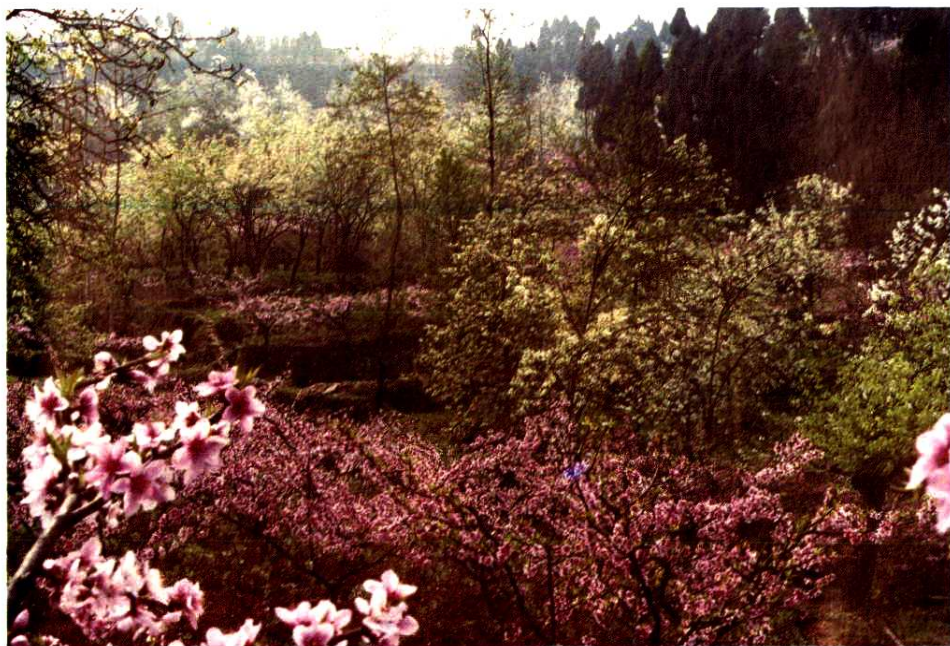
龙泉驿花果山一瞥