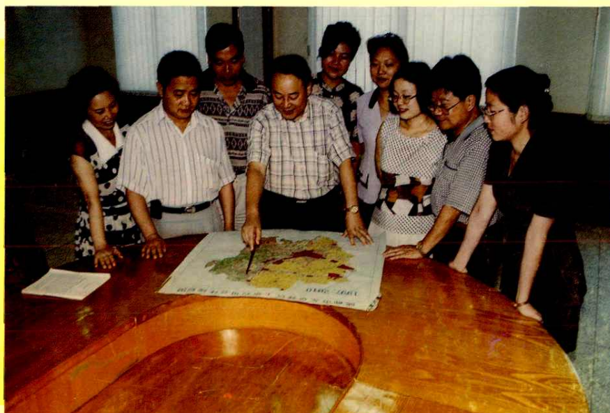
制定总体规划方案