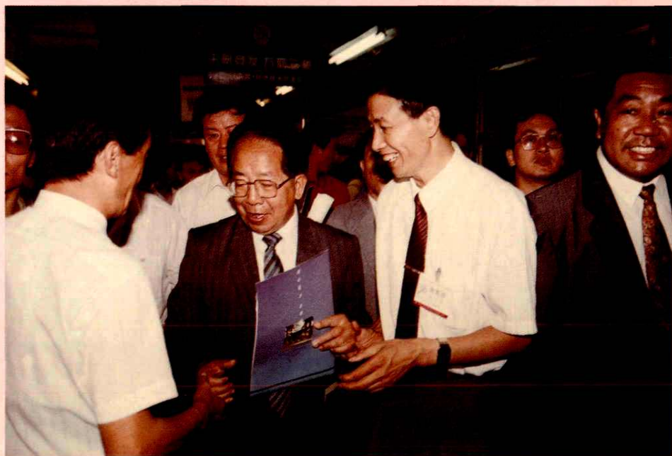
国务院特区办主任胡平（左二）视察成都经济技术开发区