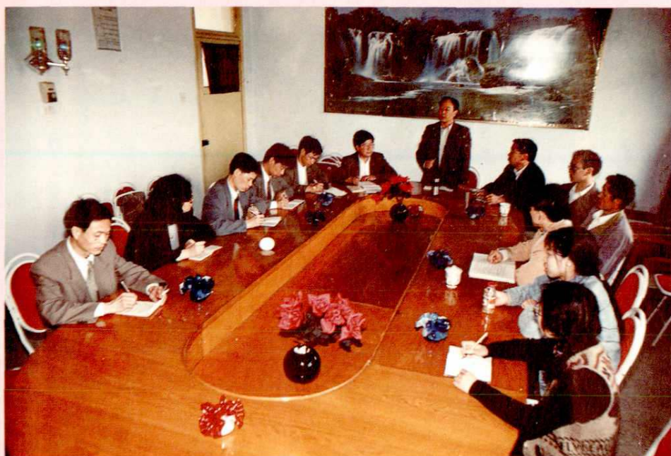
区国土局集体审批土地