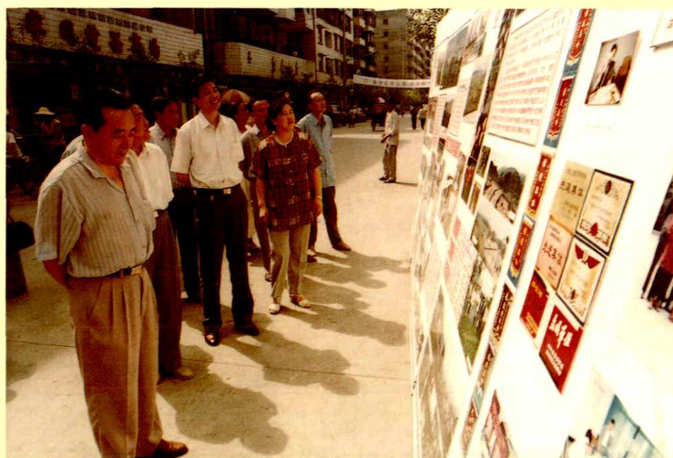
区四大班子领导观看龙泉驿区国土成果图片展