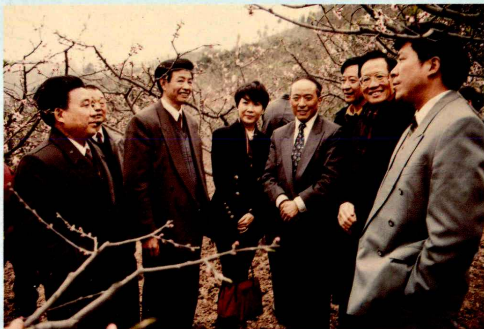
省委副书记、常务副省长蒲海青（右四）视察龙泉驿区土地开发