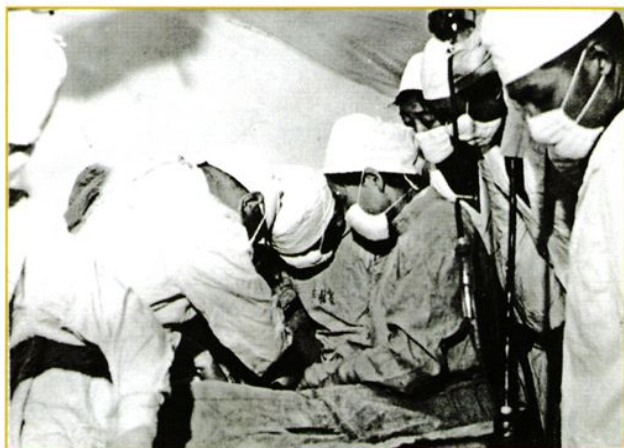
为战俘伤员紧急手术