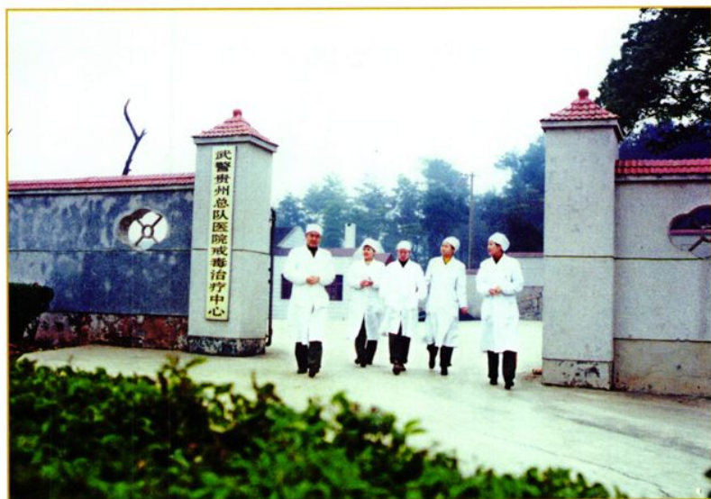
武警贵州总队医院戒毒所一角