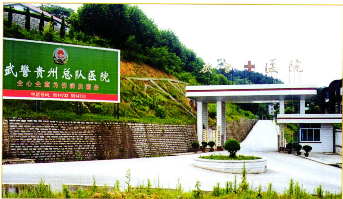
武警贵州总队医院大门