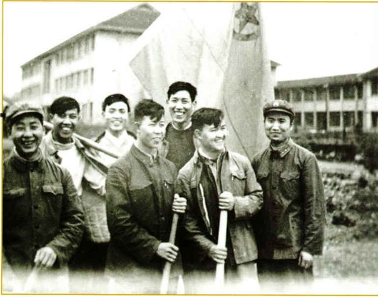
1960年送往解放军第44医院 进修的部分同志合影