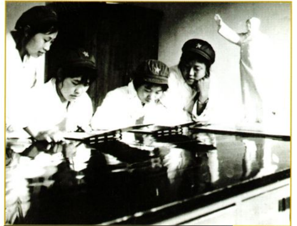
1969年外科护士在办公室查对医嘱