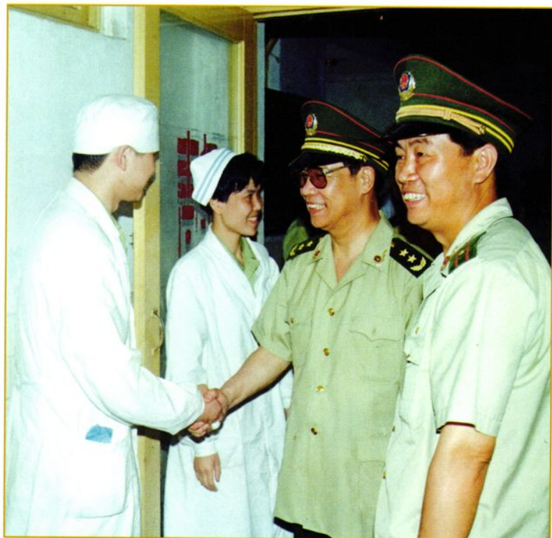
1995年9月武警部队司令员巴中俊中将（左三）在医院视察工作时亲切看望医护人员和伤病员