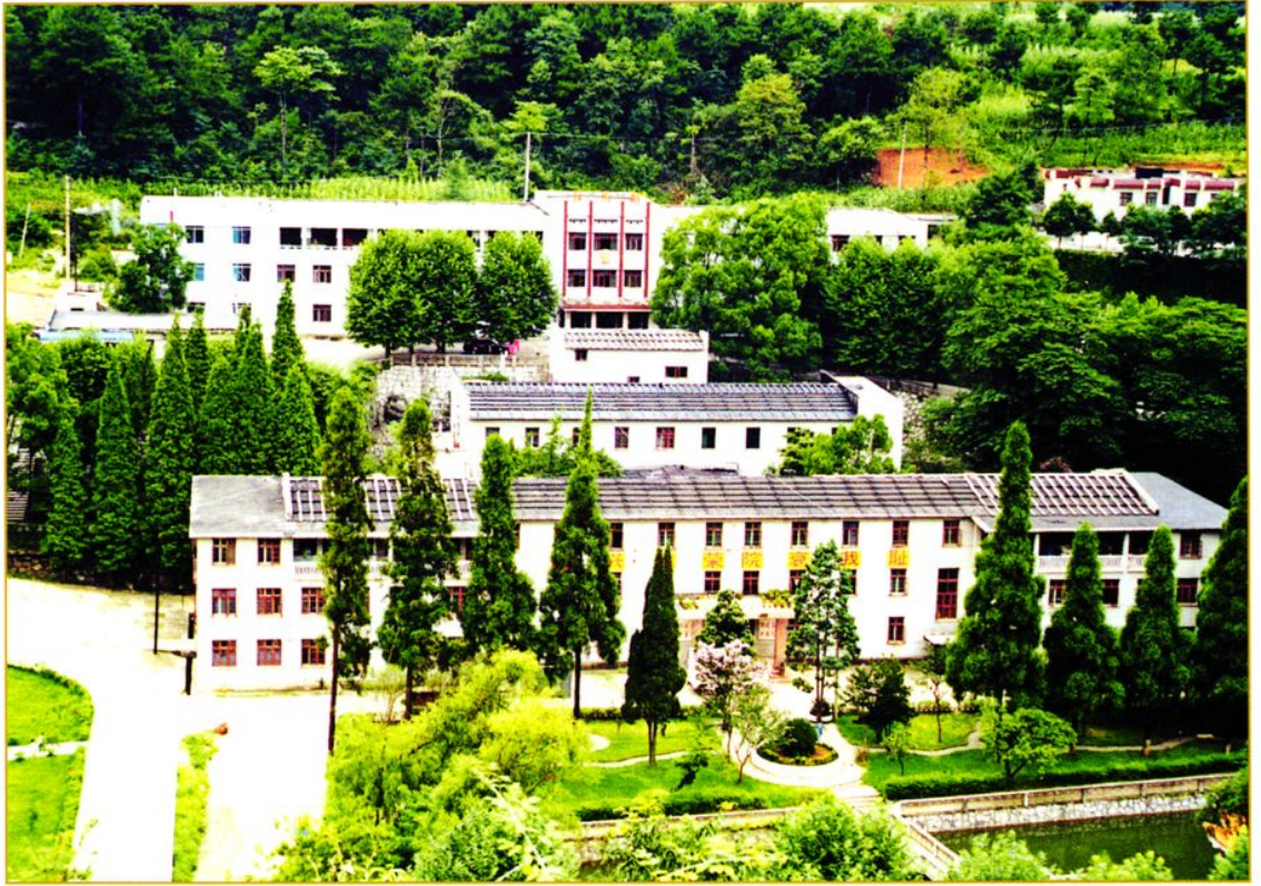
医院住院部及门诊楼全景