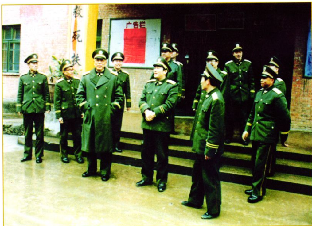
1992年3月武警总部政委徐寿增中将在医院视察工作