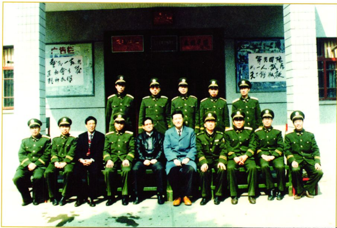
1993年3月5日贵州省省长陈士能（前排左6），省委副书记王思齐（前排左5），公安厅副厅长文明铤（前排左7）等到医院视察工作时与院领导的合影