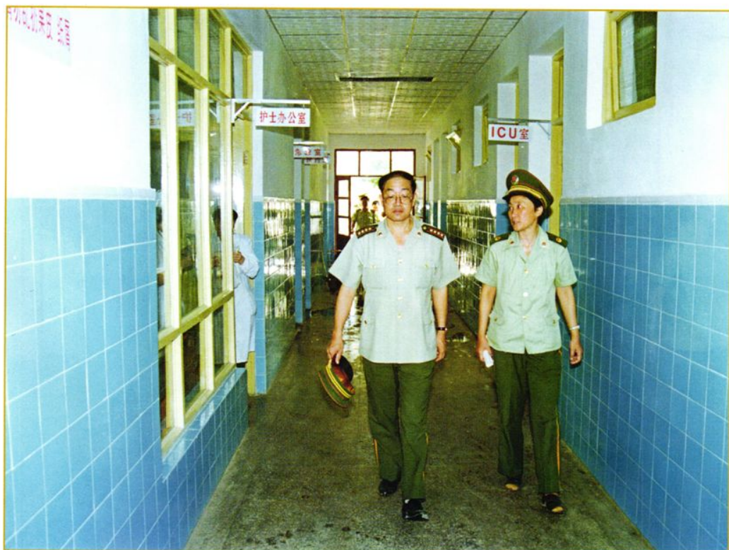
1997年武警贵州省总队总队长王应学大校（左一）在医院视察工作