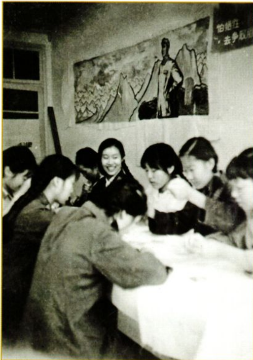
1969年内科部分医护人员在 绣制毛主席像