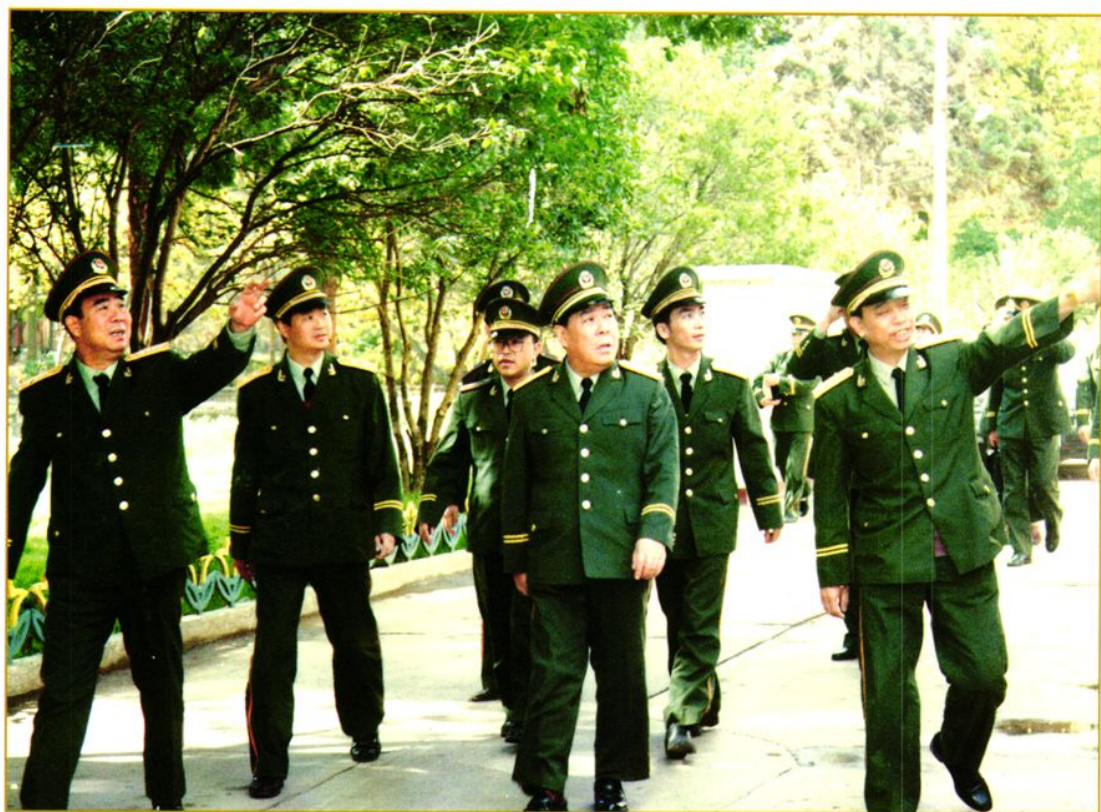
1996年9月武警部队司令员杨国屏中将（右二）在医院视察工作