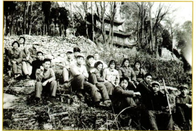
1964年医院迁往晒田坝后建院劳动 休息中部分干战合影