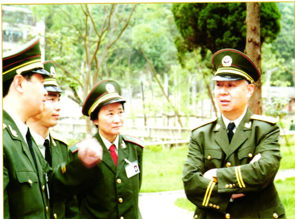
1997年武警总部副司令员高文远(右一)在医院视察工作

2000年11月1日武警总部副政委张钰钟中将和副参谋长霍毅少将及总队领导来医院检查工作后与院领导一班人合影。