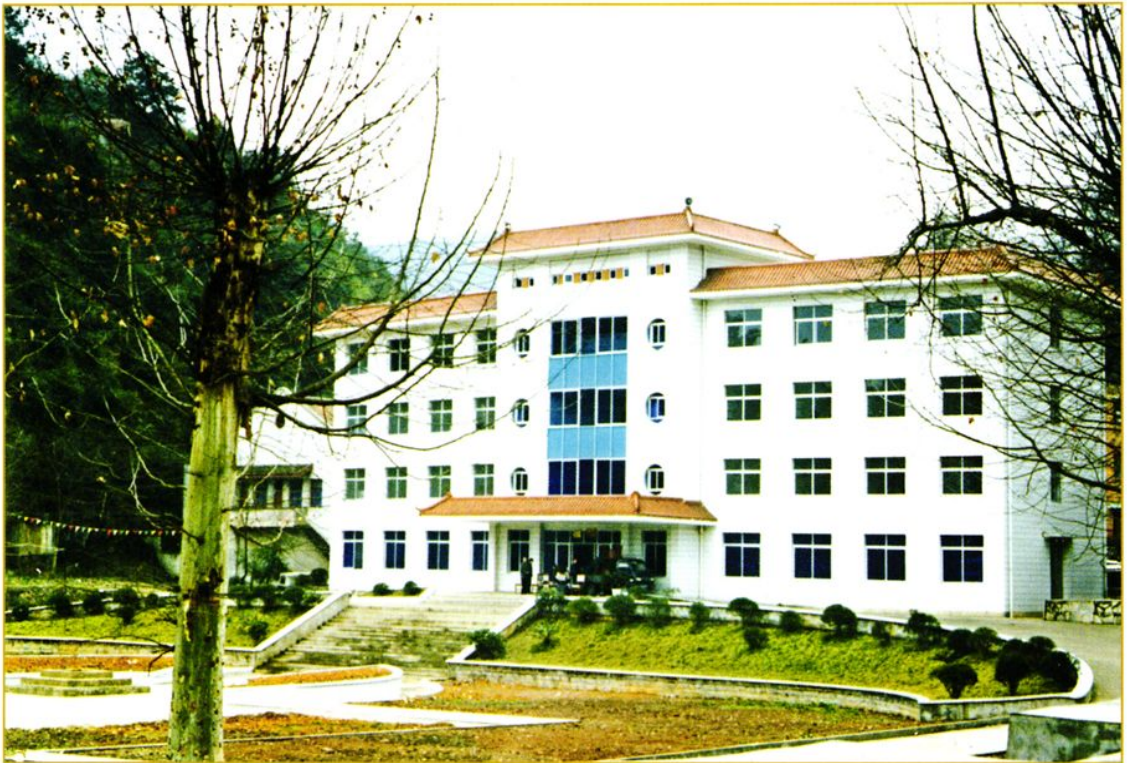
武警贵州总队医院办公楼