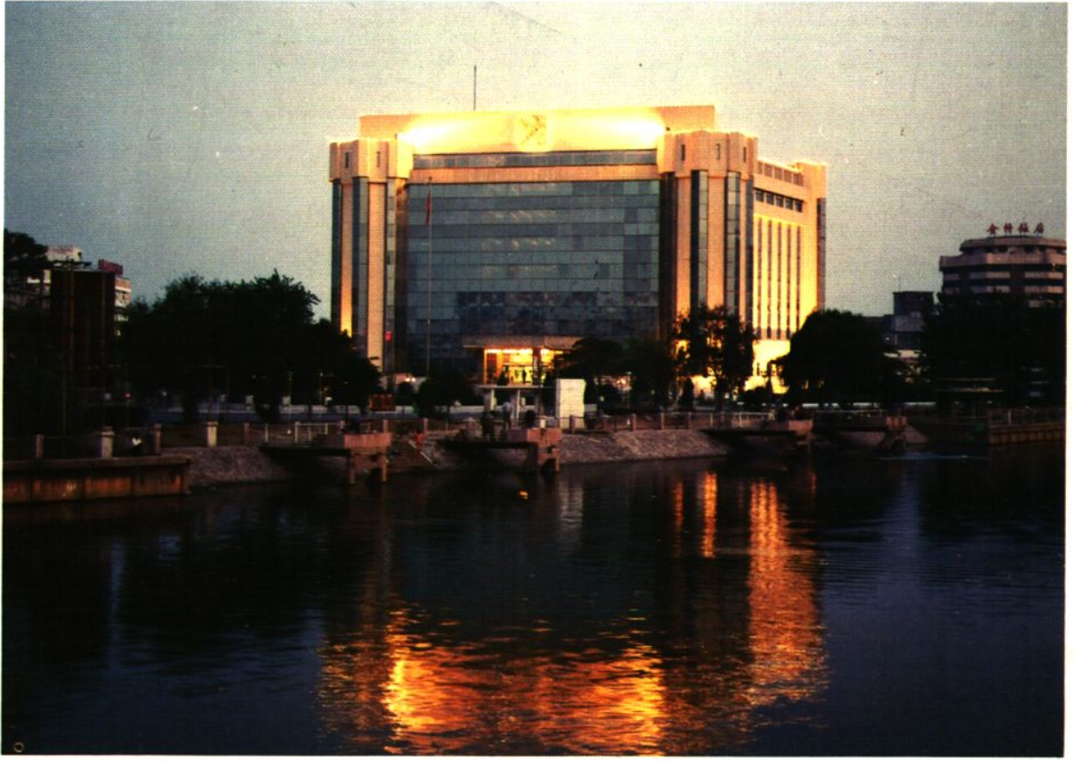
天津海关新办公楼