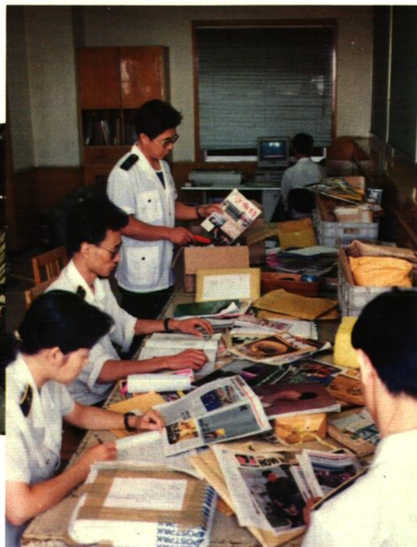
关员对进境印刷品进行监管