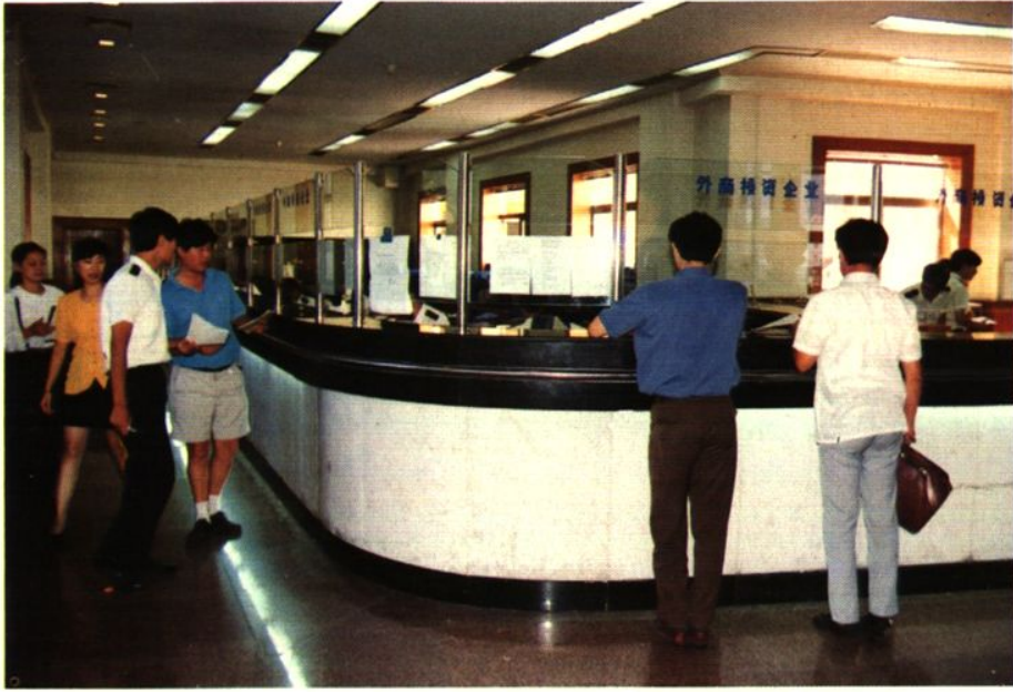
天津海关报关大厅