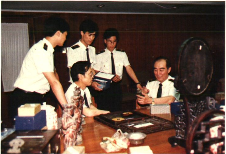
关长和关员查缉文物走私。