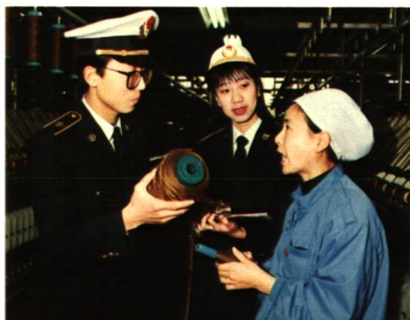
海关关员对保税工厂进行监管