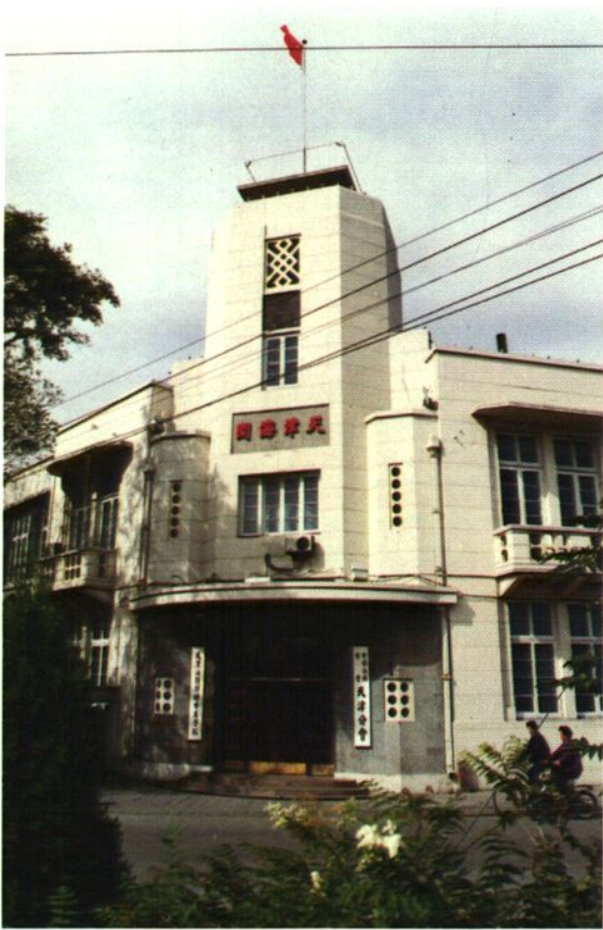
◀天津海关旧址(和平区营口道2号)