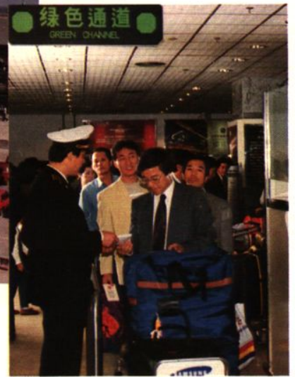
海关关员为进出境旅客办理手续