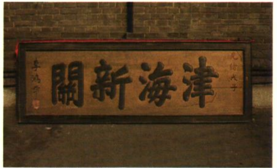
▲1888年10月李鸿章在津题写的匾额。