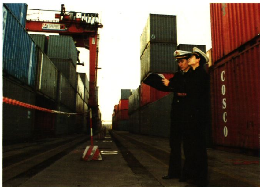
海关关员对集装箱货物进行监管