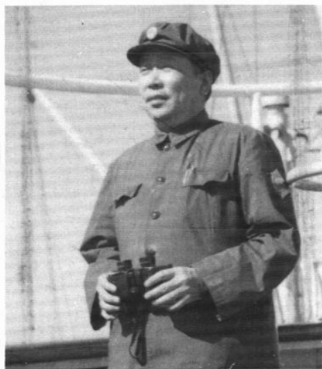
1971.1.天津海关降为局属公司级。 ▶1971.2.—1978.5.徐玉峰 同志任天津海关关长。