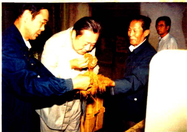
■ 1988年3月，内蒙古自治区党委书记王群（左二）在呼和浩特卷烟厂生产车间视察。