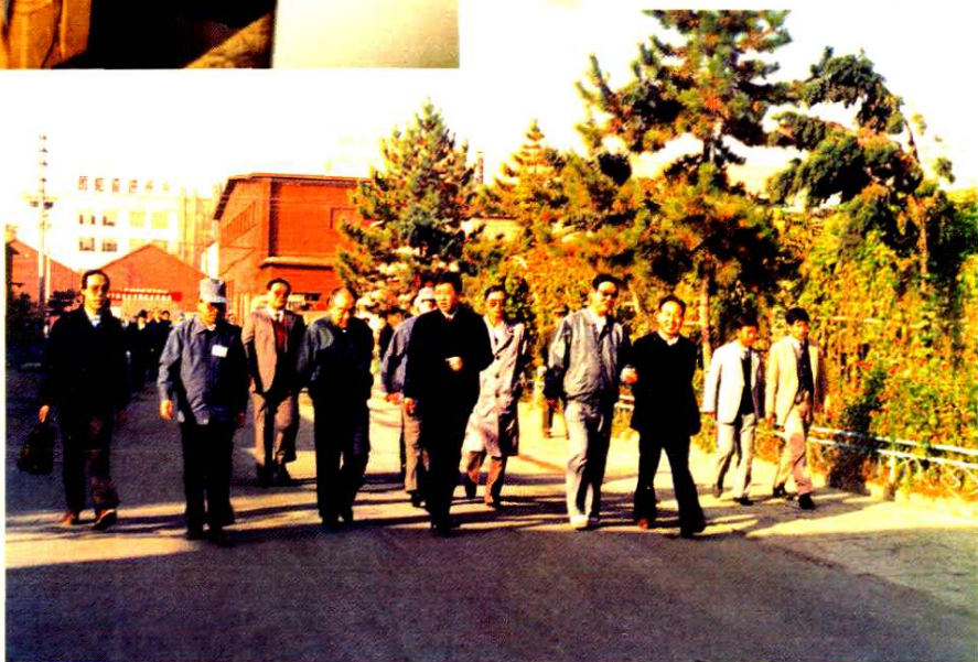
■ 1991年10月18日，内蒙古自治区政府主席布赫（前排左三）、自治区党委副书记白恩培（前排左四）在自治区烟草公司经理张毅（前排左五）的陪同下莅临呼和浩特卷烟厂视察。