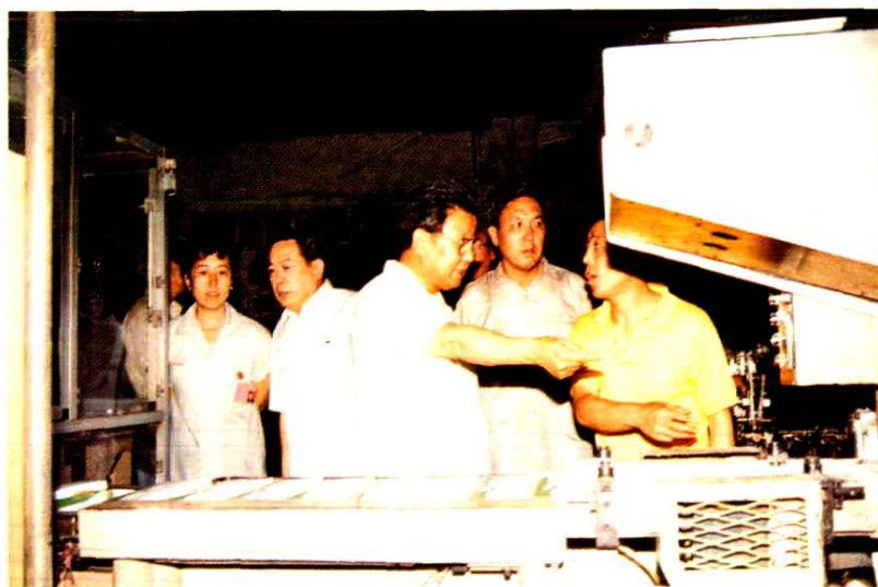
■ 1993年8月，内蒙古自治区政府主席乌力吉（左三）在呼和浩特卷烟厂生产车间视察。