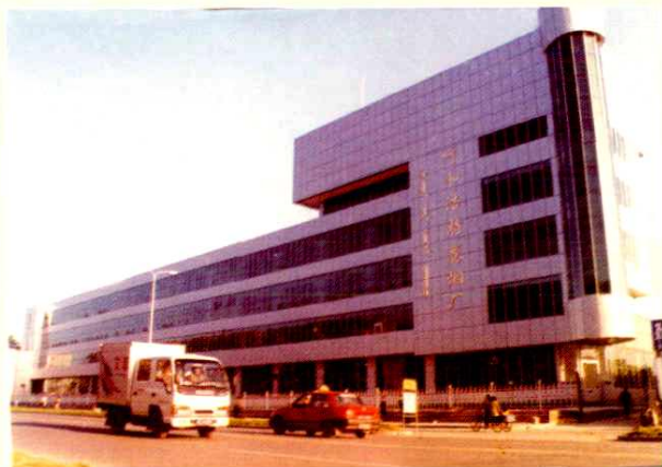
■ 呼和浩特卷烟厂厂址