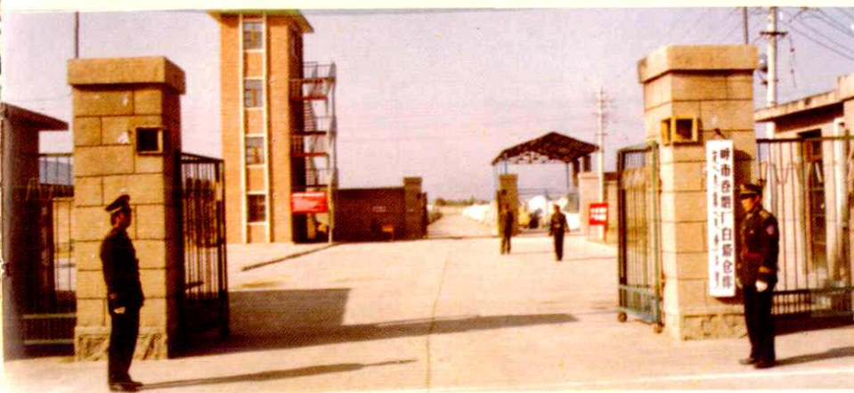
■ 呼和浩特卷烟厂白塔仓库