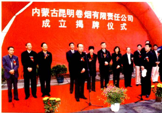
■ 2003年10月10日，内蒙古昆明卷烟有限责任公司举行成立揭牌仪式。