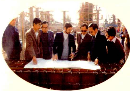
■ 呼和浩特卷烟厂“七·五” 技术改造施工现场