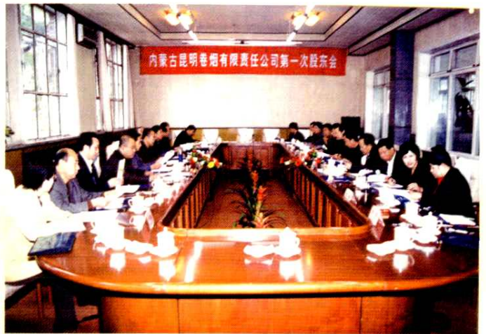
■ 2003年10月10日，内蒙古昆明卷烟有限责任公司在呼和浩特市召开第一次股东会、董事会和监事会。