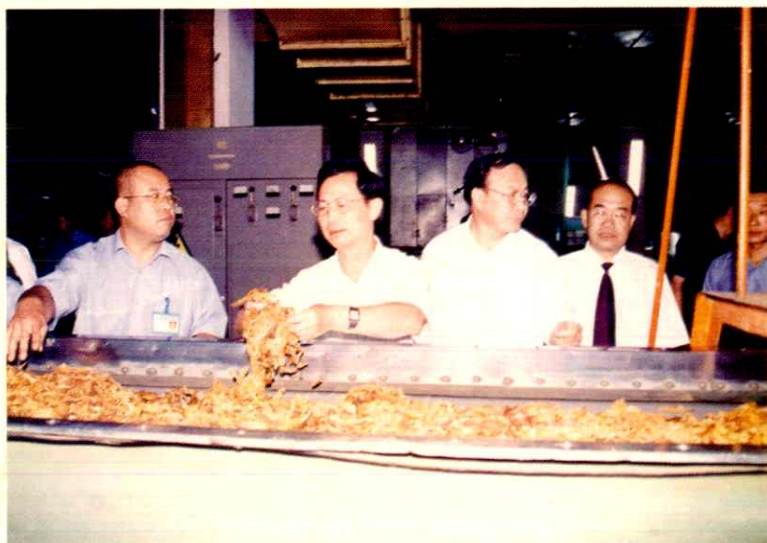
■ 2003年8月27日，国家烟草专卖局副局长杨传德（左二）在自治区党委常委、市委书记牛玉儒（右二）、自治区烟草专卖局局长董晓民（右一）、呼和浩特卷烟厂厂长李建平（左一）的陪同下视察呼和浩特卷烟厂。