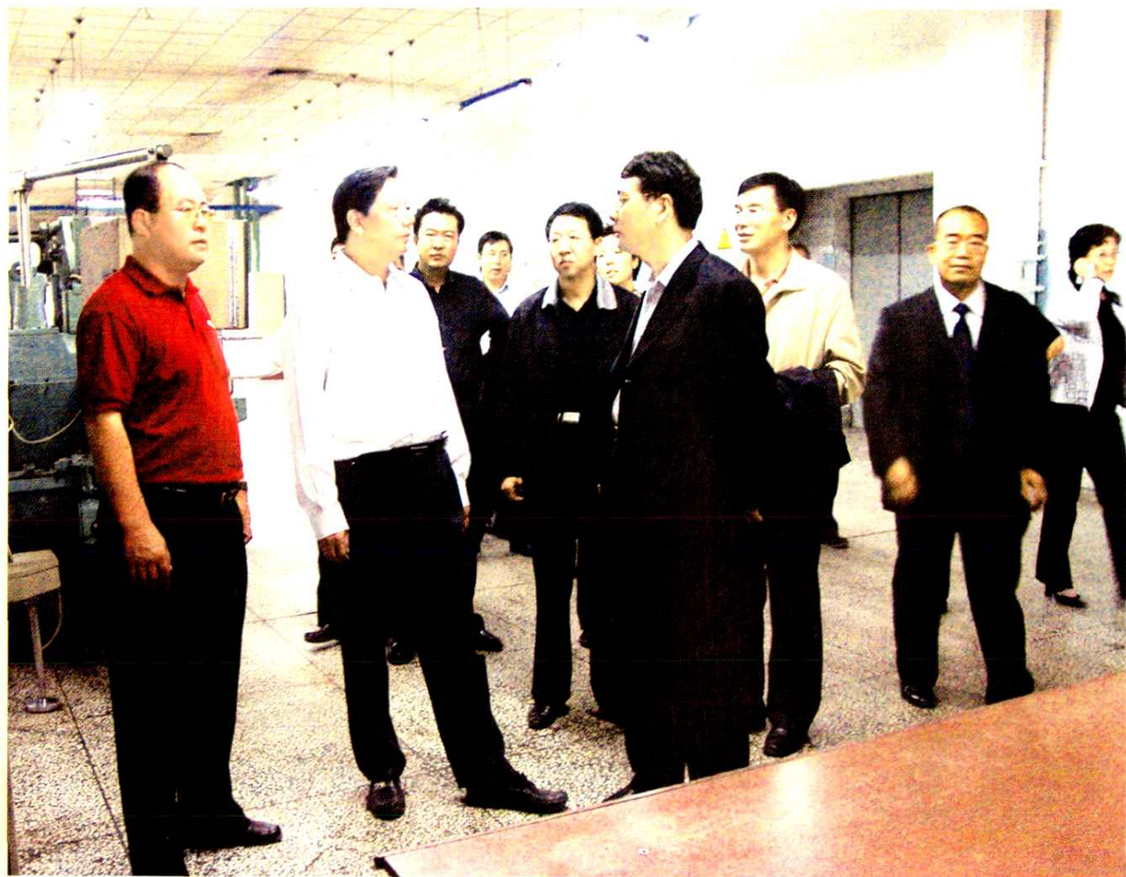
■ 2005年9月28日,国家烟草专卖局局长姜成康(前左二)、副局长李克明(前左三)等领导在自治区政府副主席乌兰,呼和浩特市常务副市长张院忠,自治区烟草专卖局局长董晓民,中国烟草实业发展中心总经理许志龙,副总经理、蒙昆公司董事长李保林,蒙昆公司总经理李建平,第一副总经理夏家全等同志的陪同下,莅临内蒙古昆明卷烟有限责任公司视察。