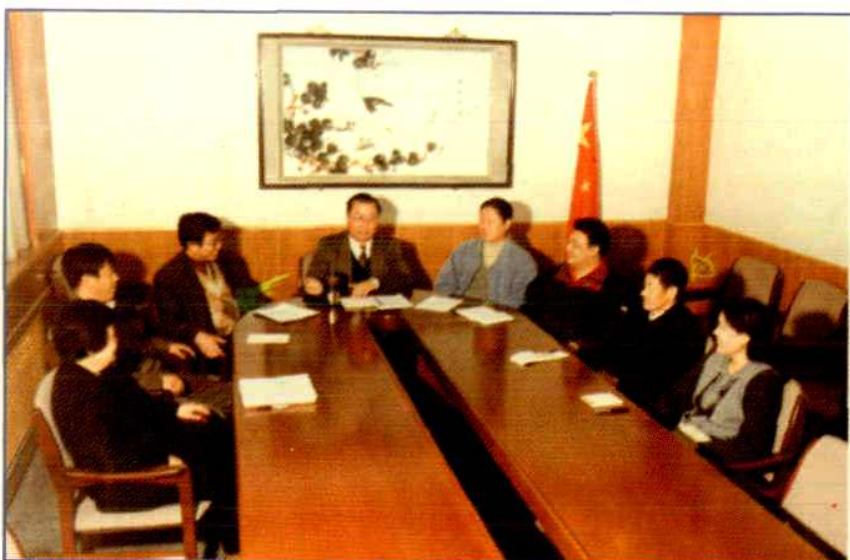
内蒙古种子管理站领导 班子在研究种子工程