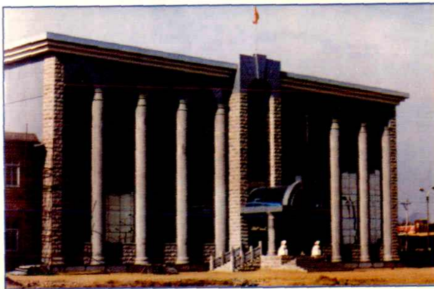
内蒙古自治区农作物种子质量监督检测中心