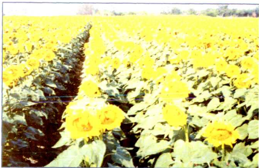
大面积油菜制种田