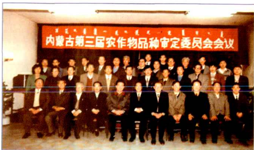
参加内蒙古第三届农作物品种审定委员会全体委员合影