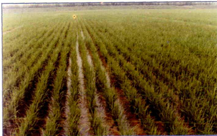
我区大面积水稻生产田