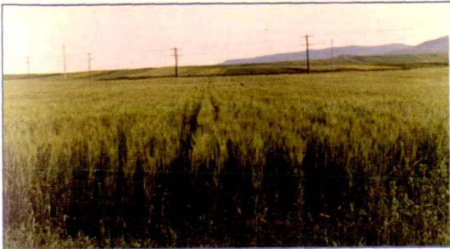
我区大面积小麦种子田