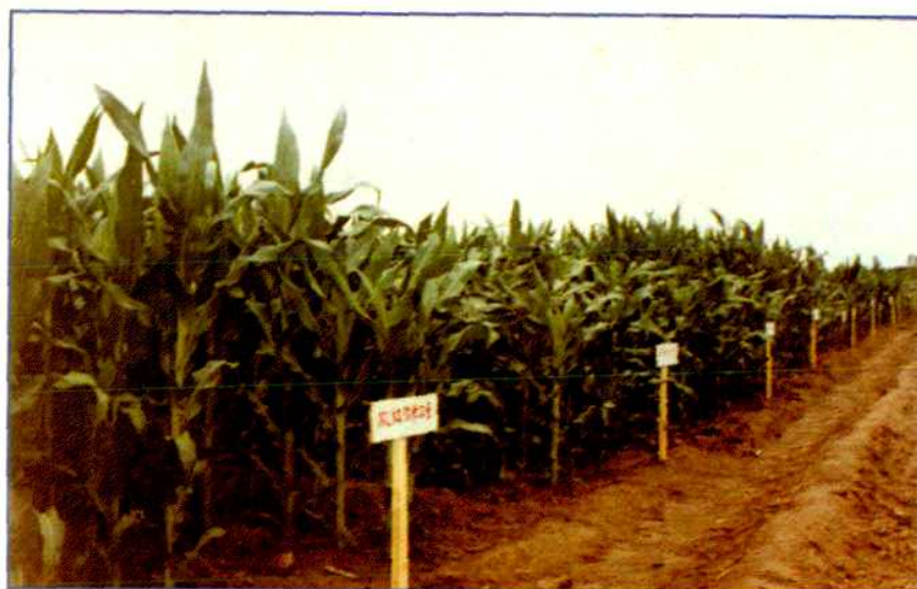
玉米引种区域试验田