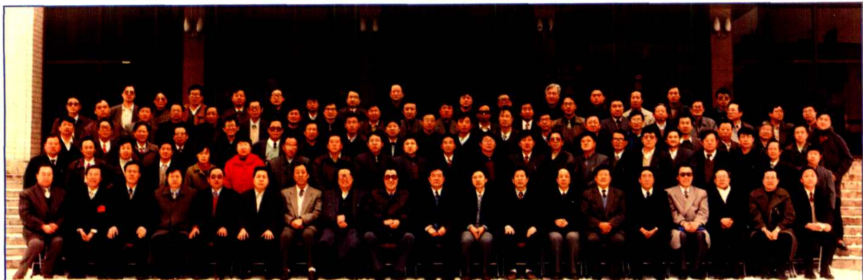
自治区政府副主席傅守正（前排左数10）与全区农业种子工作会议代表合影