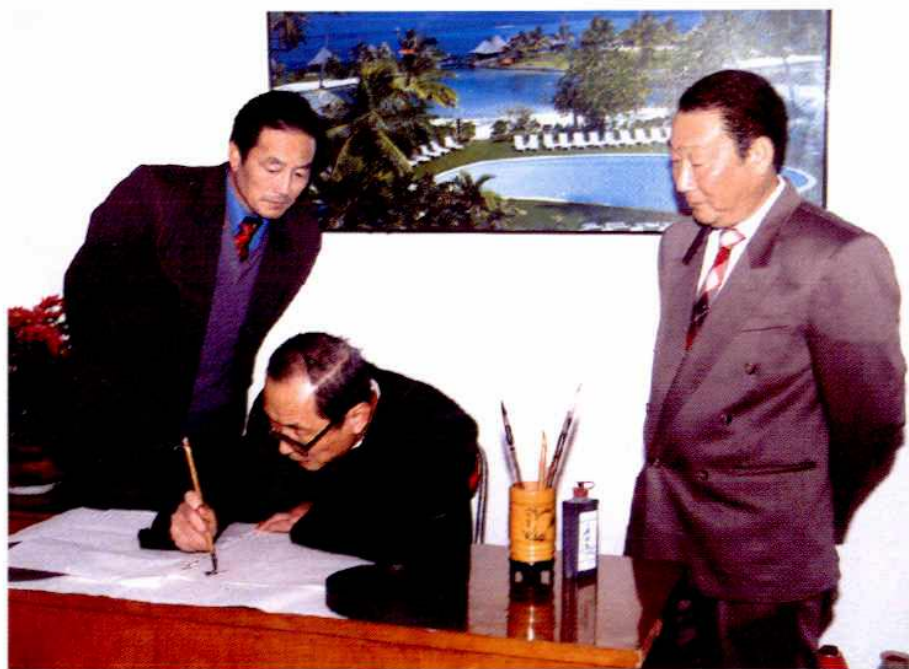
国家卫生部部长陈敏章为合肥市卫生防疫站题词(1993年)