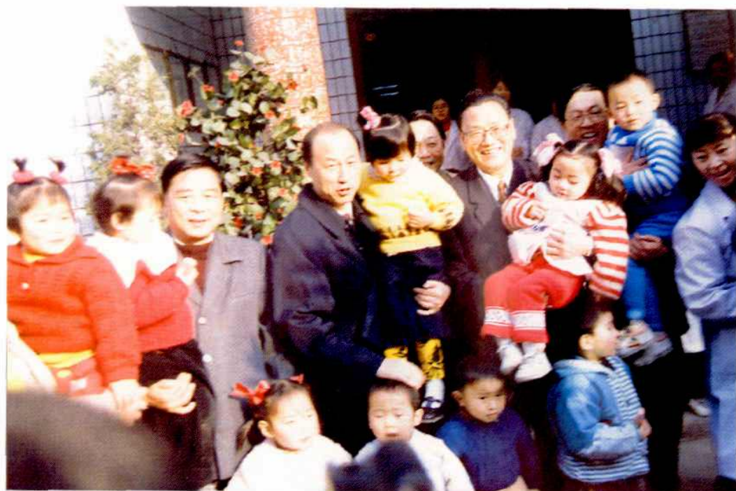
省委书记卢荣景、副书记王太华、省人大主任孟富林、副省长杜宜瑾参加合肥市儿童计划免疫活动(1995年)