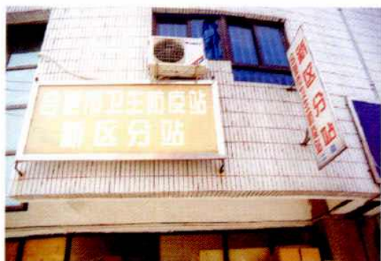
合肥市卫生防疫站东区分站