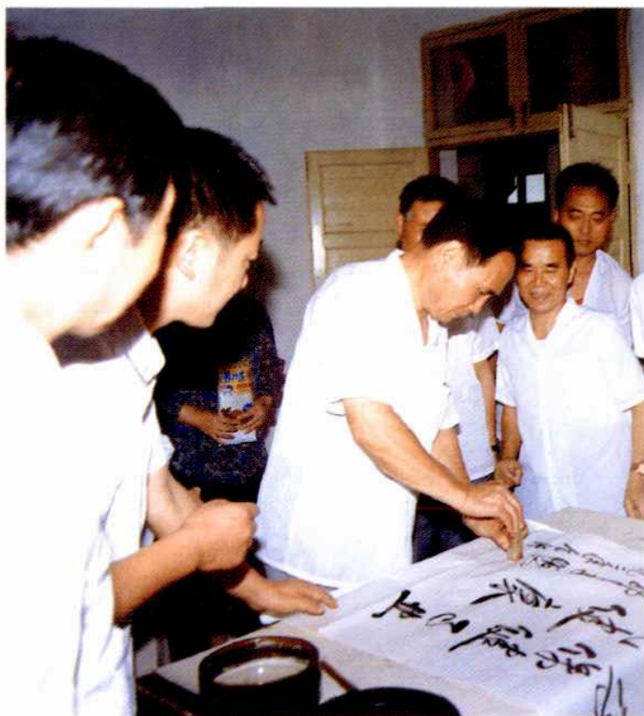
国家卫生部副部长郭子恒为合肥市卫生防疫站题词 (1992年)