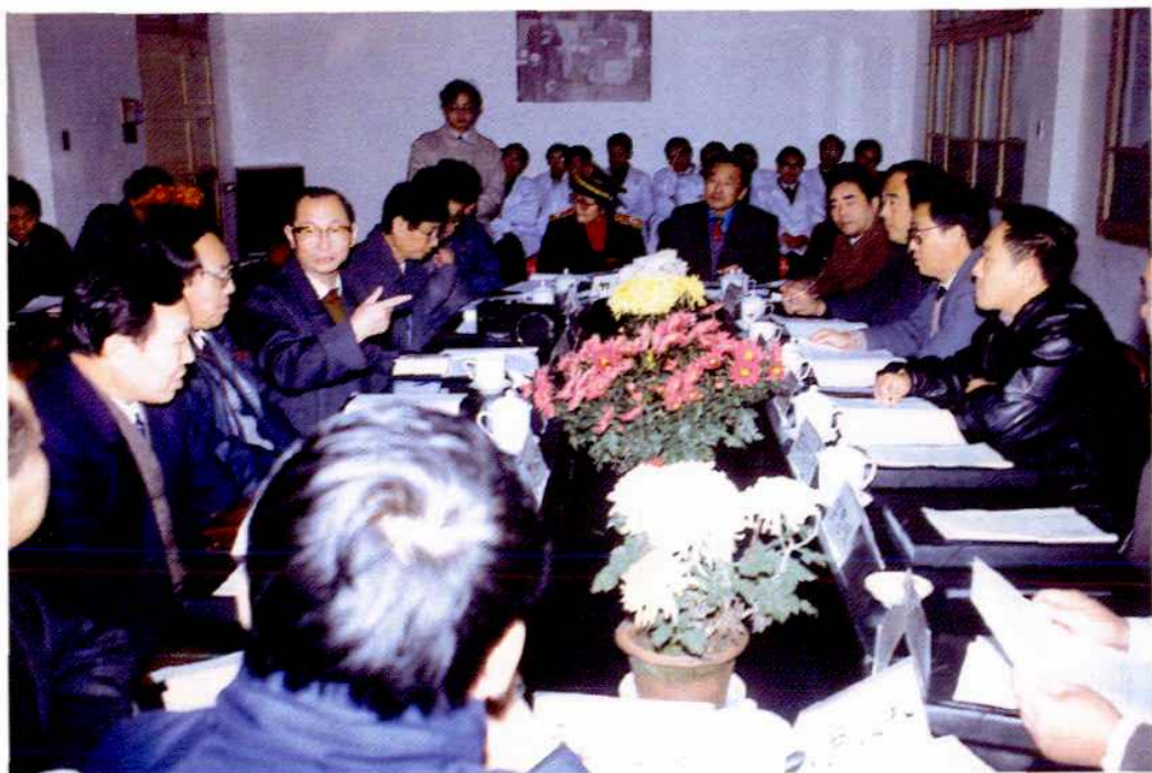
卫生部部长陈敏章一行对市卫生防疫站进行行风检查和视察指导工作(1993年)