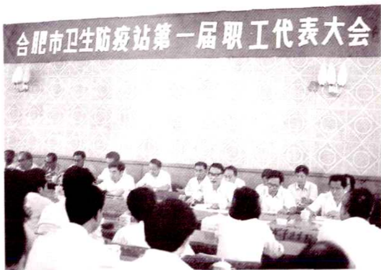
1985年6月，市卫生防疫 站第一届职工代表大会成立