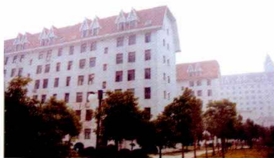
合肥市卫生防疫站南区分站