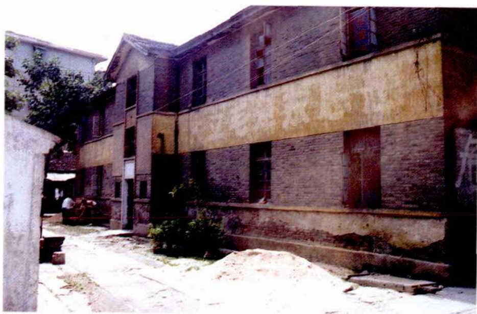
市卫生防疫站50年代初建筑物