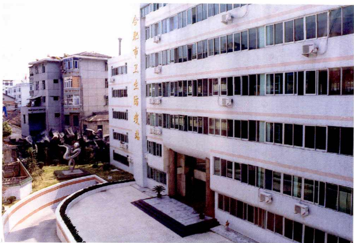
合肥市卫生防疫站主楼