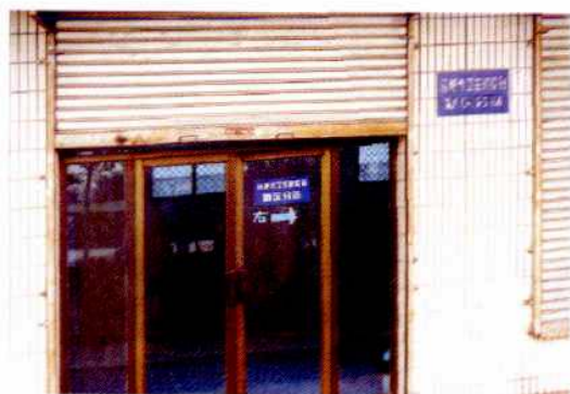
合肥市卫生防疫站西区分站