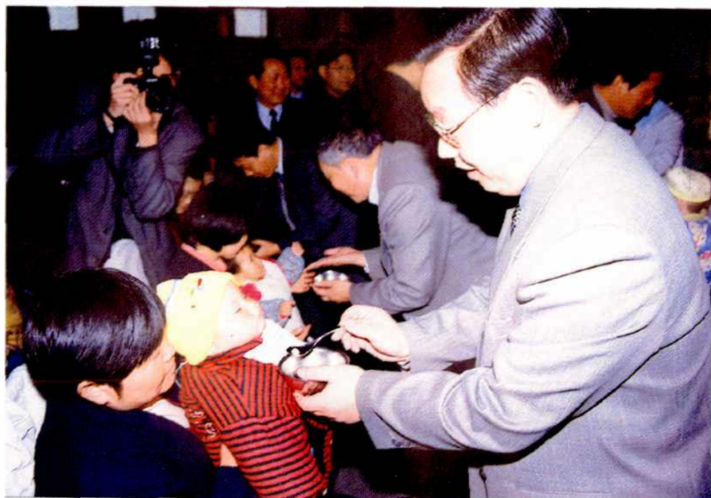
副省长蒋作君参加合肥市消灭脊灰强化免疫活动(1999年)