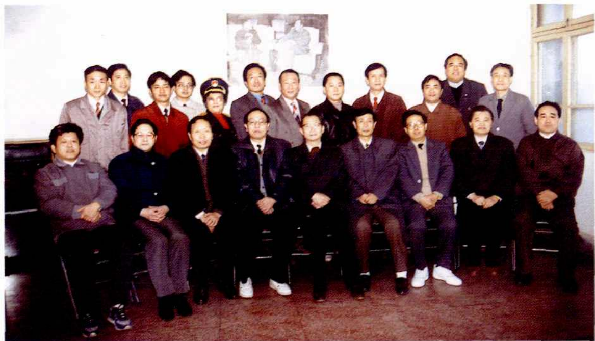
卫生部长陈敏章(前排中座)、副省长杜宜瑾(前排左四)、副市长厉德才(前排右三)、卫生厅长许占山(前排右四)、卫生局长刘军(后排右二)等领导与省市卫生防疫部门负责人合影(1993年)