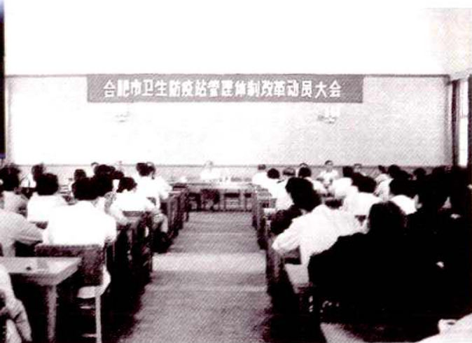
1985年6月，市卫生防疫站管理体制改革，实 行站长负责制