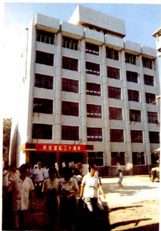
市卫生防疫站检验综合楼一期工程