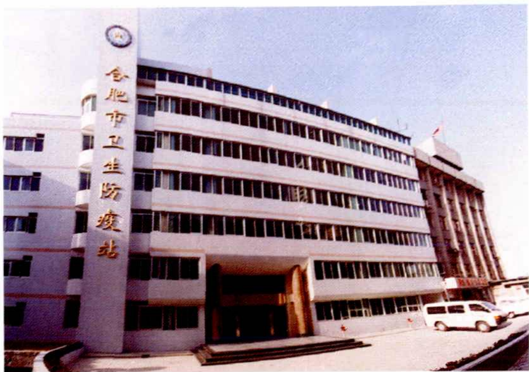
2000年1月竣工的市卫生防疫站检验综合楼二期工程