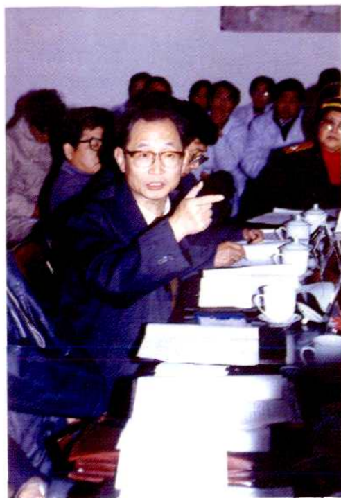
卫生部长陈敏章在市 站就卫生防疫工作改革发 展发表重要讲话(1993年)