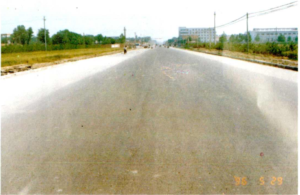
用财政资金扶持新修的建章路北段