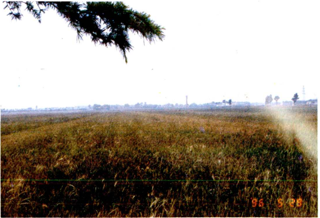
这是财政用农业发展基金投入建设的小麦万亩丰产方一角