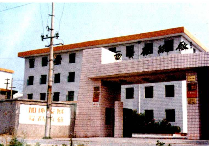
◀ 财政重点扶持的财源企业 谭家乡西安板纸厂外景