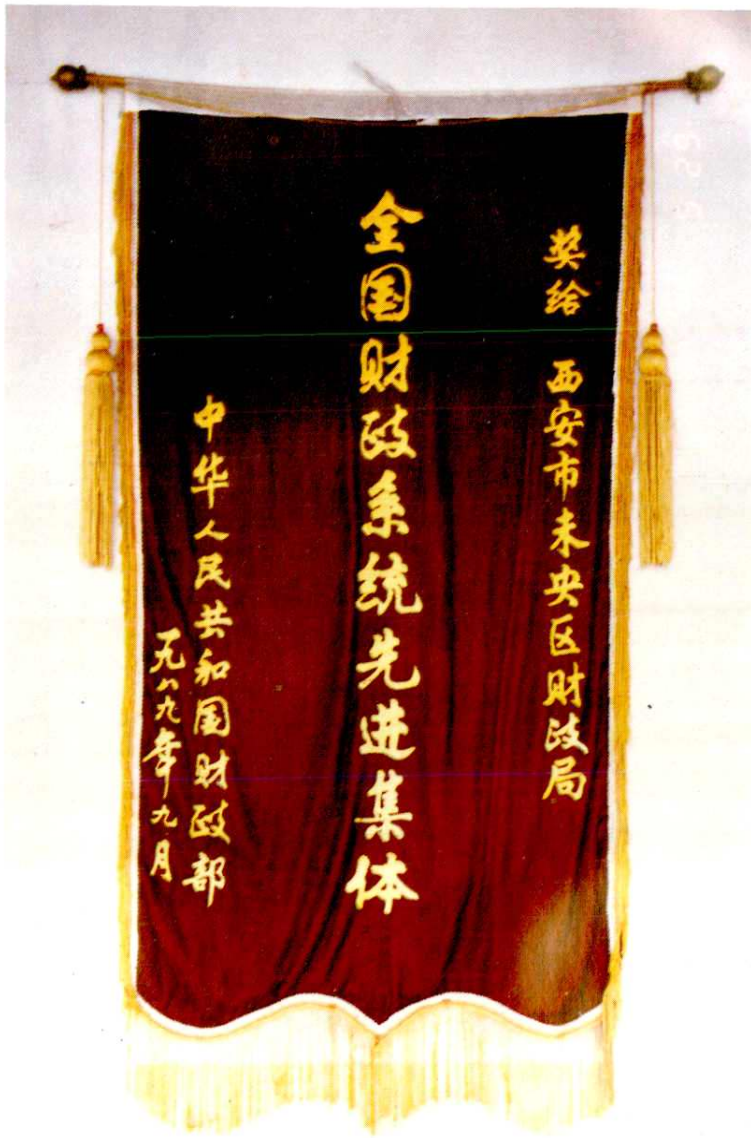
1989年未央区财政局荣获财政部全国财政系统先进集体锦旗