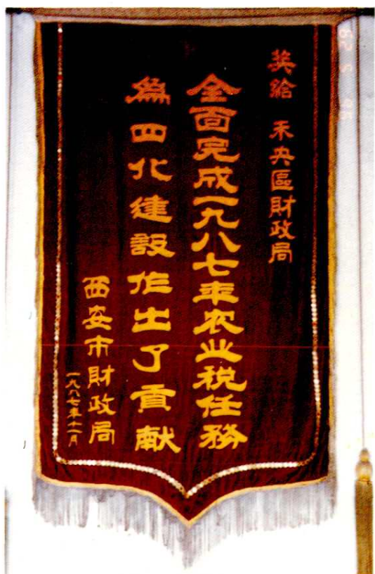
1987年未央区财政局全面完成农业税征收任务 荣获市财政局奖旗一面