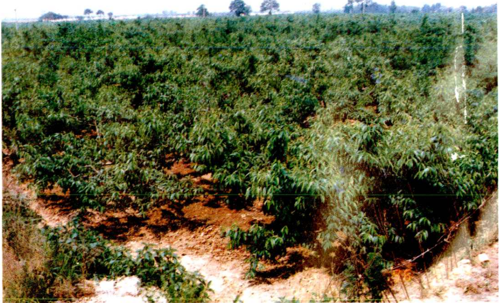
这是财政扶持发展的果林基地六村堡乡万亩桃园一角