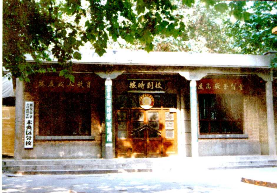
分校教室 西安中华会计函授学校未央区

未央区委、区政府把科教兴区当做大事来抓，每年拿出百余万财政资金用于文教卫生事业的基础建设，这是财政投资兴建的西安市第十六中学