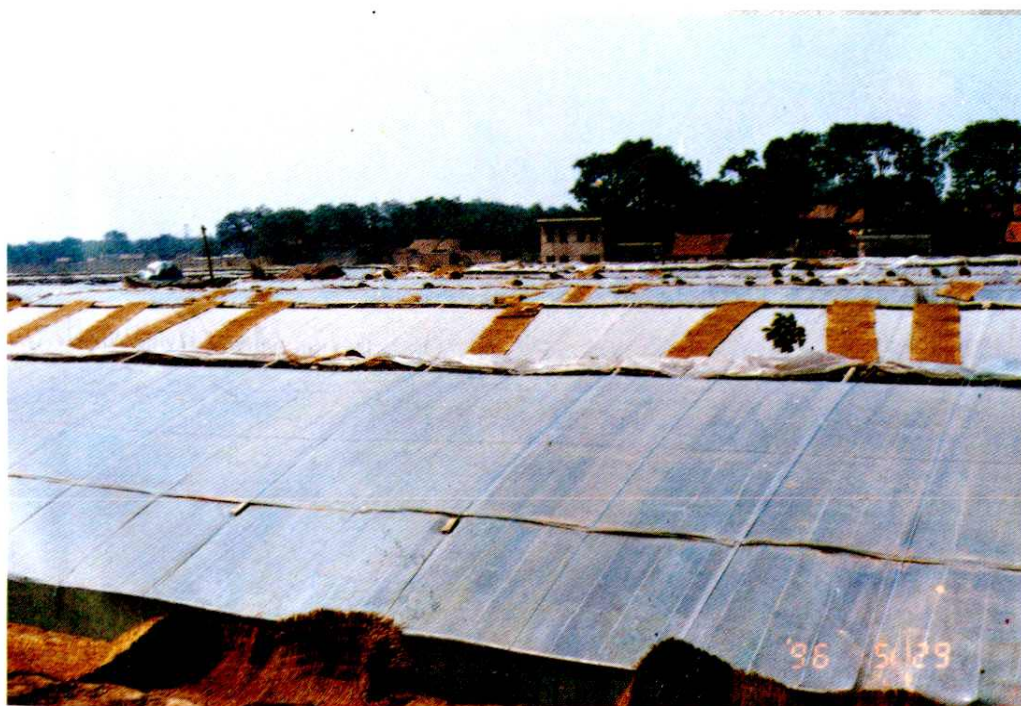
未央区财政部门积极扶持多种经营发展蔬菜生产，这是汉城乡高南村蔬菜温室大棚的一角