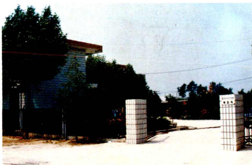
◀ 未央区草滩财政所