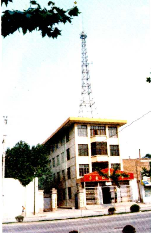
◀ 西安市未央区财政局及国债服务部办公大楼