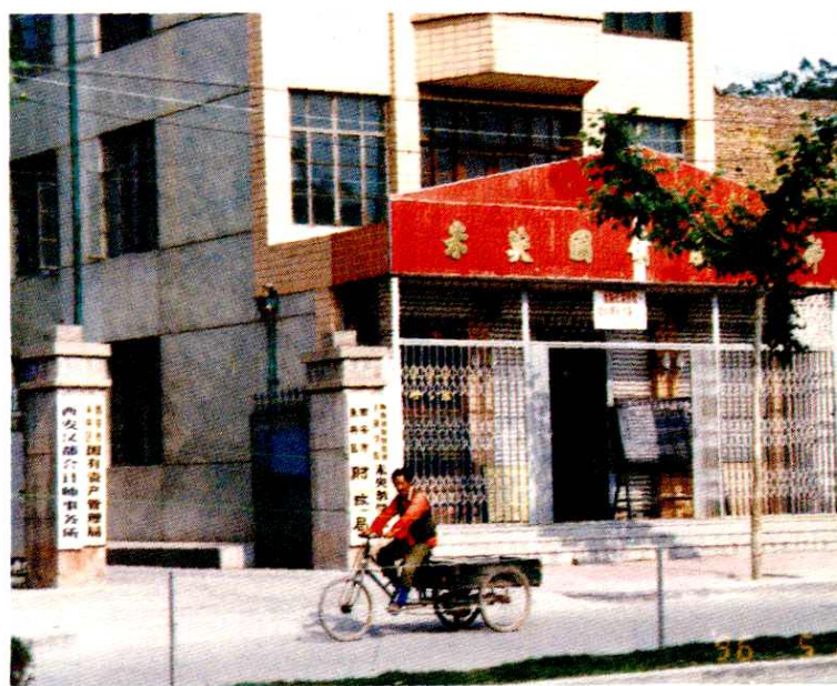
▶ 未央区国债服务部