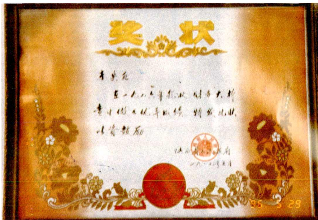
未央区财政局在1986年财务大检查中获得优异成绩,陕西省人民政府颁发奖状