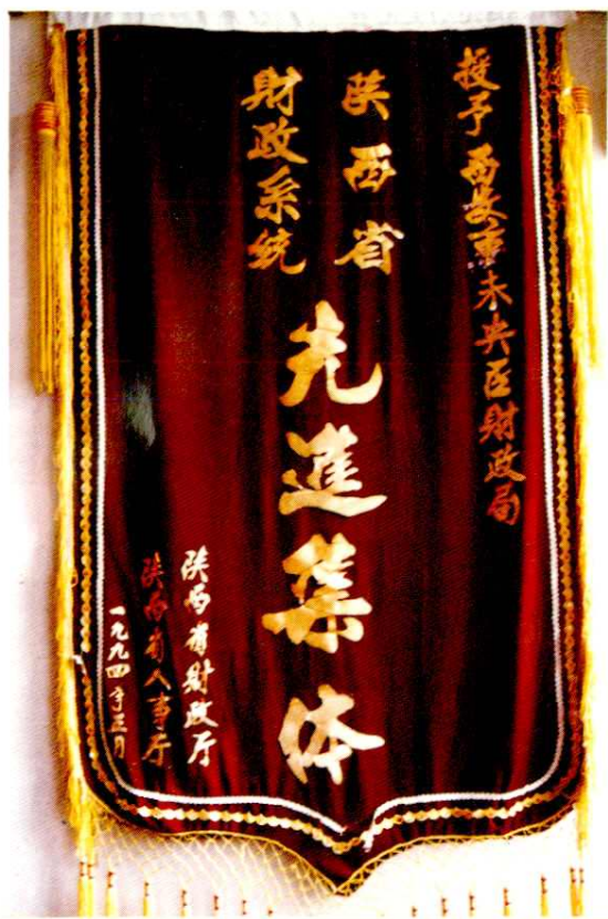
1994年未央区财政局荣获陕西省财政系统先进集体称号，省财政厅、人事厅颁发锦旗一面