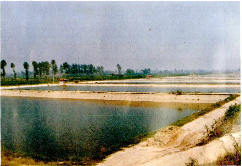
由财政担保向世界银行贷款新建的渔业生产基地草滩渔场千亩 渔池的一角