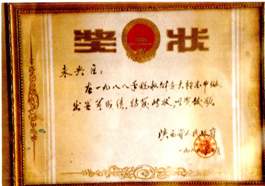
未央区财政局在1988年税收财务大检查中获得优异成绩,陕西省人民政府颁发奖状