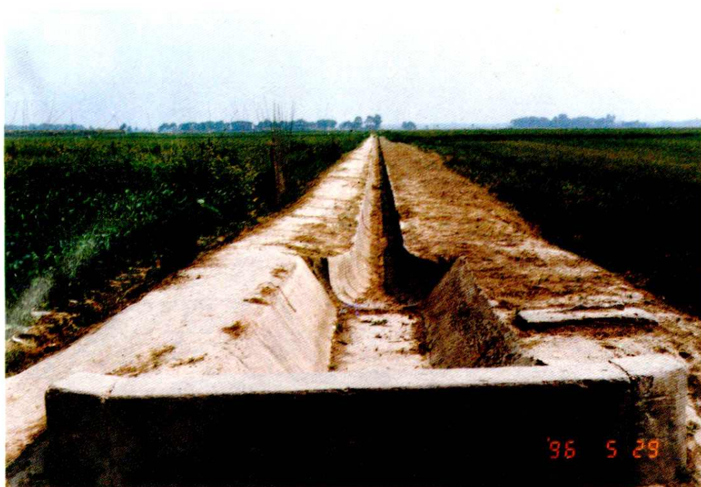
区委、区政府决定每年投入数百万财政资金用于农田水利基本建设，以改善农业生产条件，这是汉城乡高庙村修建的U型渠道的一部分