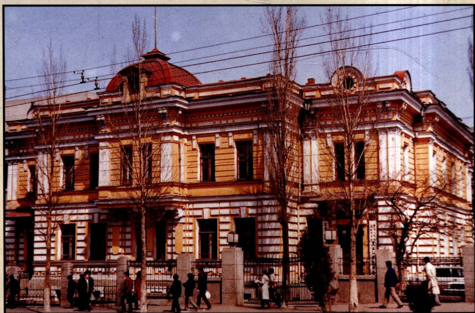
中国人民政治协 商会议黑龙江省委 员会办公楼