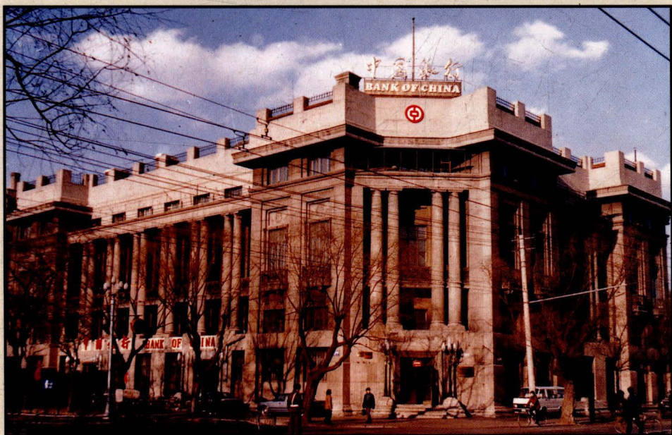
中国银行滨江分 行办公楼