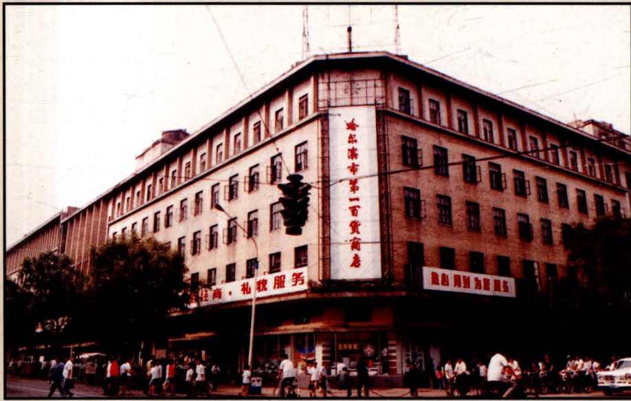
哈尔滨市第 一百货商店