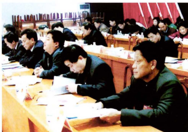
人大常委会副主任聂家鹄在县第十五届人民代表大会第四次会议上