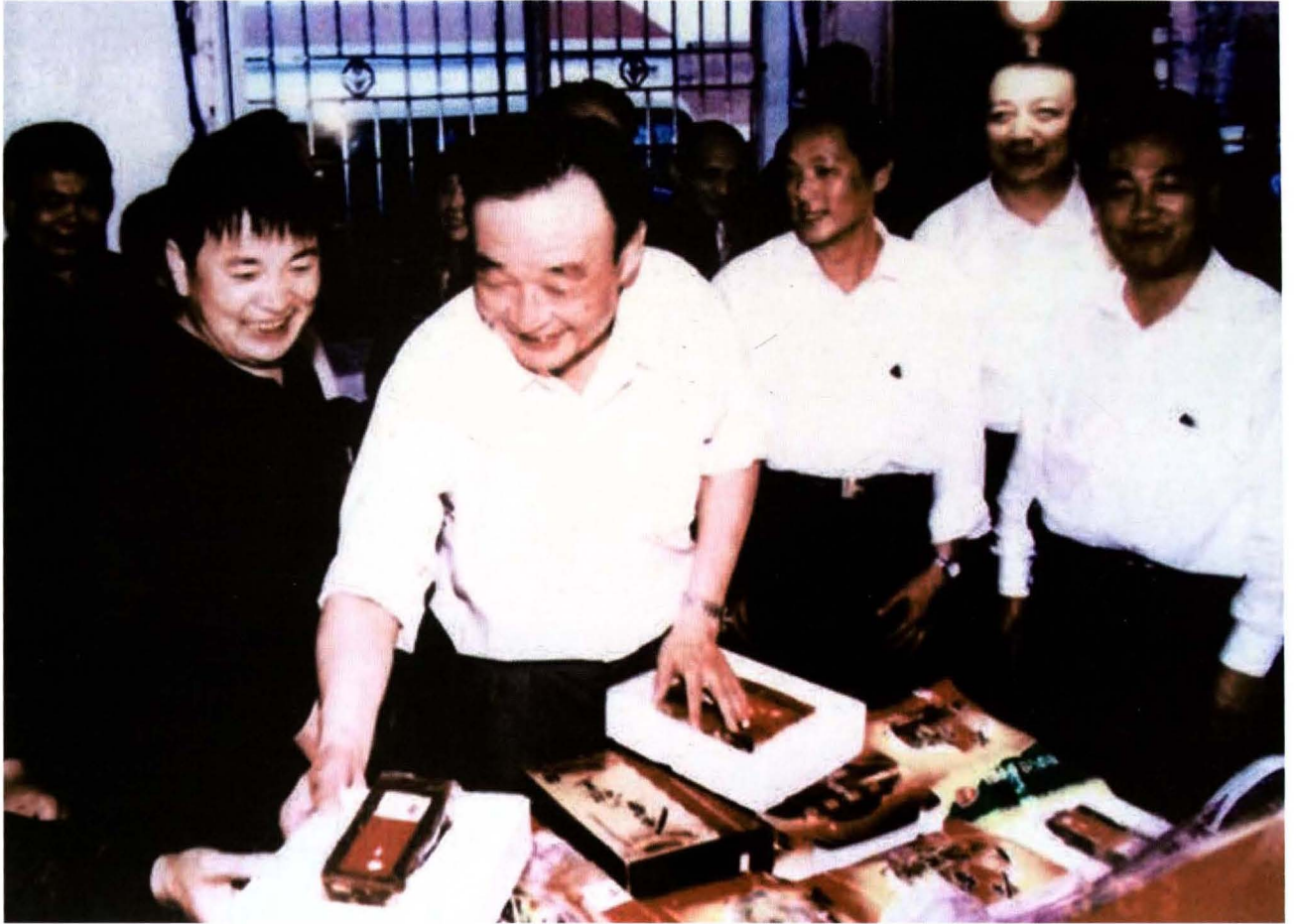
2003年5月16日，中共中央政治局常委、全国人大常委会委员长吴邦国来兴国视察工作。