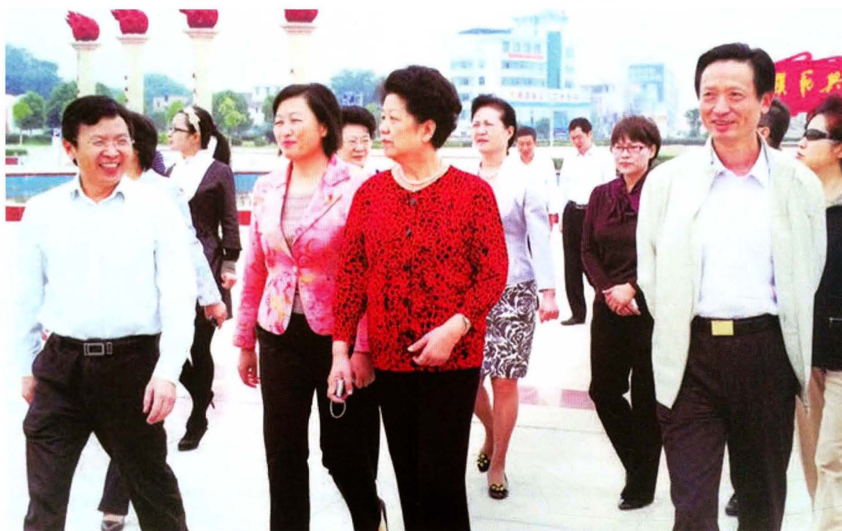
2011年9月23日，全国人大常委会副委员长、全国妇联主席陈至立来兴国考察妇女工作。