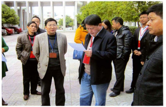
市人大常委会组织市、县人大代表视察中小学校安全工作“审议意见落实”情况