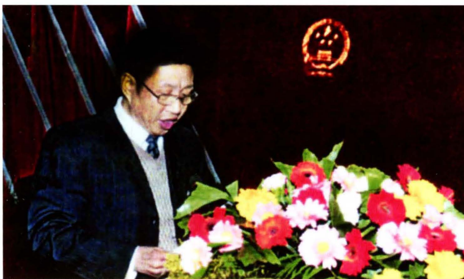
大主县人会议大 人副在届大会人 会青七表次县 委黄十代三作 常任第民第上 常报