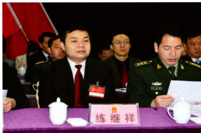
县人大常委会副主任练继祥在县第十七届人民代表大会第四次会议上