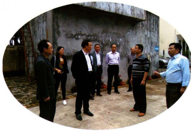
县人大常委会调研农村饮水安全工程 建设管理情况