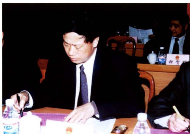
人大常委会副主任朱挺扬在县第十五届人民代表大会第一次会议上