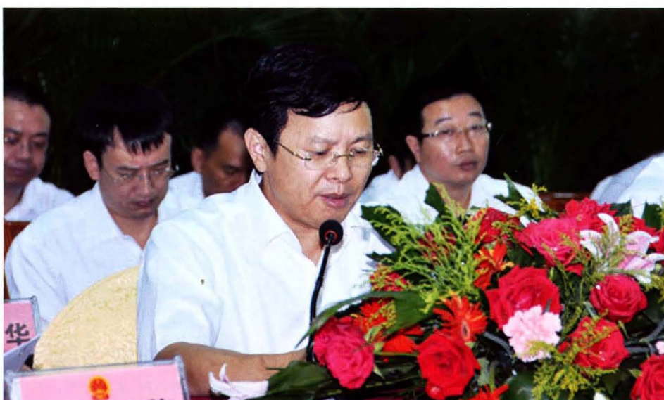
兴书大任县人会议 共委人主在届大会 中县委会进七表次 国记、委恭十代二第 国记常李第民第 上讲话