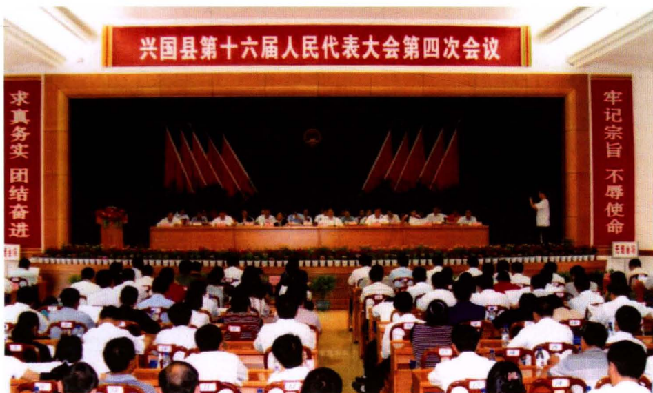
第十代 第四 届人民 大会第 六表次 会议会 场