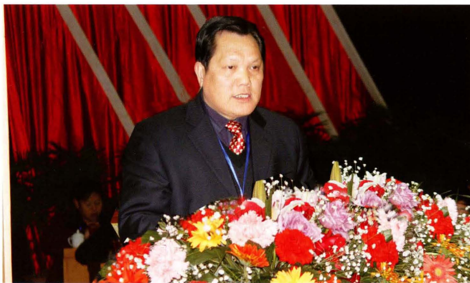
大任县人会议大作 人主在届大会人工 县会亿六表次县会 委能十代一作委告 常吴第民第上常报