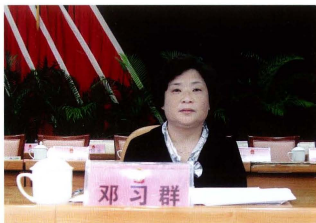
人大常委会副主任邓习群在县第十六届人民代表大会第四次会议上