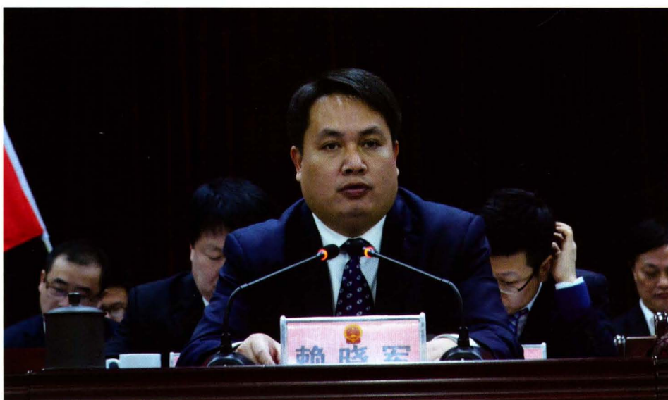
兴记县人会议 共书在届大会 中委军七表次 县晓十代六 国赖第民第 上讲话