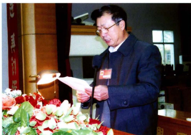
人大常委会副主任钟贤海在县第十五届人民代表大会第四次会议上