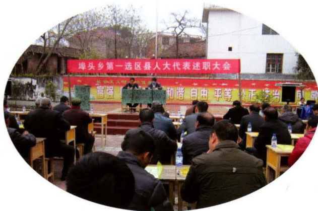
县第十七届人大代表埤头乡第一选区代表述职大会