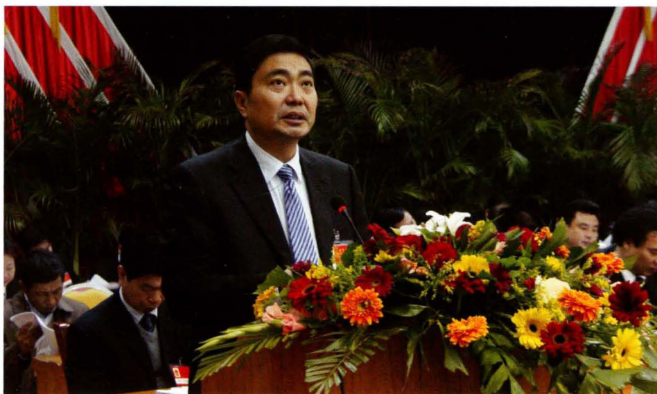
邱第民第上作 长县人会议工 县在届大会府 祥六表次政 英十代五作报