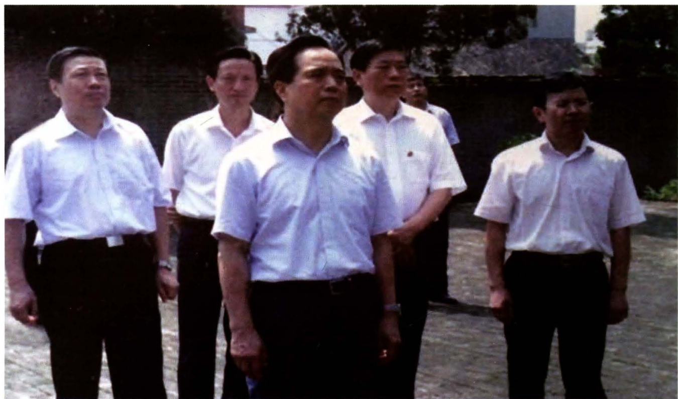
2011年9月2日，全国人大常委会副委员长兼秘书长李建国来兴国调研法院、检察院基层建设工作。