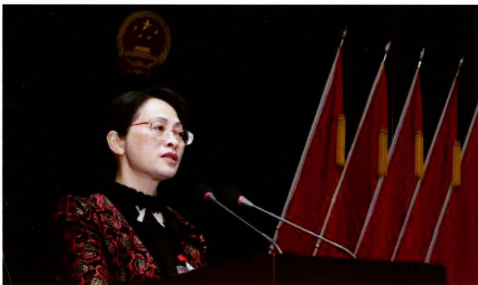
陈十代六作报 长第民第上作 县人会议工 在届大会府 黎七表次政 告