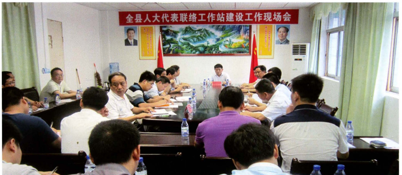
全县人大代表联络工作站建设工作现场会