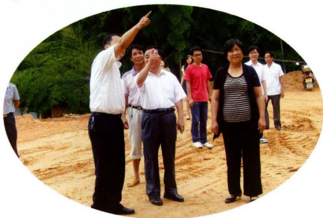
县人大常委会调研民生工程建设