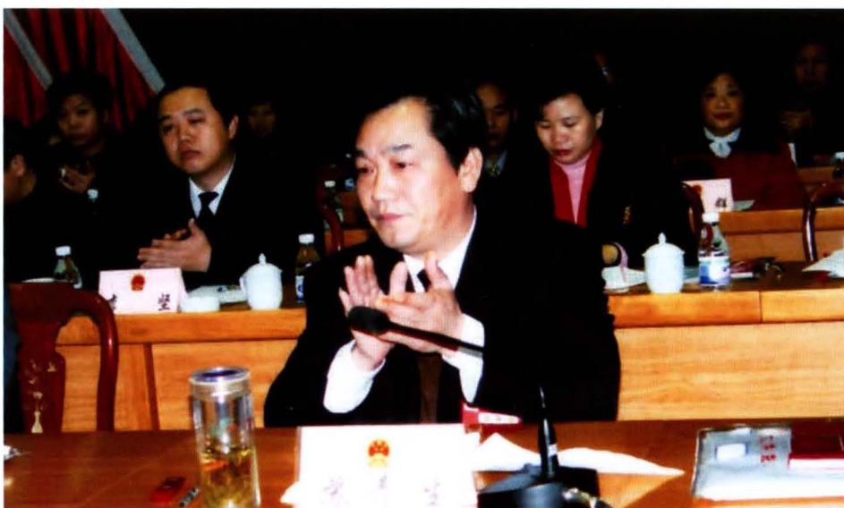
兴记县人会议 共书在届大会 中委生五表次 县青十代四第 国苏第民第 上讲话