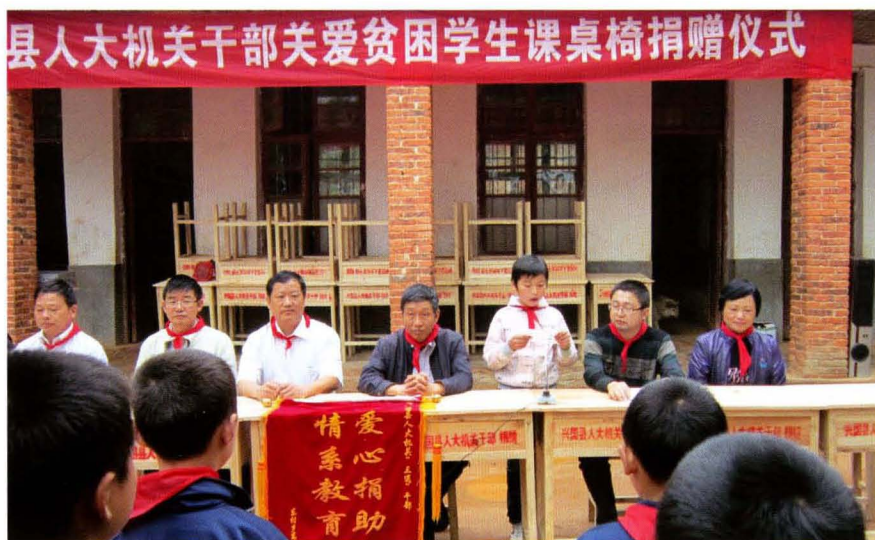
县人大常委会机关干部关爱贫困学生 向东村乡东坪小学捐赠课桌椅