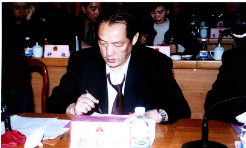
兴记县人会议 共书在届大会 中委明五表次 县联十代一第 国赖第民第 上讲话