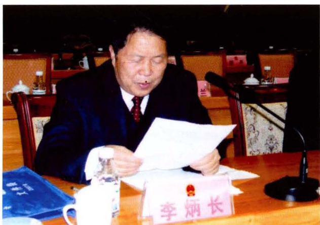
人大常委会副主任李炳长在县第十六届人民代表大会第一次会议上