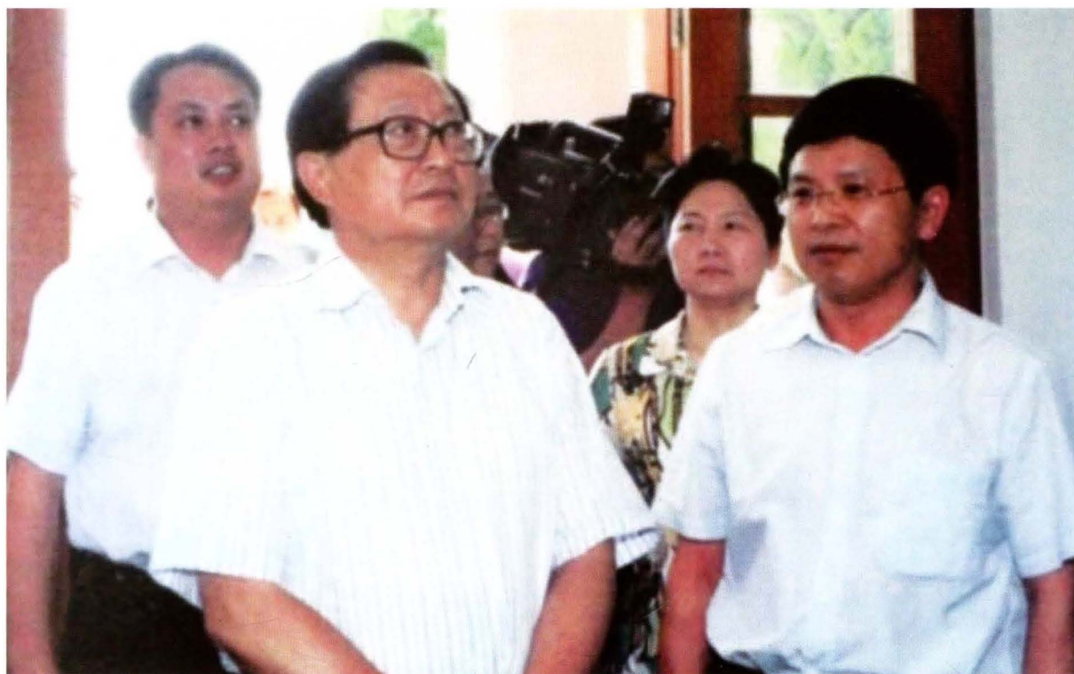
2011年6月8日至9日，全国人大常委会副委员长、中国红十字会会长华建敏来兴国参加“红十字老区行”系列活动。