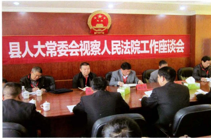
市人大常委会视察县人民法院工作座谈会