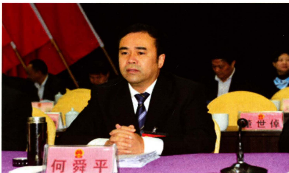
兴记县人会议 共书在届大会 中委平七表次 县舜十代四 国何第民第 上讲话