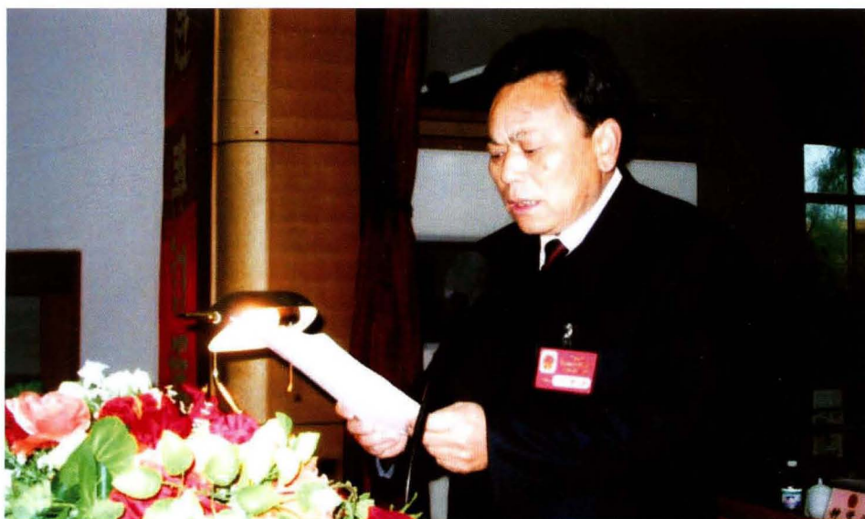
大任县人会议大作 人主在届大会人工 县会燕五表次县会 委鹏十代一作委告 常谢第民第上常报