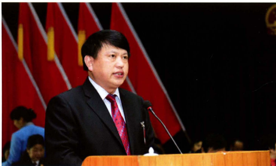
大任县人会议大作 人主在届大会人工 县会俊七表次县会 委文十代四作委告 常陈第民第上常报