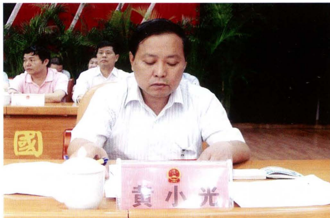
县人大常委会副主任黄小光在县第十六届人民代表大会第四次会议上