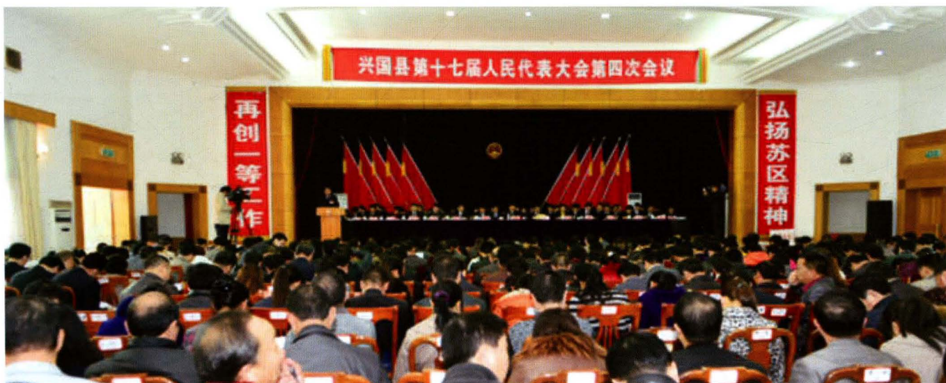
县第十七届人民代表大会第四次会议会场