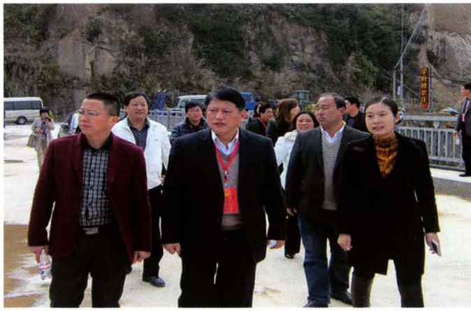
市人大常委会组织驻县的市人大代表视察民生工程