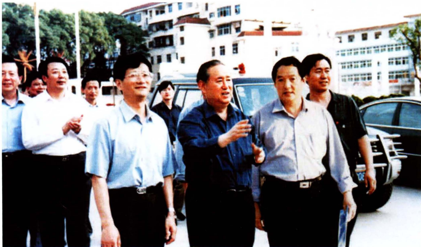
2002年5月25日，中共中央政治局委员、全国人大常委会副委员长姜春云来兴国视察工作。