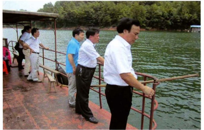
市人大常委会视察长冈水库水资源保护情况