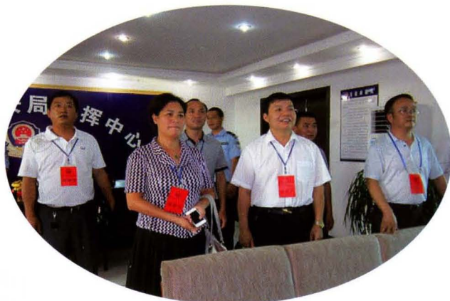
县人大常委会组织县人大代表视察“天网”工程建设