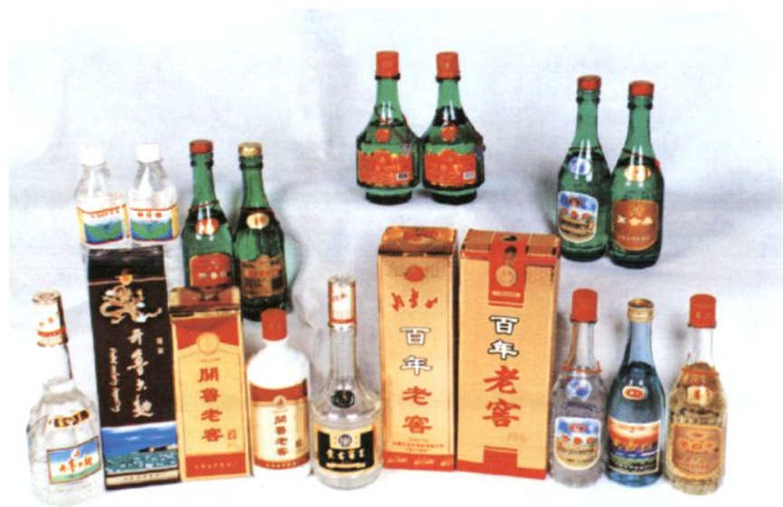
◀ 开鲁酒厂优质产品