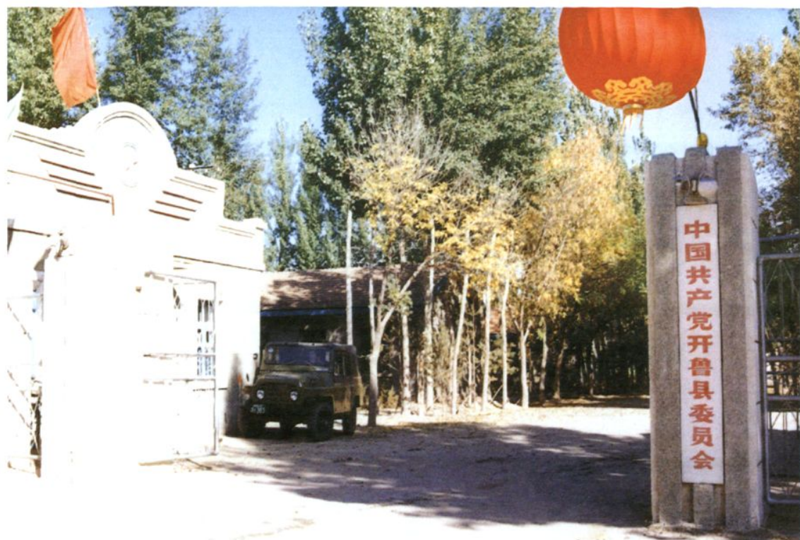
▲ 中国共产党开鲁县委员会