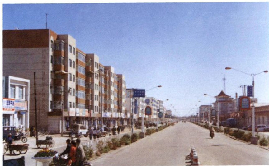
◀ 新开大街楼房林立