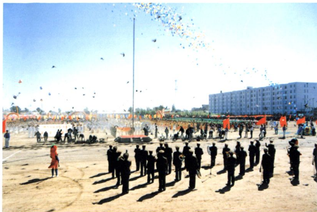
▲ 中国·开鲁第二届红干椒节