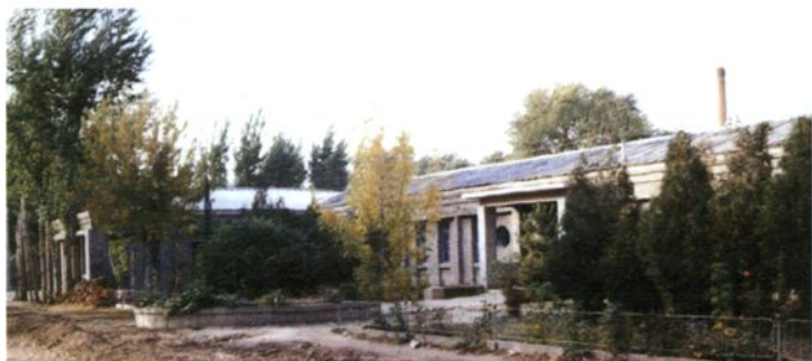
▶ 开鲁县人民政府旧址