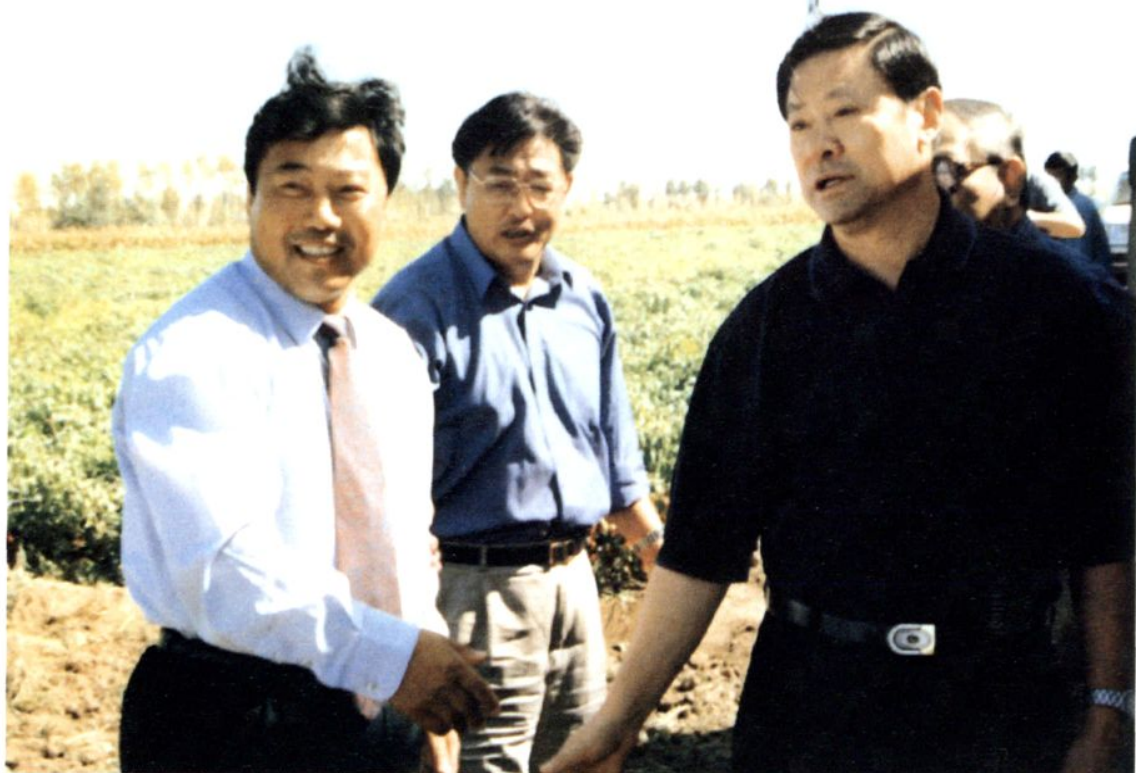
▲ 中共内蒙古自治区党委书记储波（右一）到开鲁县视察工作 中共开鲁县委书记高琦（左一）陪同工作