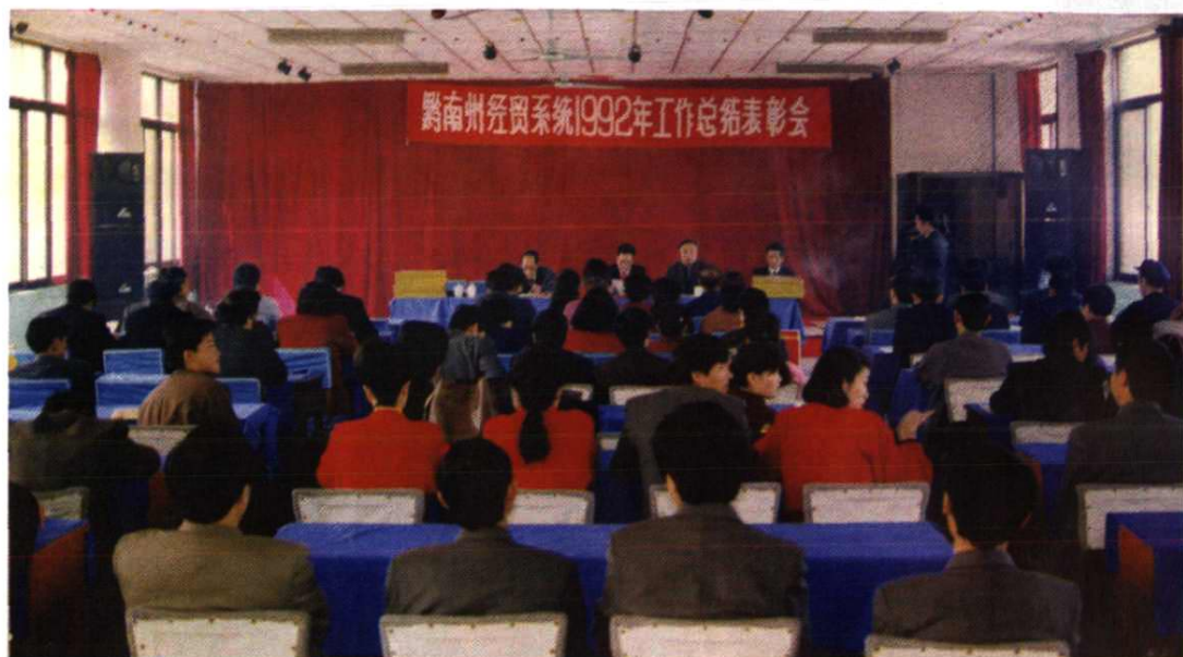
1992年州外贸系统表彰会