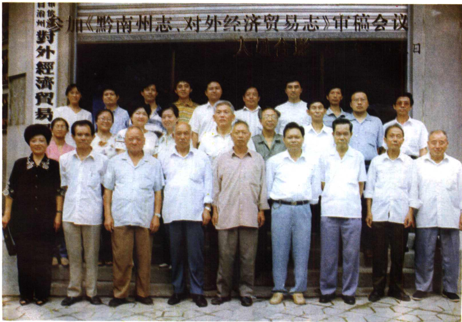
1996年9月《黔南州志·对外经济贸易志》审稿会议人员合影。