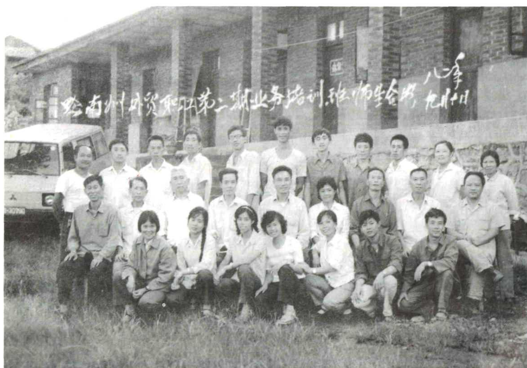
1982年州外贸系统业务培训班