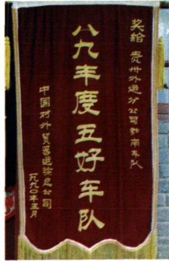
州外贸系统先进企业奖旗