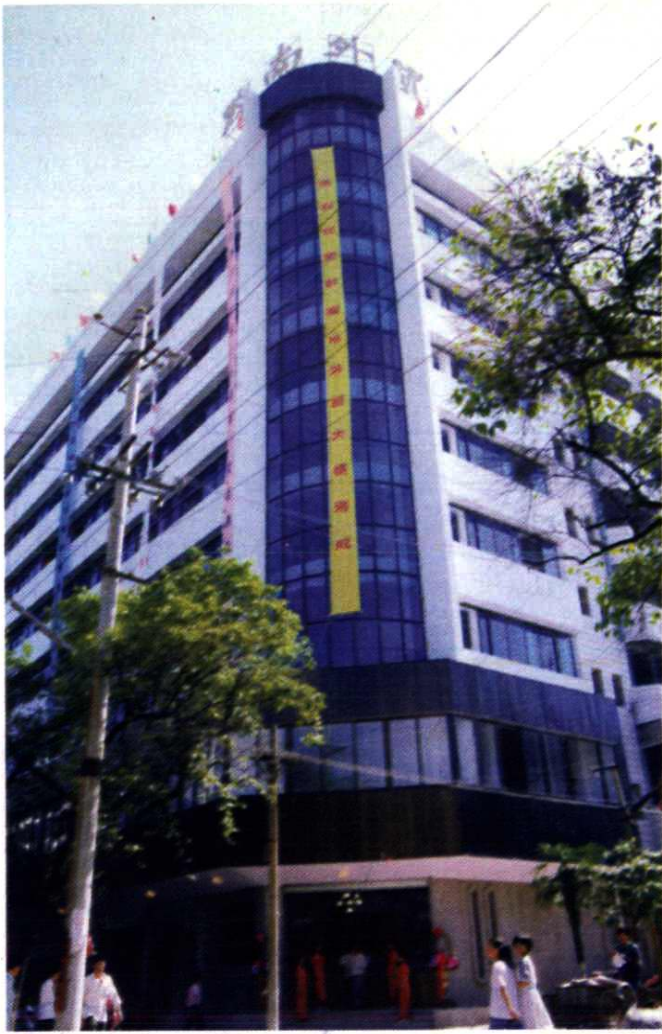
黔南州对外经济贸易综合大楼