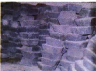
远销海外的独山县精锑