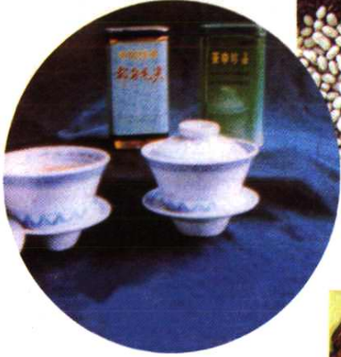
全国十大名茶之一的“都匀毛尖”。