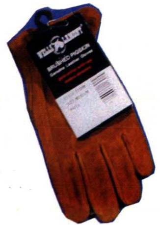
优质猪正绒司机手套