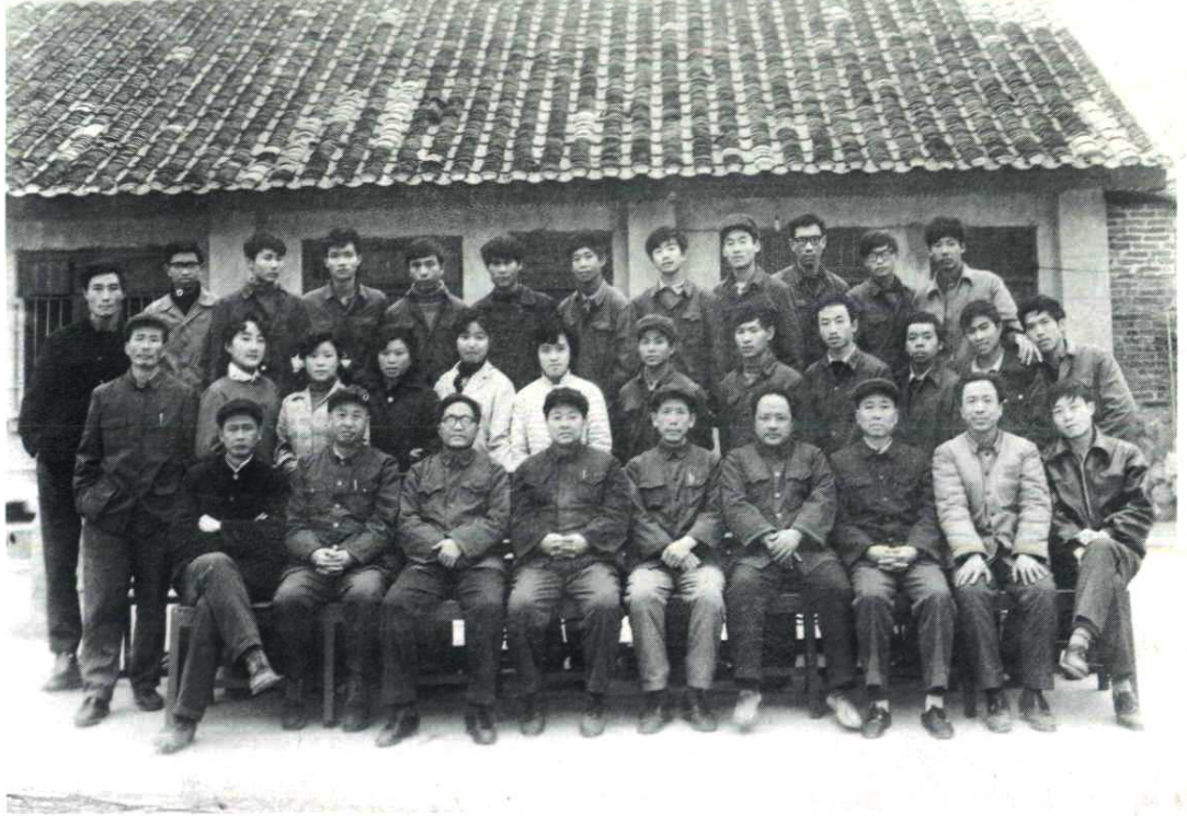
1981年州外贸系统业务培训班