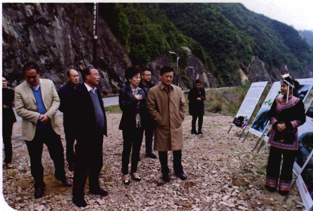
2015年4月8日，省水利厅厅长陈川莅景调研“畚乡绿道”建设情况