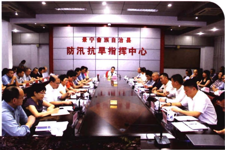
2015年7月9日， 县领导部署防“灿鸿” 台风会议