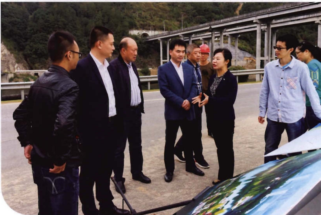
2016年11月22日，县委副书记、代县长钟海燕调研鹤溪河治理工程