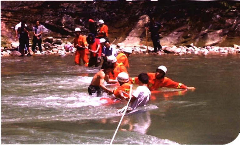
2009年8月15日， 炉西峡大搜救