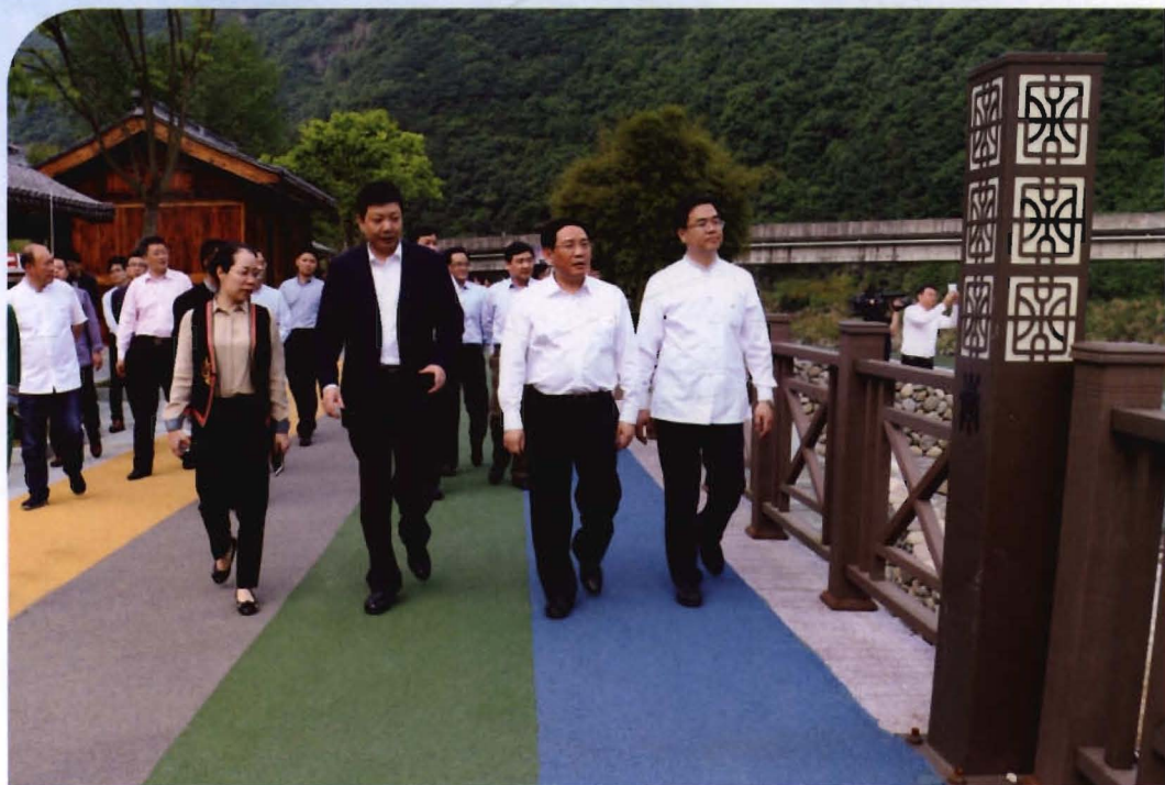
2016年4月28日，省长李强（右二）视察“畚乡绿道”