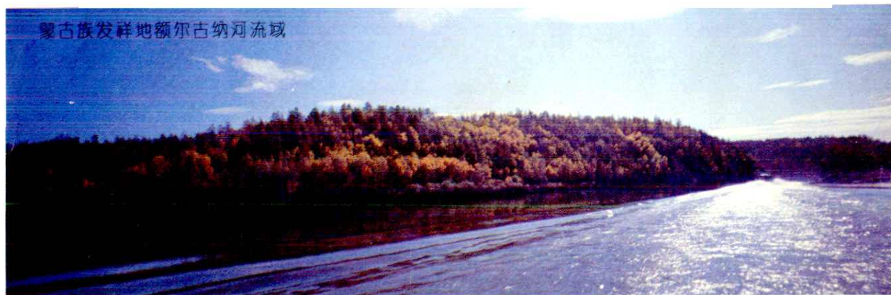
蒙古族发祥地额尔古纳河流域