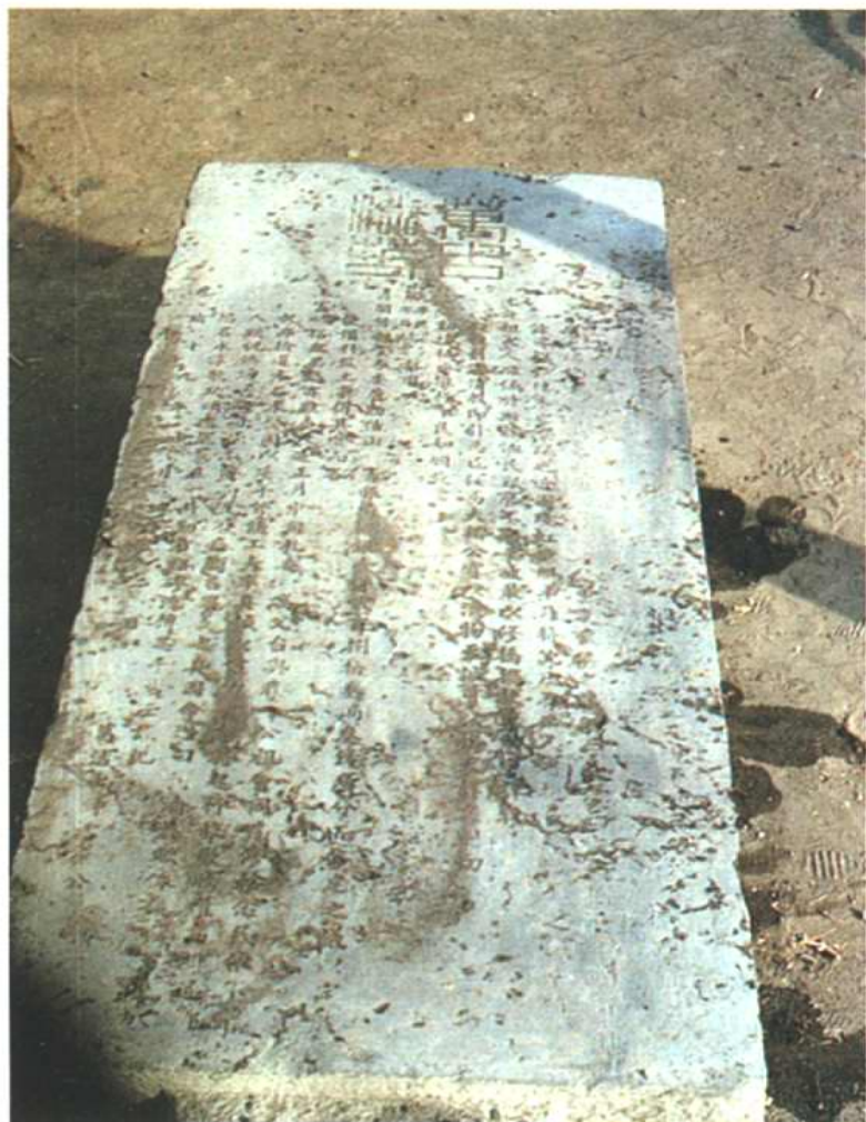
古西大桥桥头石碑