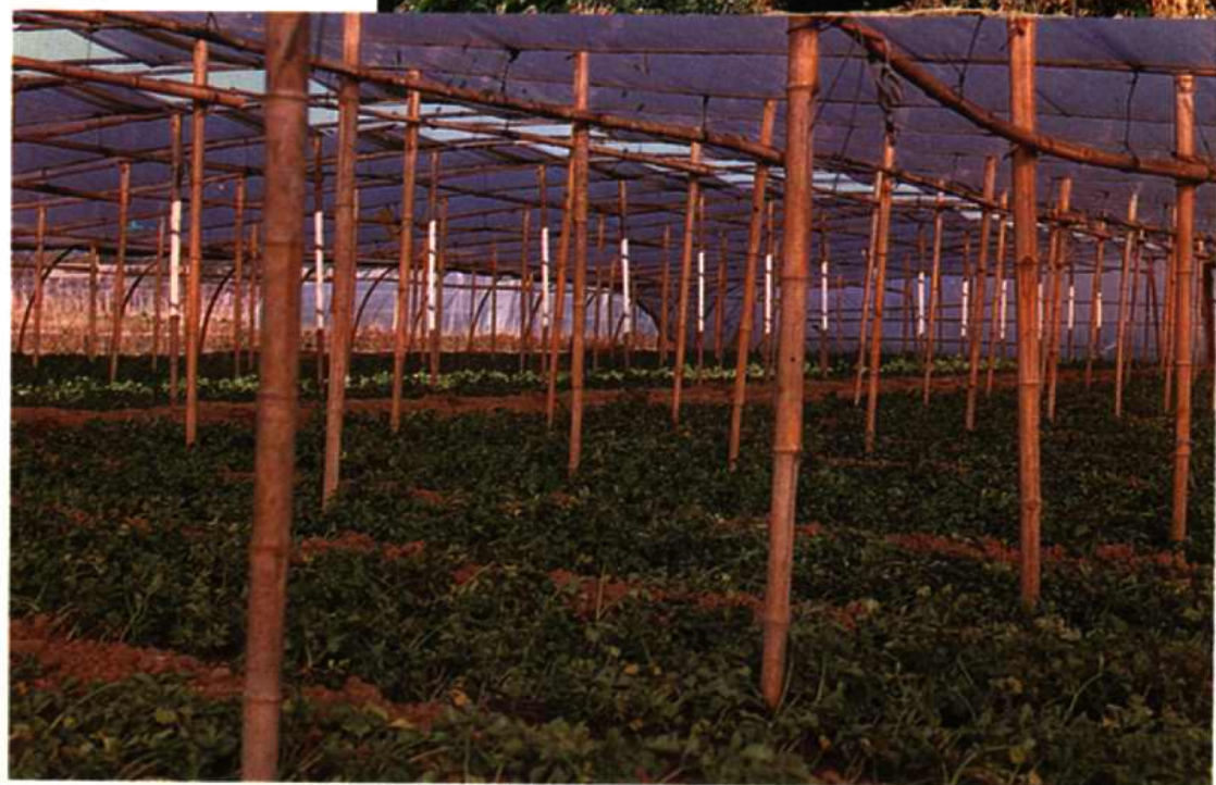
塑料膜大棚种植蔬菜