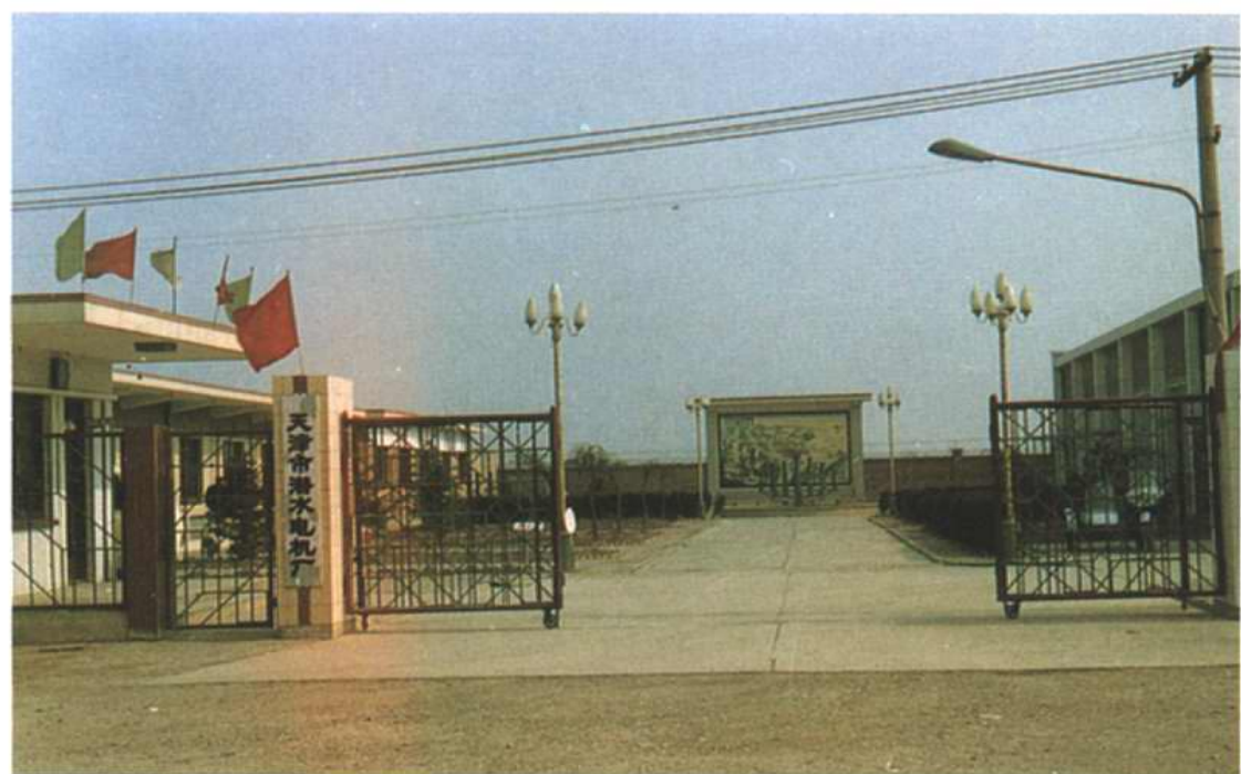
村办企业——天津市潜水电机厂