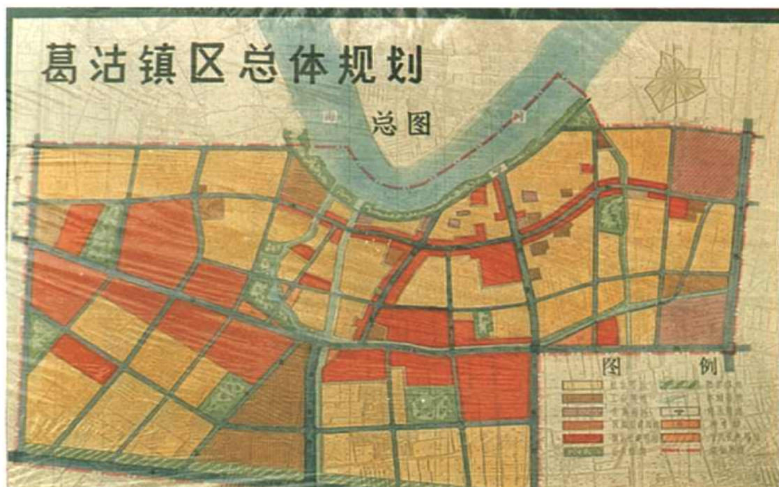
葛沽镇区总体规划总图，定于一九九〇年