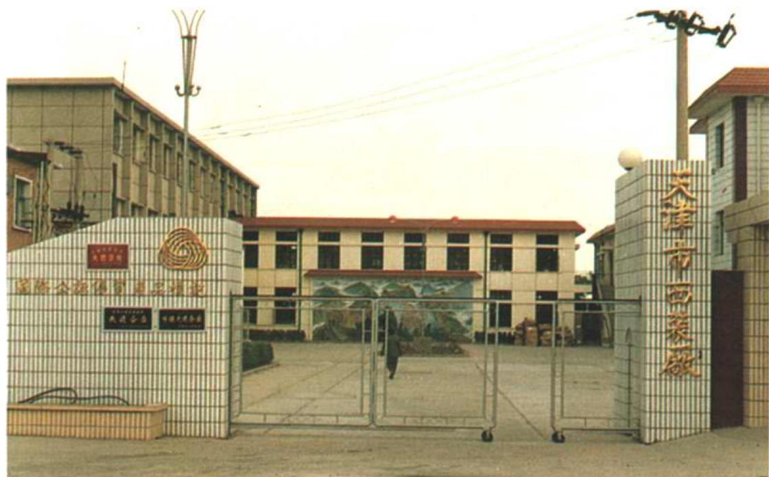
“服装镇”的龙头企业——天津市西装厂