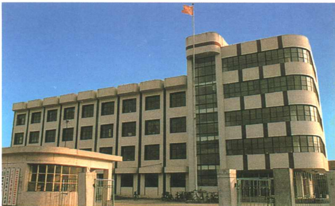
葛沽镇政府办公大楼 建于一九八九年。