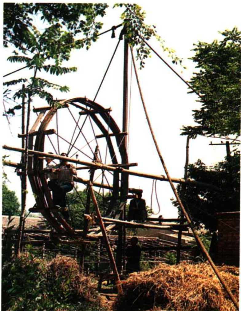
六十年代土法打深水井