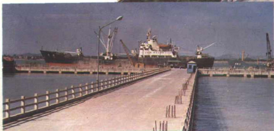
泉州后渚港 5000 噸級糧食專用碼頭