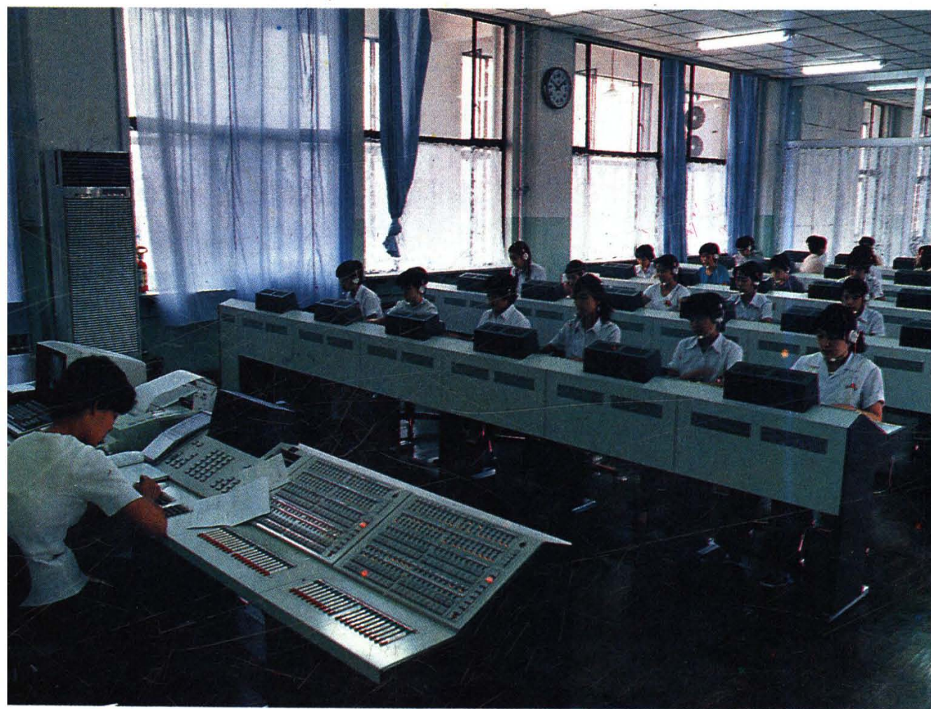
一千线程控长途电话交换机