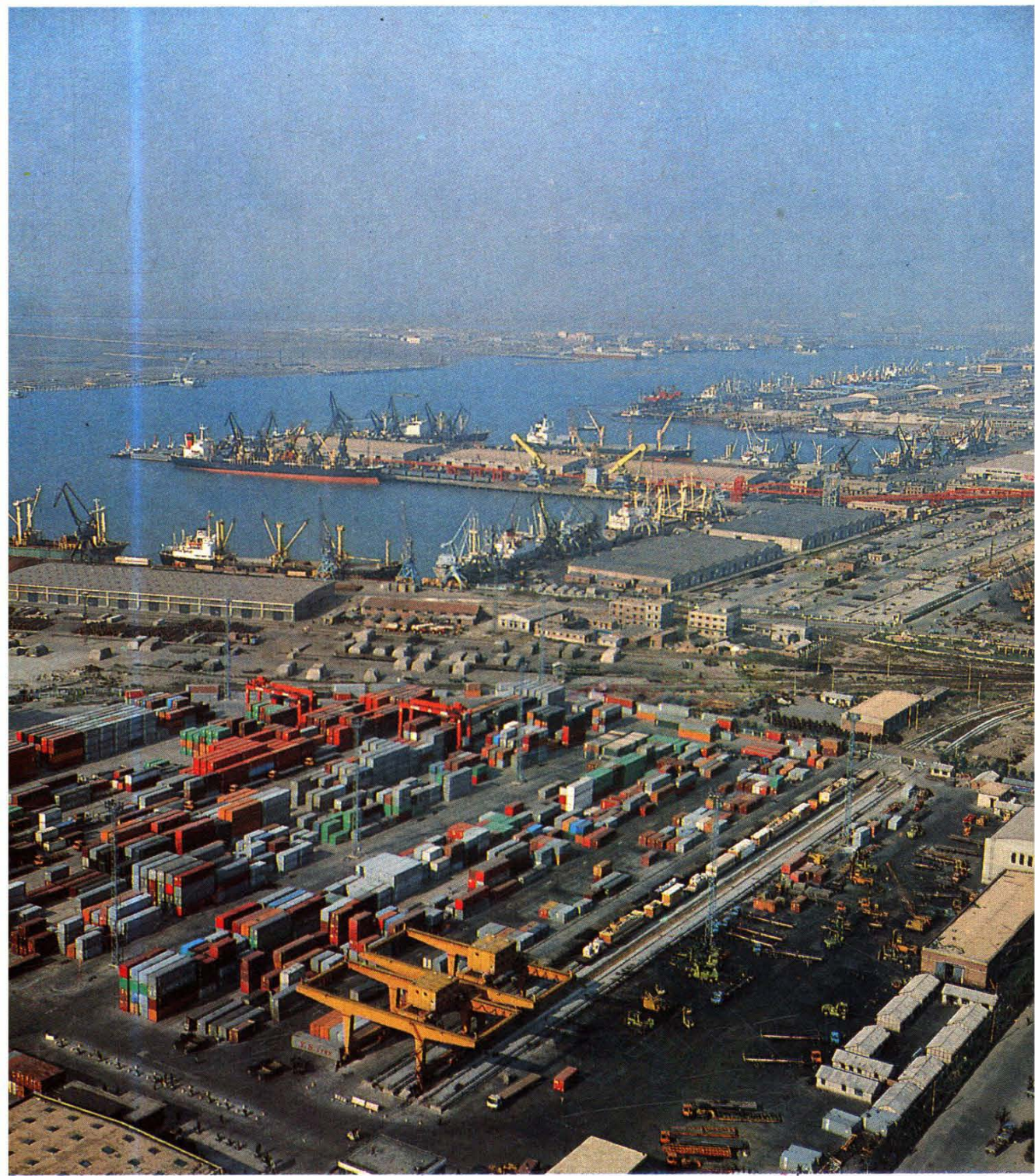
津新港集装箱码头