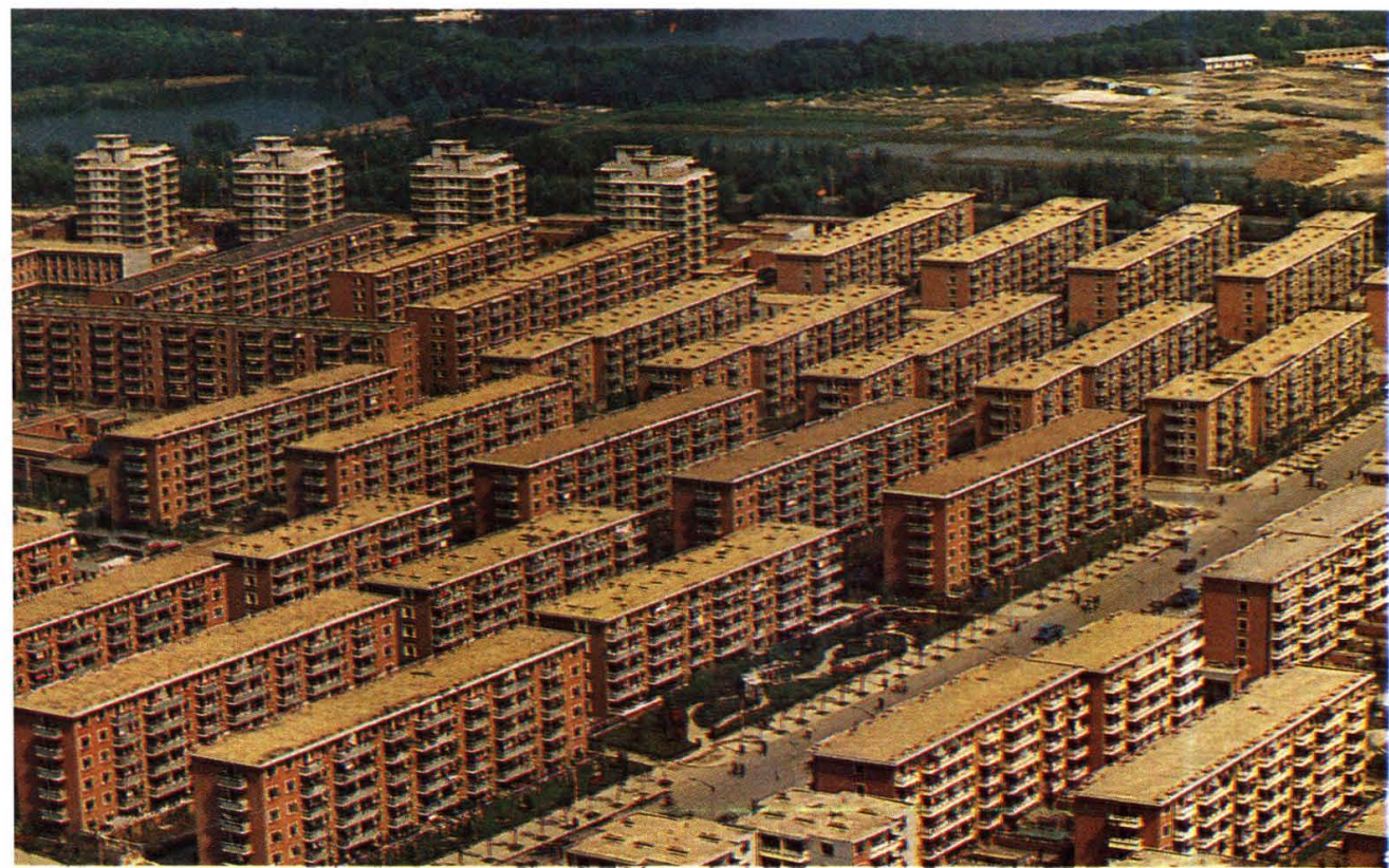
体院北居民住宅区