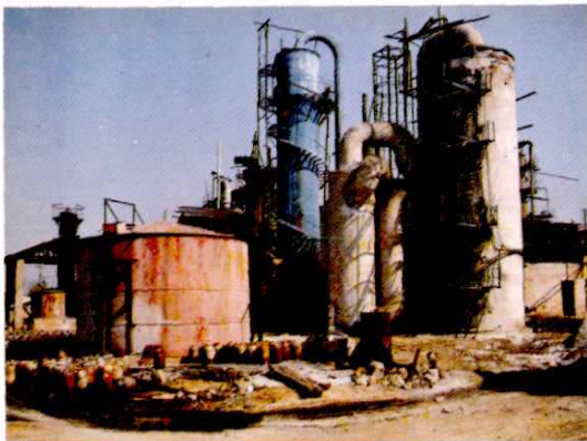
硫酸车间沸腾炉外景