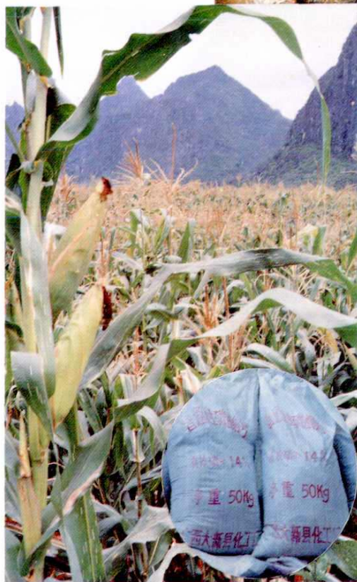
大新县种的玉米普遍施用普钙化肥