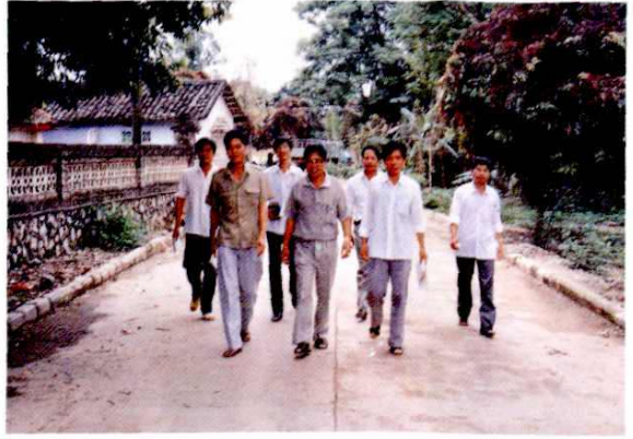
领导班子走出办公室深入车间检查生产