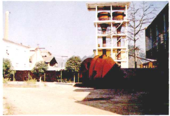
电解二氧化锰洗涤塔