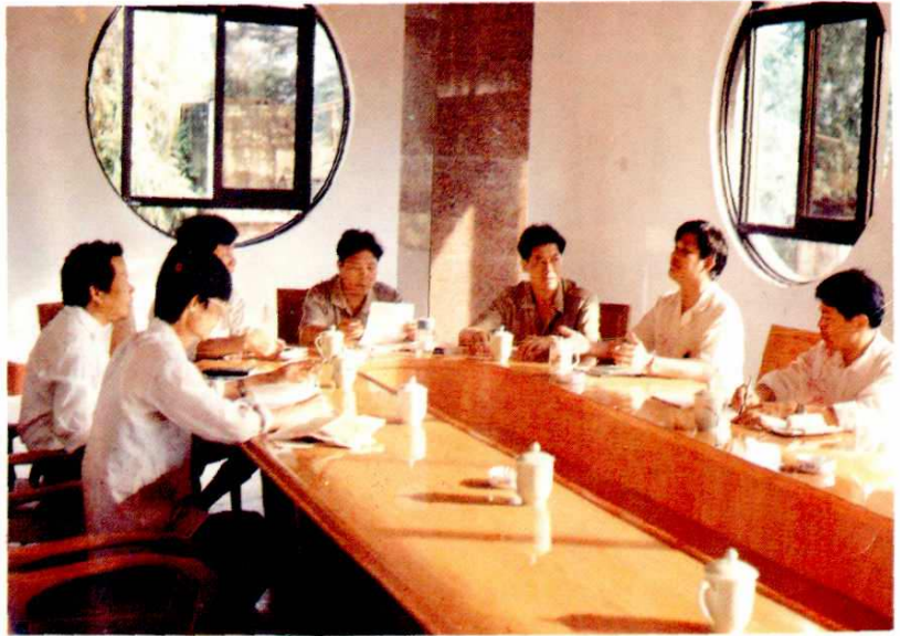
工厂领导班子在研究工作