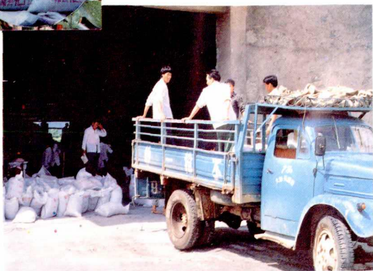
装车外运的普钙化肥