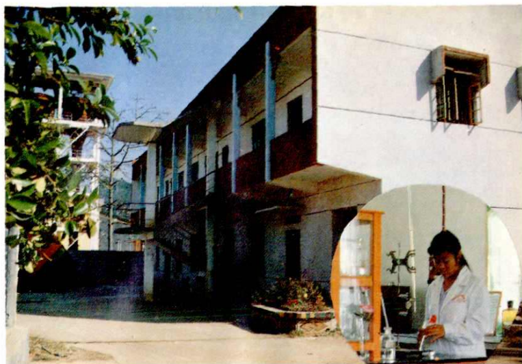
钛白粉车间化验楼