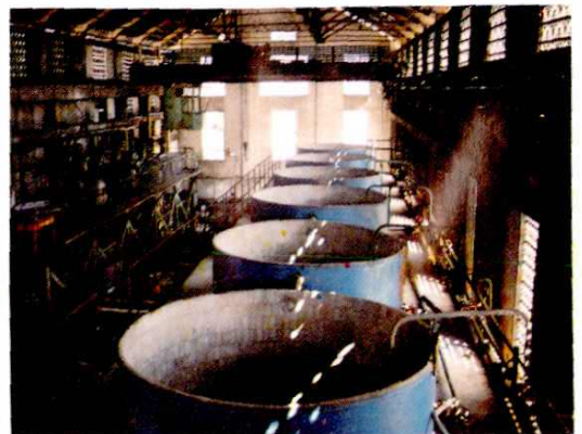
钛白车间水洗工段一角