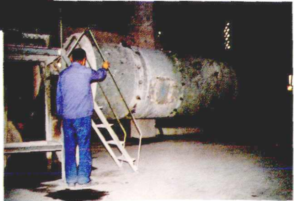
普钙车间粉碓工段