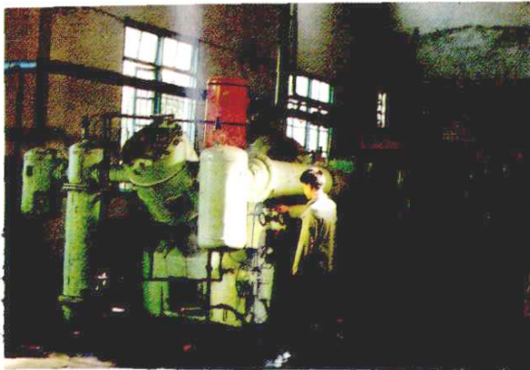
钛白车间机房工段的空压机