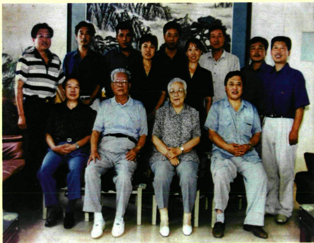
2000年7月，全国人大副委员长李锡铭（前排左二） 到康庄镇小丰营村视察工作。