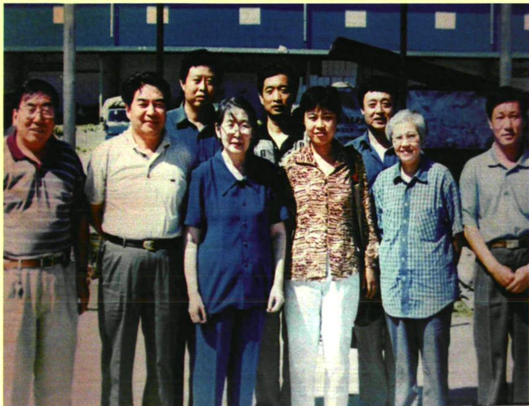
2000年8月，毛泽东的女儿李敏（前排左三） 到康庄镇八达岭蔬菜市场视察参观