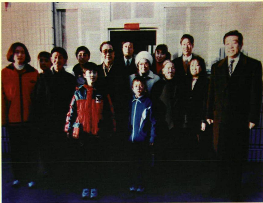
1998年2月16日李鹏总理（左六）、贾庆林市长（右一） 和康庄镇小丰营村村干部赵玉忠全家合影留念