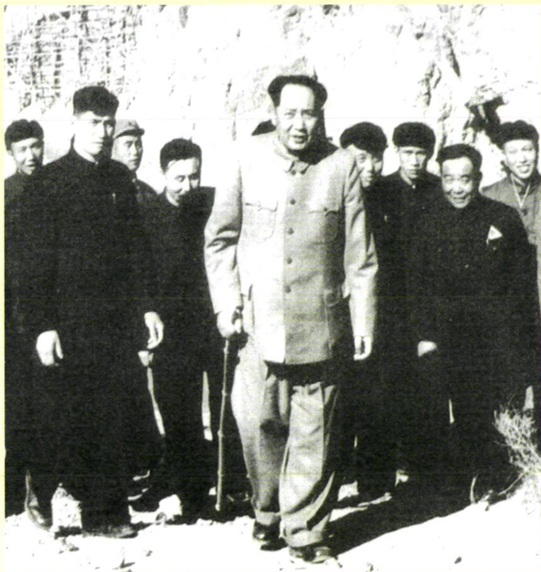
1954年4月12日，毛泽东主席（前中）视察官厅水库