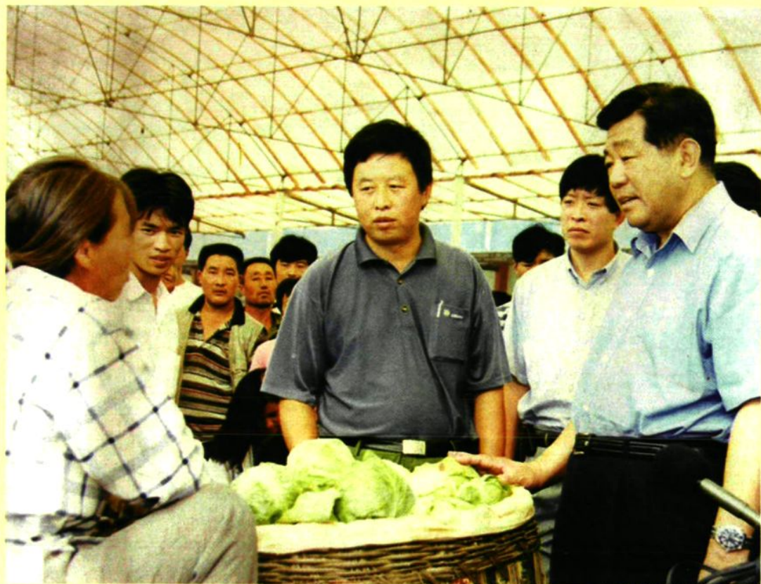
1999年8月，北京市市委书记贾庆林（右一）到康庄镇八达岭蔬菜市场视察工作