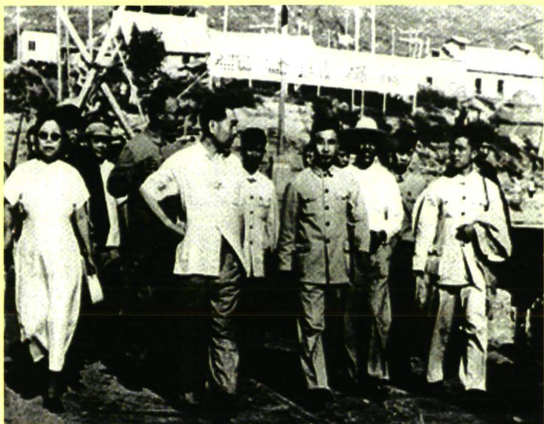
1955年8月22日，周恩来总理（前排左二）视察官厅水库