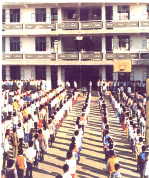
吕巷中心小学学生早操