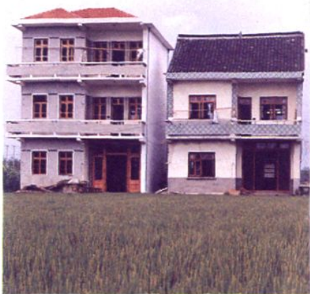
80年代农村居民住房