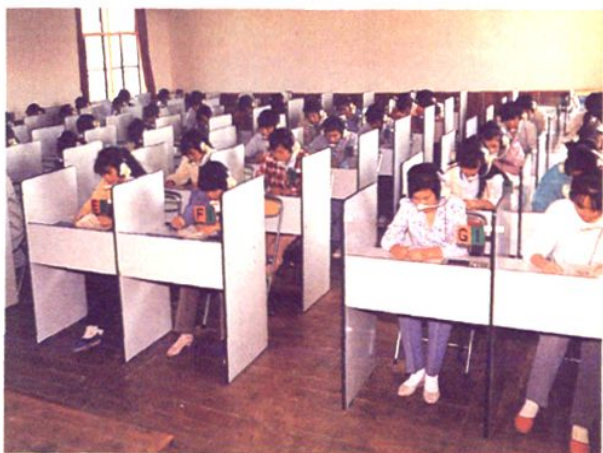
吕巷中学学生电化教育