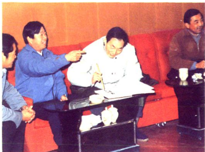
1989年12月26日上海市委书记、市长朱镕基视察浦江蛋禽公司