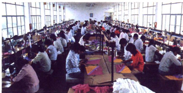
上海光明服装厂吕巷二分厂缝衣车间