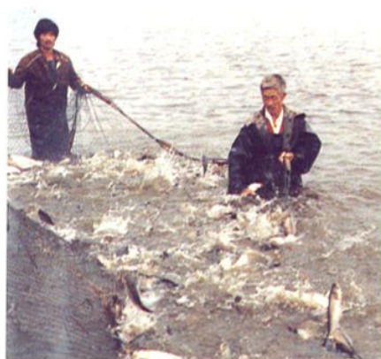
吕巷镇太平村精养鱼塘场