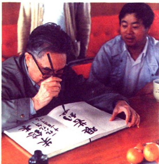
原上海市委书记夏征农视察浦江蛋禽公司