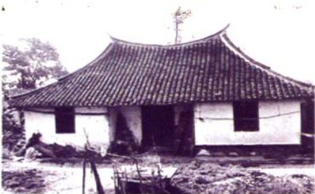
50年代农村居民住房