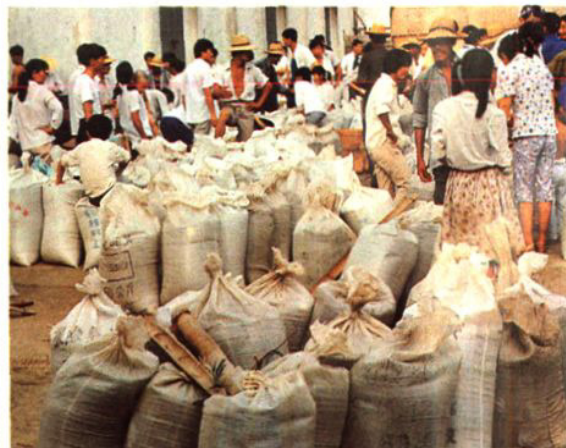
吕巷镇农民踊跃卖粮