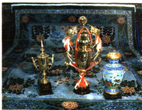
吕巷丝织地毯三次荣获国家 有关部门颁发的质量奖