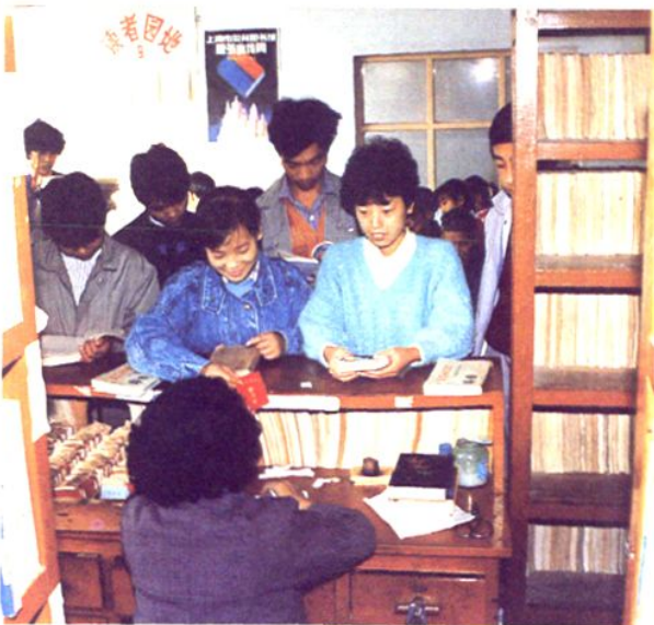
吕巷镇文化宫图书室