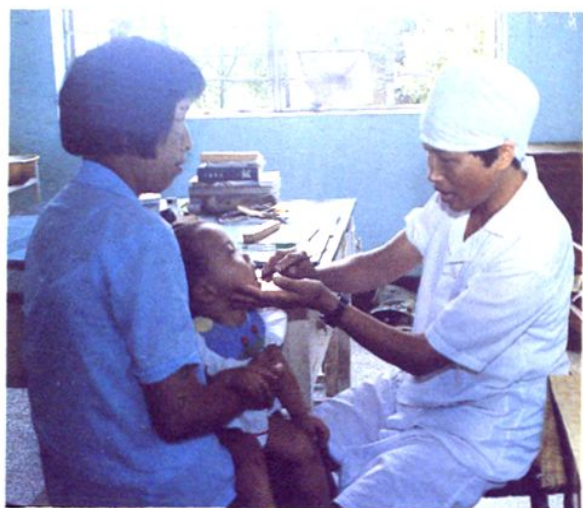
吕巷卫生院医生门诊