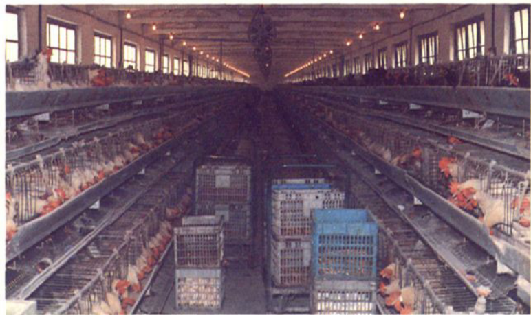
吕巷镇办机械化养鸡场