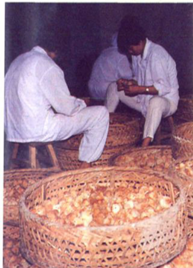
浦江蛋禽公司孵化苗鸡