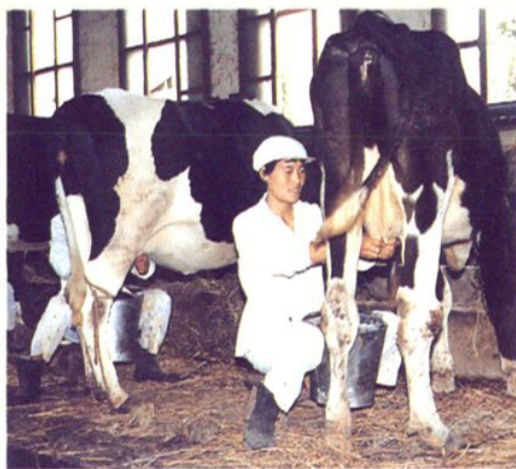
吕巷镇荡田村奶牛场