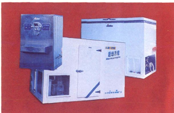
吕巷电气冰箱厂部分产品