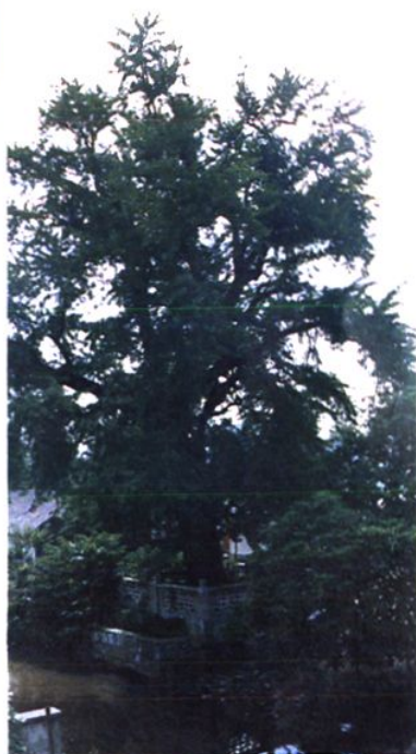
栽于明宣德年间的银杏树