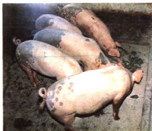
吕巷镇牧场瘦肉型猪