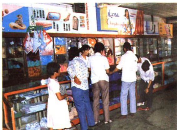
吕巷供销社百货公司