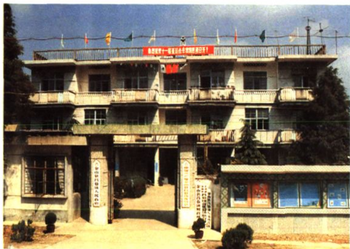
中共吕巷镇党委、吕巷镇政府机关办公楼