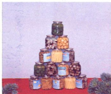
上海申翔食品有限公司生产各种果蔬罐头