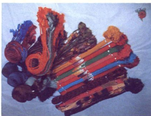
吕巷镇荡田村丝织厂和服腰带