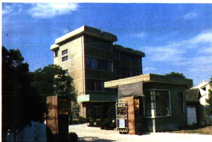
上海吕巷地毯联营厂