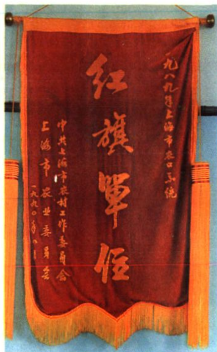
1989年吕巷镇评为市农口系统红旗单位