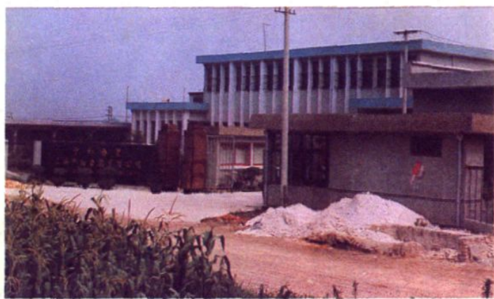
上海申翔食品公司