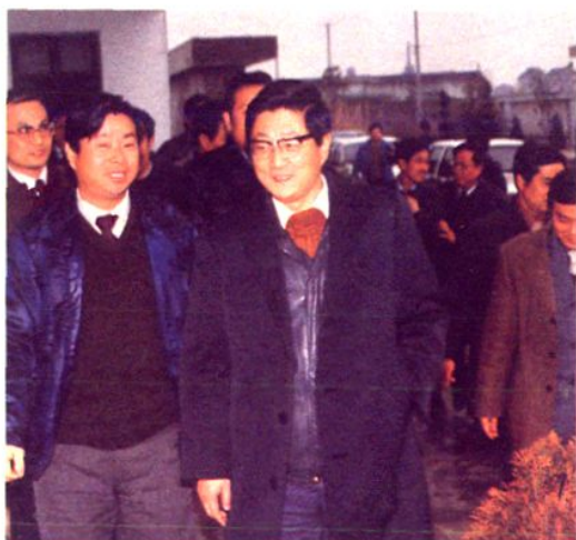
1991年1月1日上海市委副书记、常务副市长黄菊视察浦江蛋禽公司