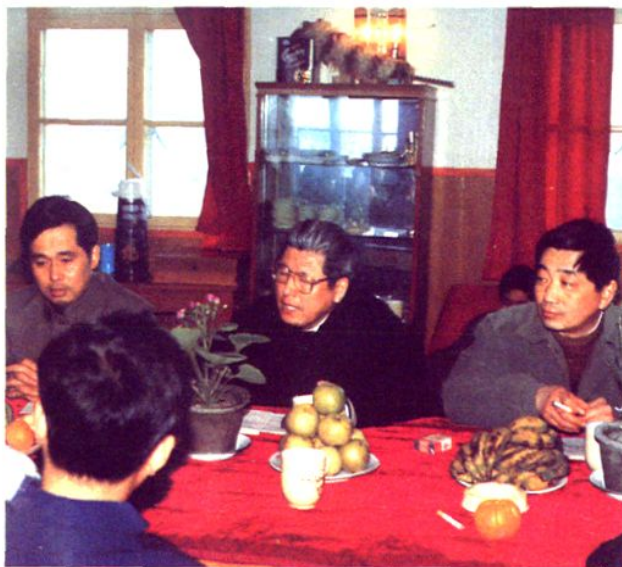
1988年11月24日上海市委副书记倪鸿福视察浦江蛋禽公司