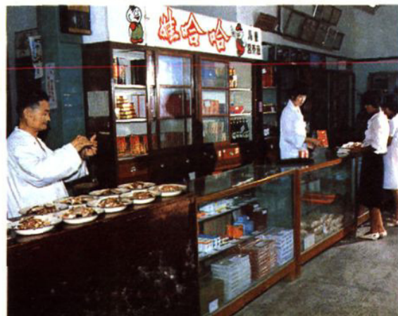
吕巷供销社国药店