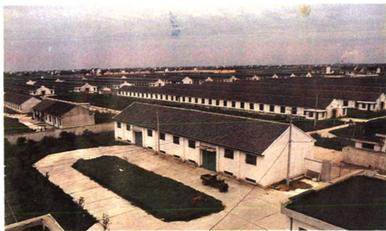
浦江蛋禽公司全景