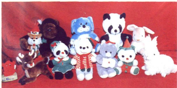
上海吕巷达华工艺品厂长毛绒玩具