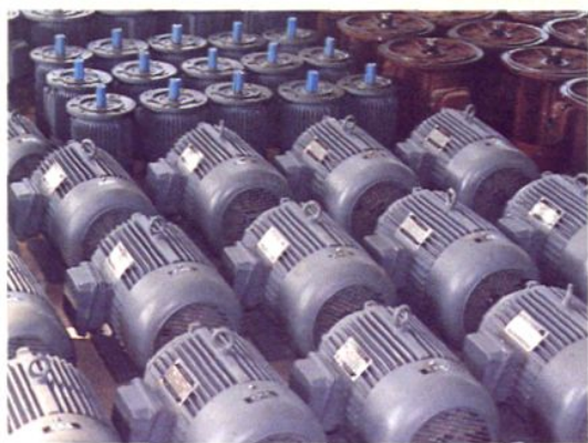
吕巷镇荡田村特种电机厂产品