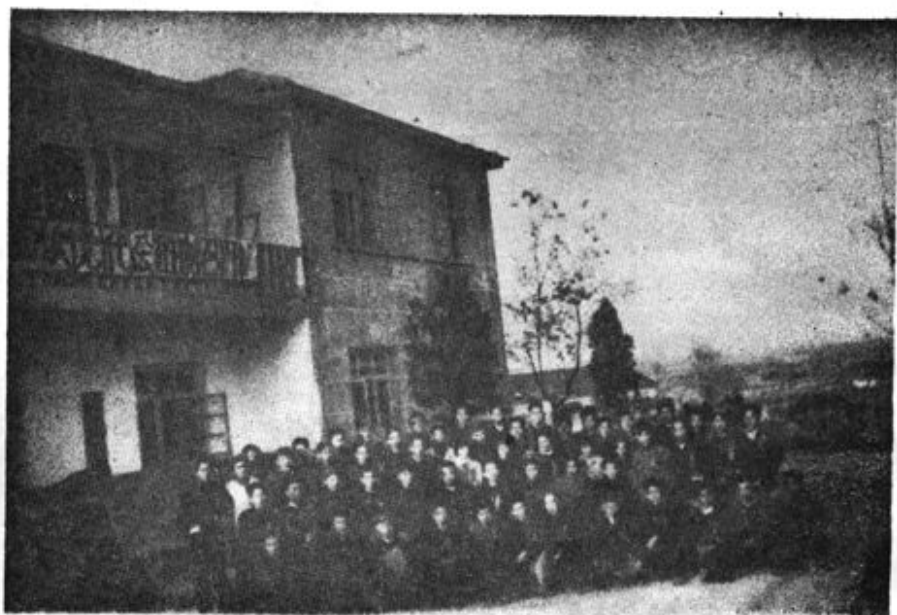
中共峨岭乡第四次代表大会全体代表合影