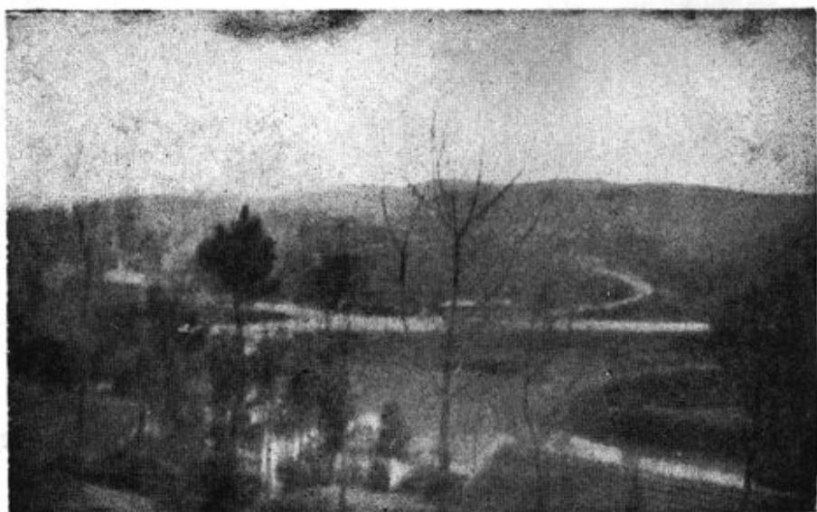
峨 岭 横 云