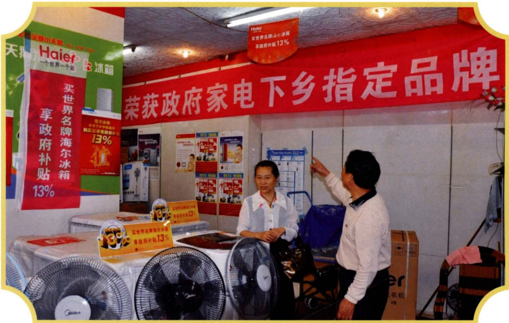
2010年4月,审计组人员查看家电下乡销售网点