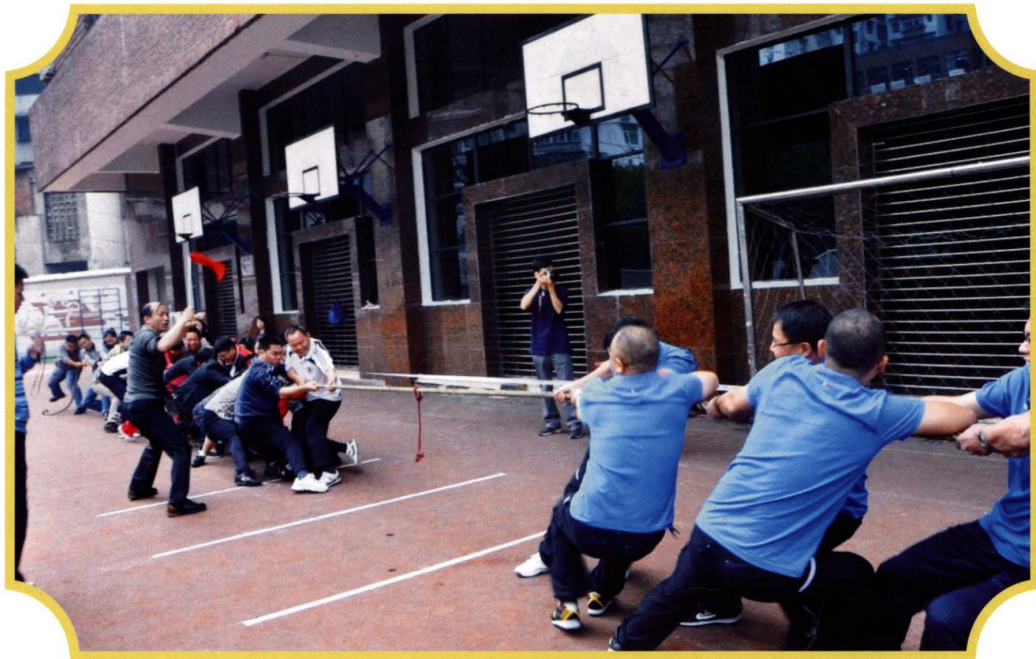
2012年3月,参加区机关拔河比赛