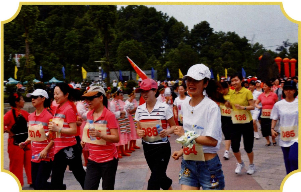
2011年4月，审计局参加区登山比赛活动