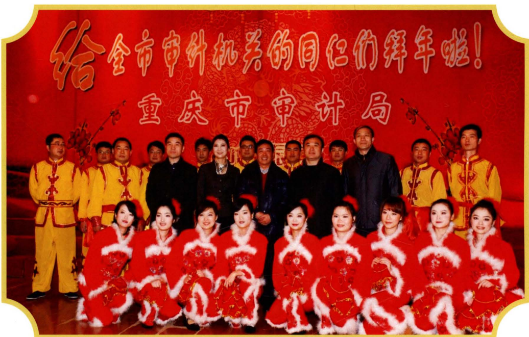
2011年12月,参加全市审计机关文艺表演