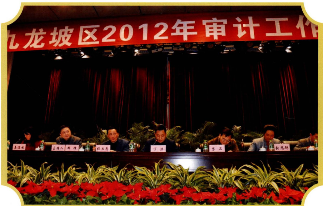
2012年,区政府区长丁洪出席全区审计工作会并做重要讲话