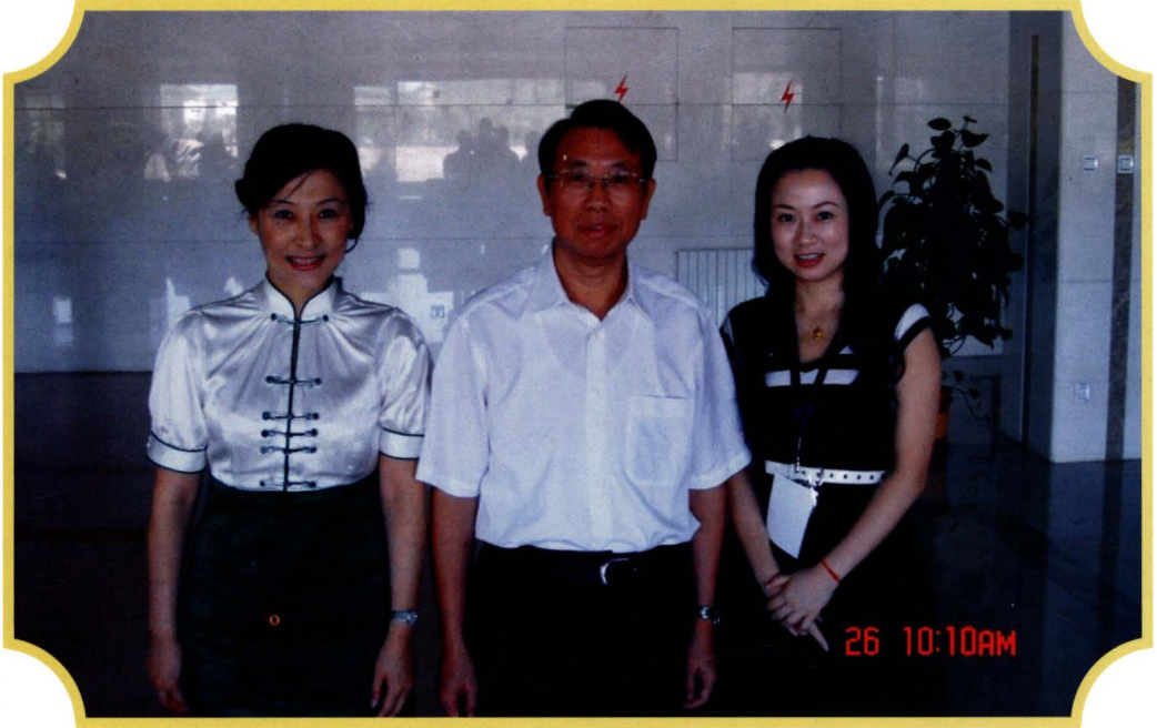
2009年6月,国家审计署审计长刘家义(中)接见我局审计干部(右)