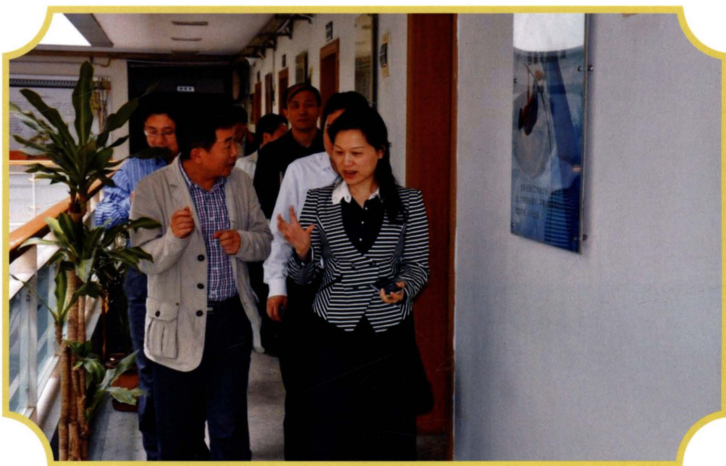
2012年,重庆市审计局局长卢建辉(右)到九龙坡调研工作