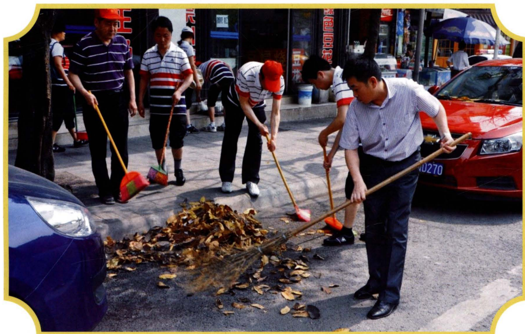
2012年4月,开展洁净家园义务劳动