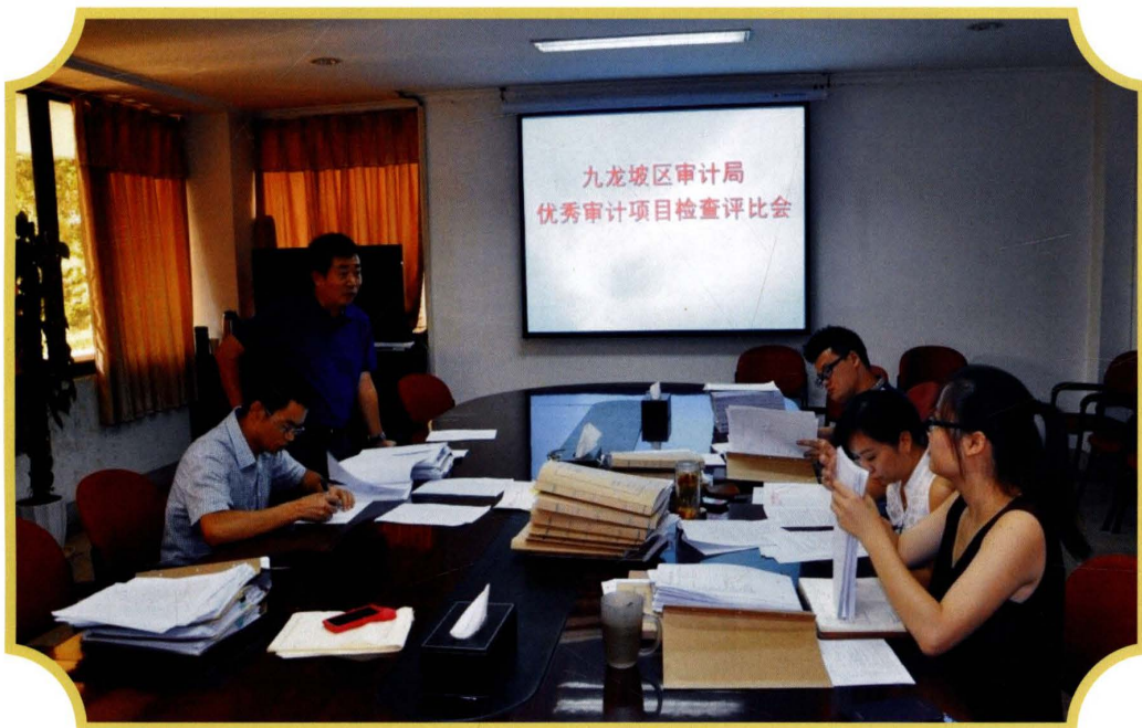
2008年7月,审计局开展优秀项目评选