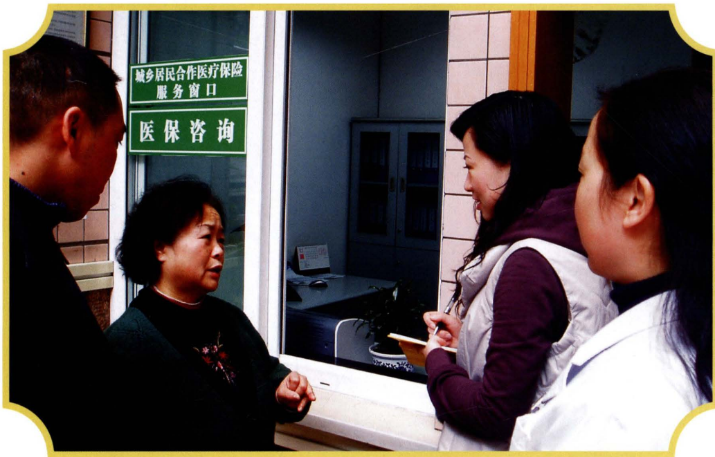
2007年12月，审计组到社区开展社会保险基金审计调查