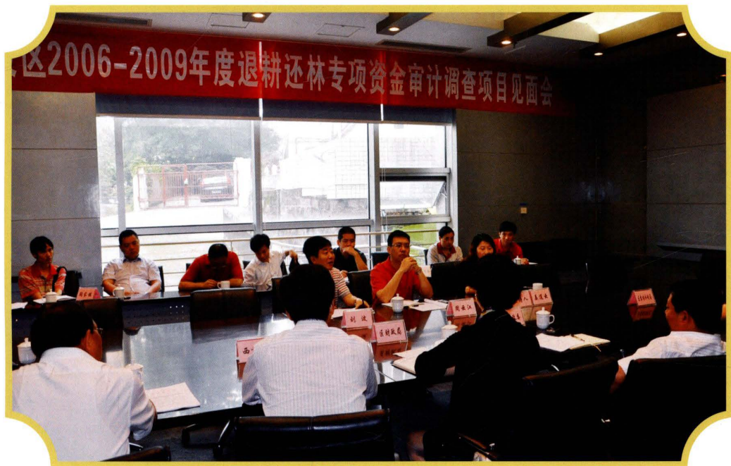
2010年6月4日，审计组召开退耕还林专项资金审计调查见面会