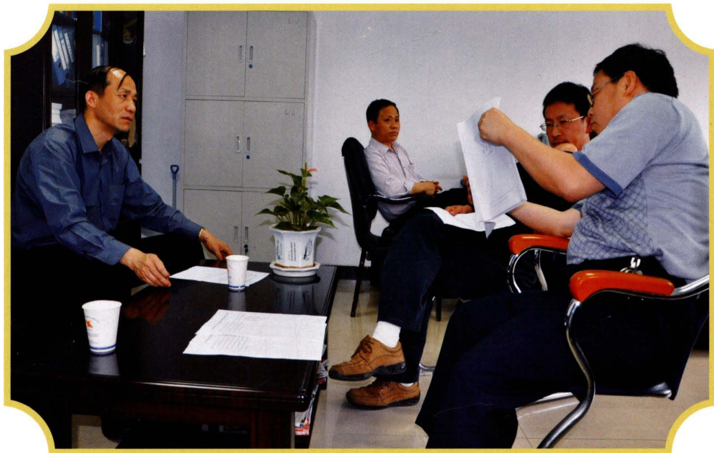
2010年5月6日，兰华副局长（左一）带队开展审计回访工作