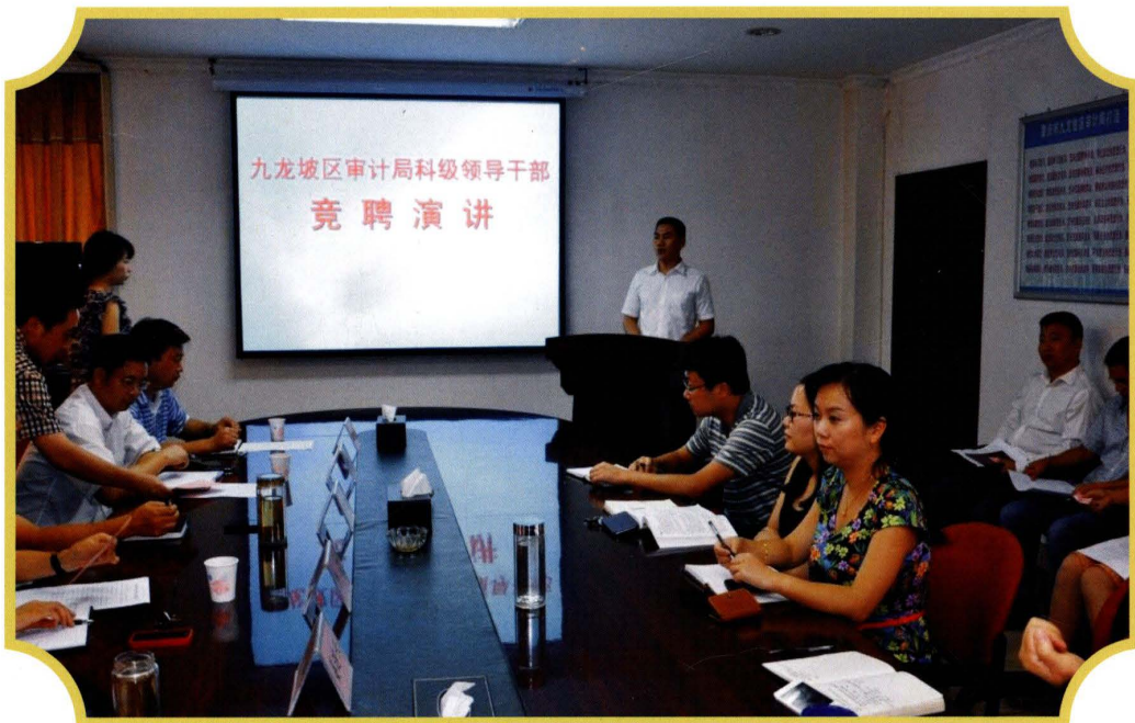
2012年7月,通过公开竞聘选拔科级领导干部