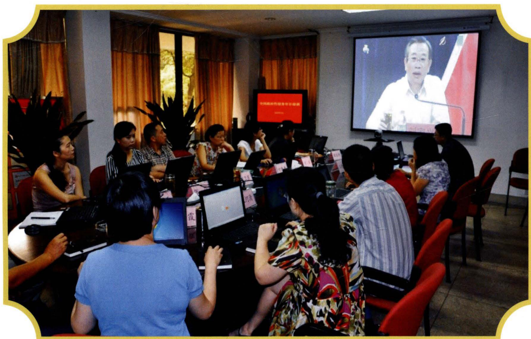
2012年12月,审计局干部职工参加审计署业务培训视频会