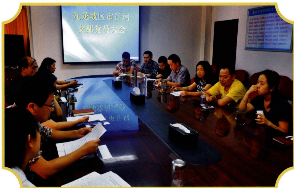
2011年6月,审计局召开党员支部大会