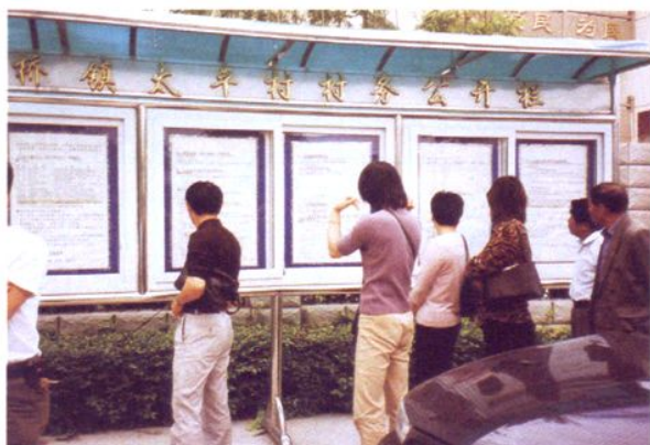
太平村村务公开栏