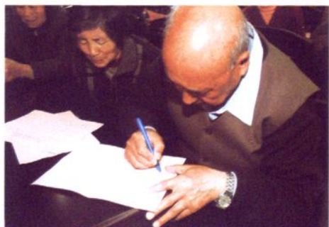
村民积极参政议事