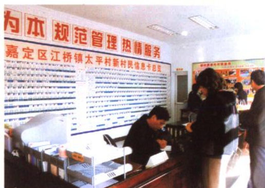
为新村民登记办证