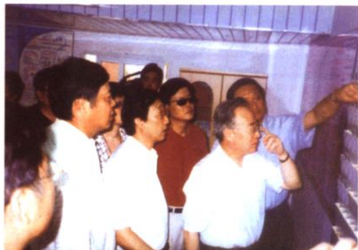
2004年6月21日，国家计生委主任张维庆（前排右一）、副主任王国强（后排右二）等一行到太平村调研人口与计划生育工作