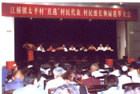
村民投票选举 村委会干部