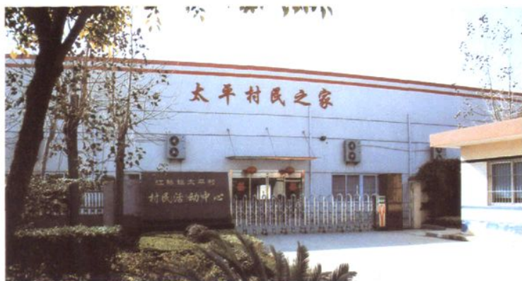
多功能活动场所 ——太平村民之家