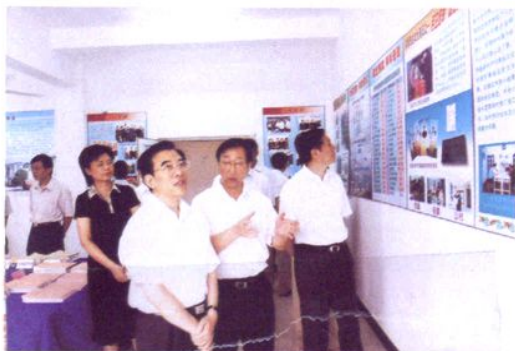
2004年7月15日，中共上海市委副书记王安顺（前排右三）到太平村调研