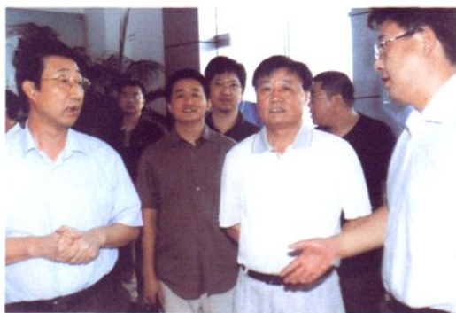
2007年9月11日，北京市顺义区委组织部一行到太平村学习参观