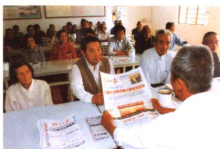
组织村民学习党的十七大精神