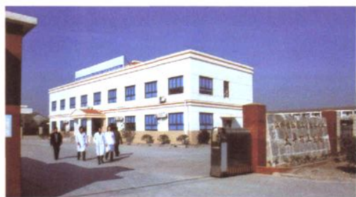
太平村中心卫生站