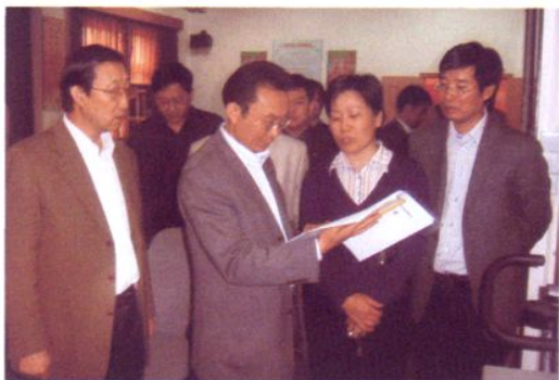
2008年4月23日，中组部远程教育领导小组领导到太平村视察农村远程教育情况