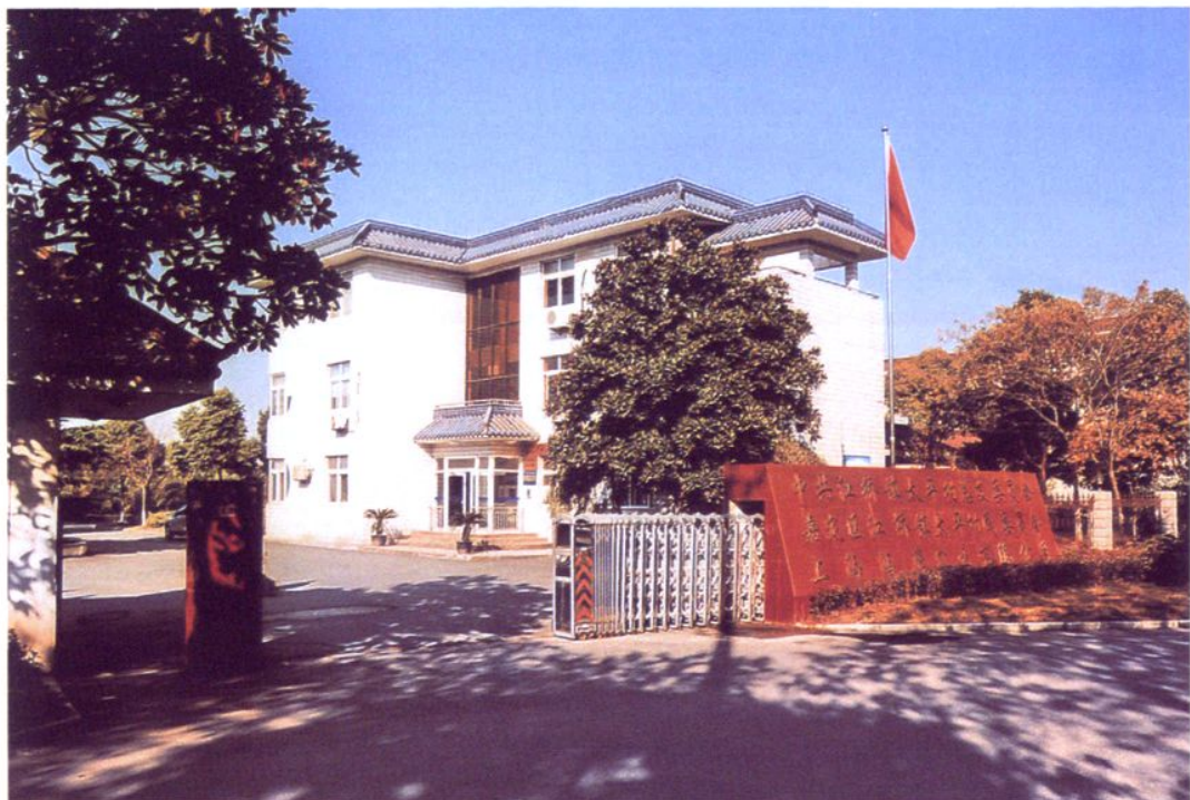
太平村村民委员会