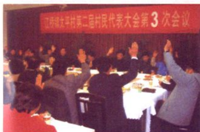
2007年1月21日，村二届第三次村民代表会议