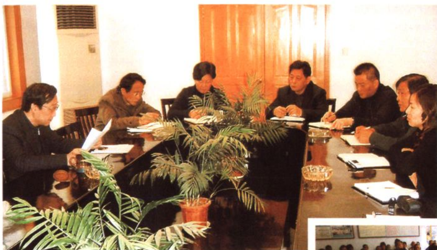
村干部商量研究工作