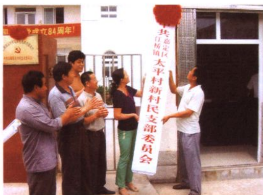
上海市郊第一个新村民党支部——中共太平村新村民党支部成立揭牌