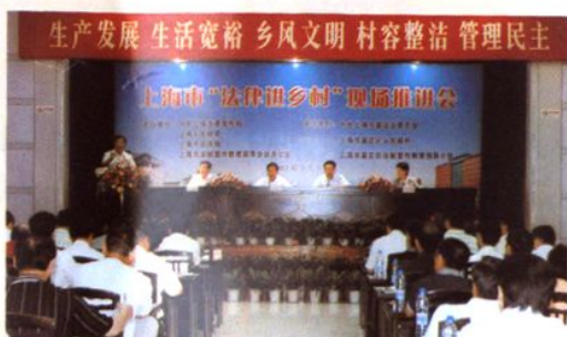
2007年8月9日，上海市“法律进乡村”现场推进会在太平村召开