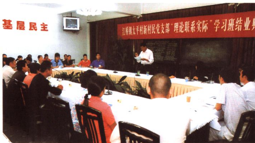
新村民党支部举办“理论 联系实际”学习班