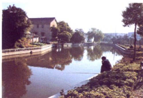
卫生整治后，河水清澈，生态优化