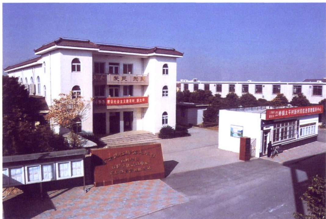
太平村百姓学校、社区文化活动中心