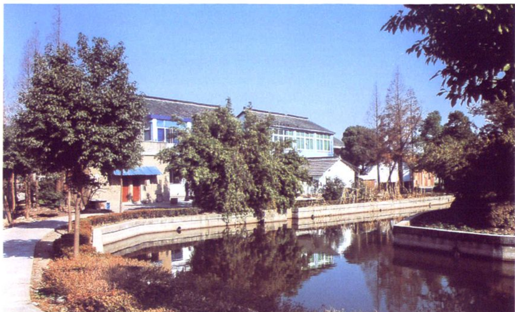
太平村旧宅换新貌