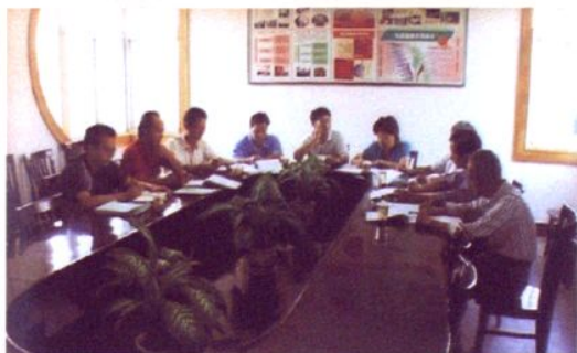
太平村村务监督小组商讨工作