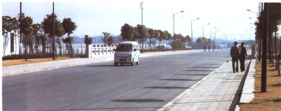
工业园区主干道——宝园四路