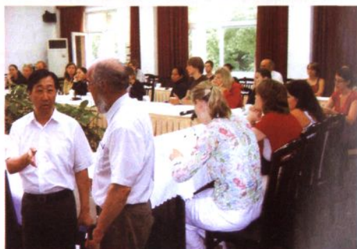
2005年7月13日，复旦大学外籍留学生到太平村调研中国基层民主政治建设开展情况