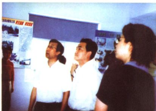
2004年3月30日，上海市民政局局长徐麟（中）等领导到太平村调研