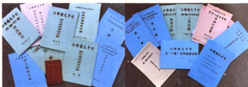
太平村民主管理工作台账