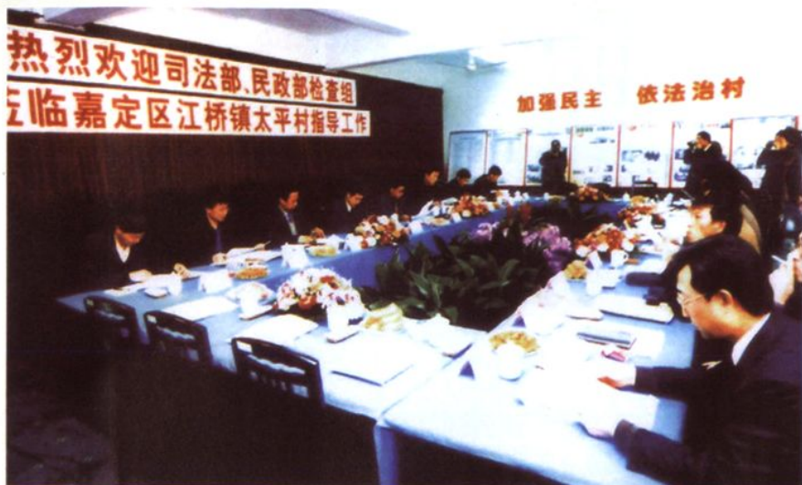
2004年2月20日，国家司法部、民政部评选“全国民主法治示范村”检查组到太平村检查、考察