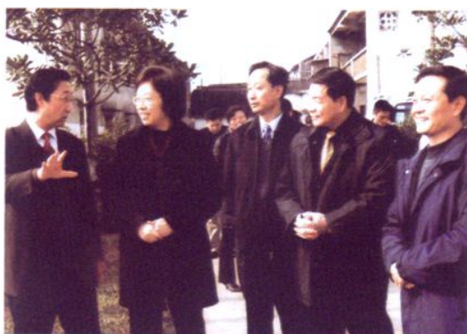
2006年1月22日，中共上海市委副书记殷一璀（左二）到太平村视察