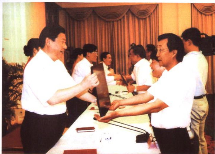
2007年9月28日，太平村党总支书记、村委会主任苏兴华（前排右）参加上海市农村党建工作会议。时任中共上海市委书记的习近平同志（前排左）向太平村颁发上海市“五好村党组织”荣誉证书