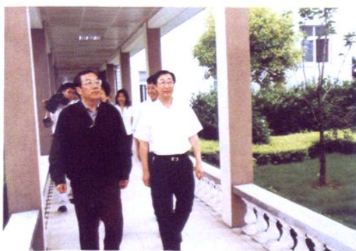
2004年6月16日，上海市副市长杨晓渡（左一）视察太平村医疗卫生工作