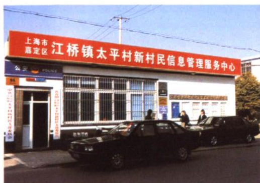
太平村新村民信息管理服务中心