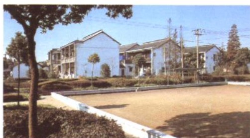
改造后的村民住宅外景