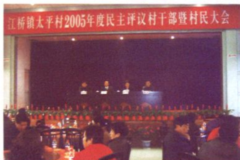
2006年1月22日，太平村召开“2005年度民主评议村干部暨村民大会”，经过324位到会村民民主评议，村两委会主要干部全部获得“满意”的高分