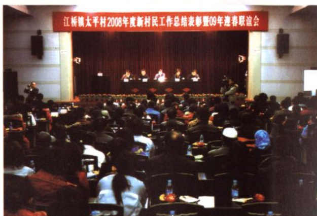
太平村召开新村民工作总结大会