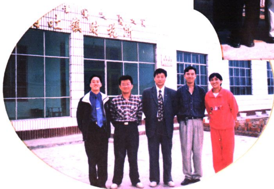
◀ 舍伯吐镇 财政所