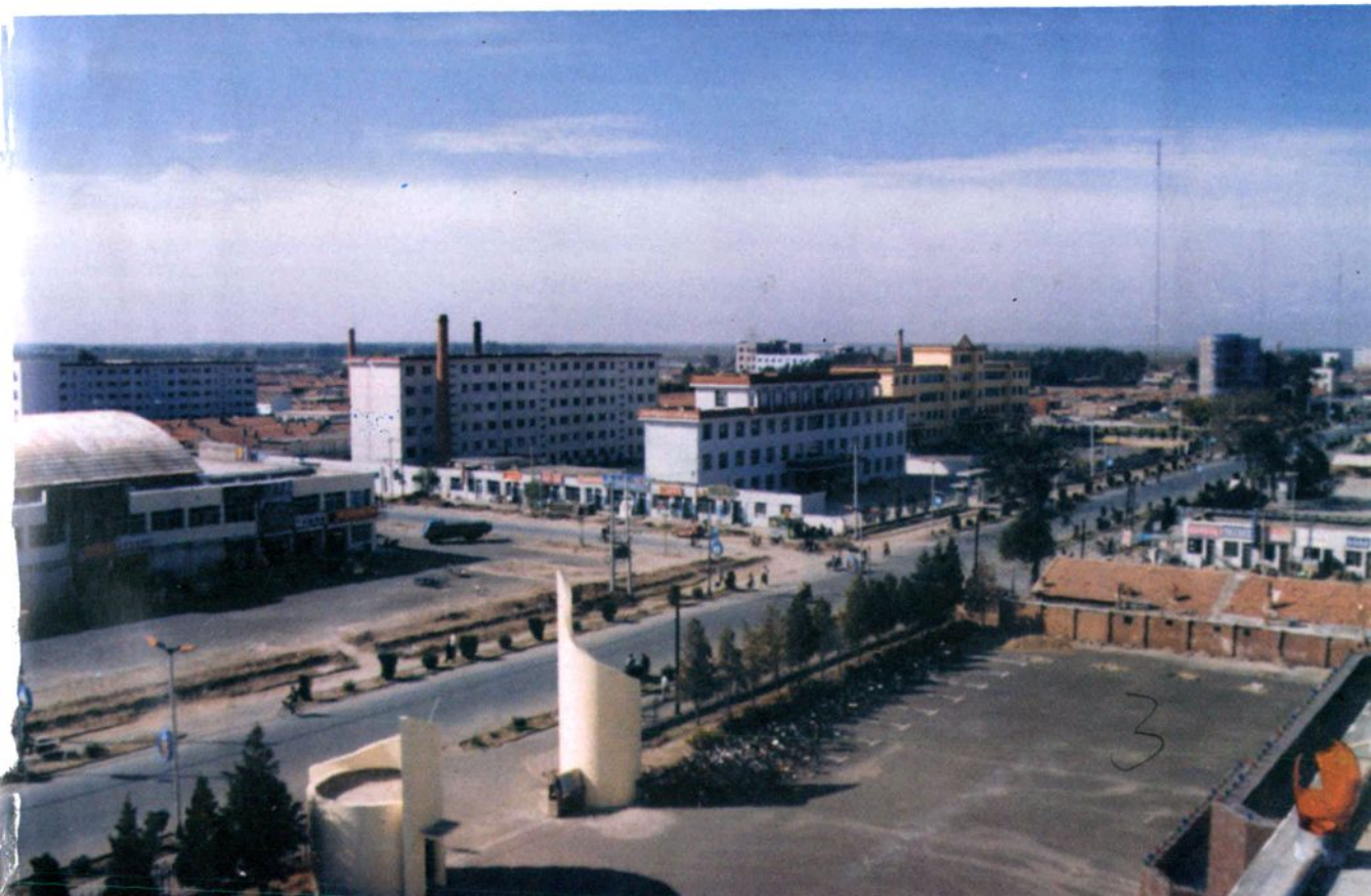
▼ 旗人民政府所在地保康街景