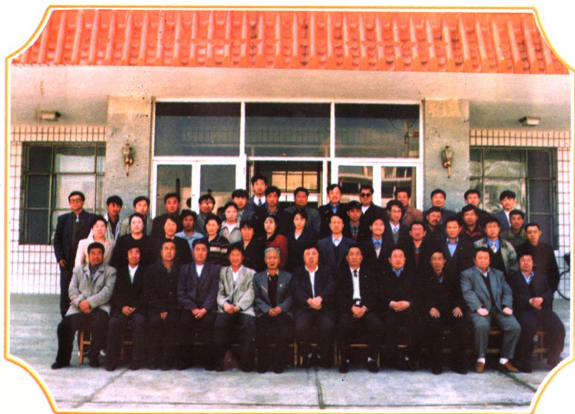
▲旗财政局全体职工