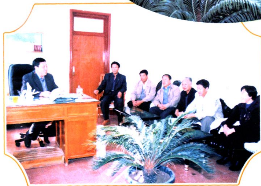
◀局党支部 全体成员