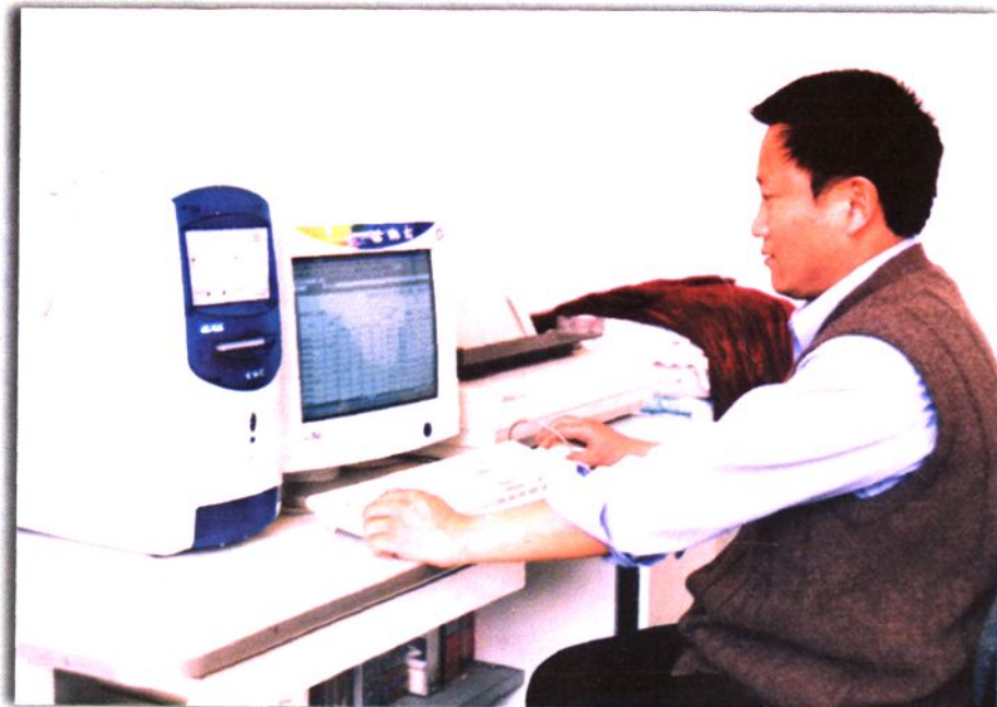
◀ 电 算 化 操 作