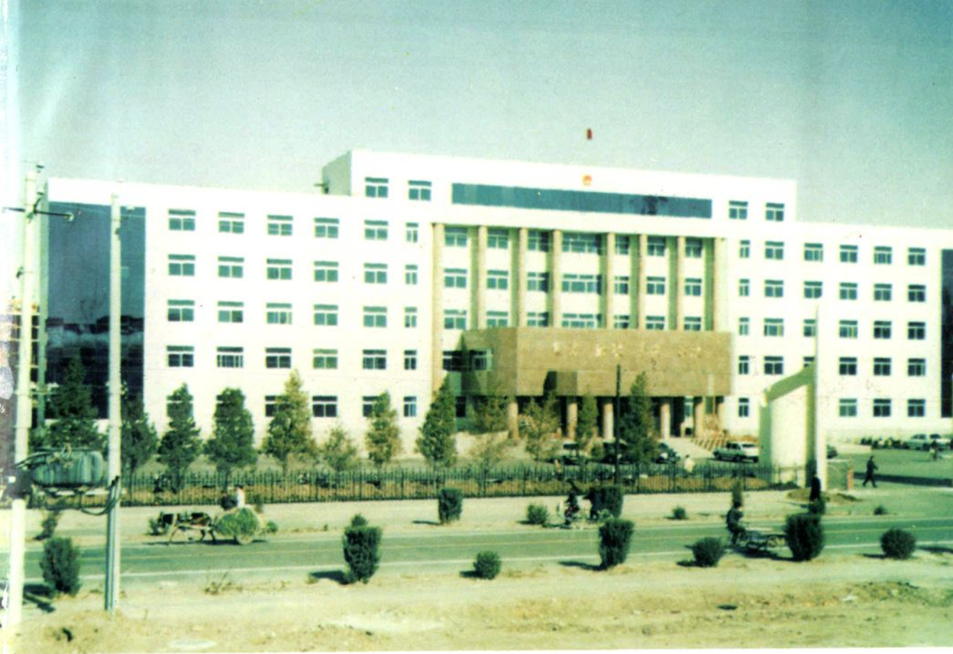
▲ 科尔沁左翼中旗人民政府办公楼