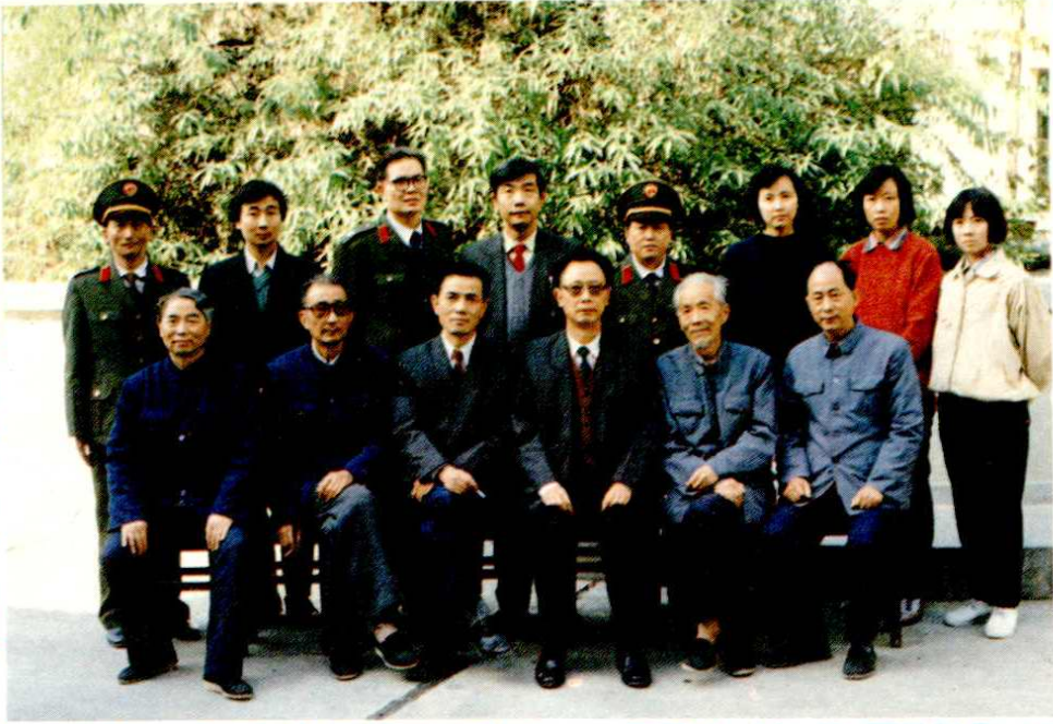
县交通志领导小组及办公室人员合影