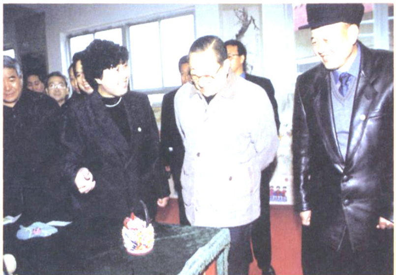
2000年2月中共中央政治局常委、国务院副总理李岚清（中）在泾阳作“三讲”教育动员报告时视察工作