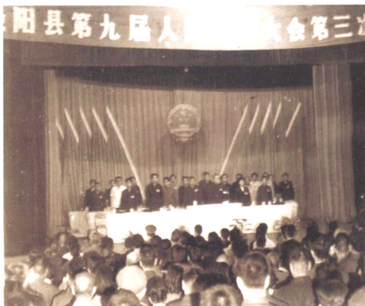
泾阳县第九届人民代表大会第三次会议会场