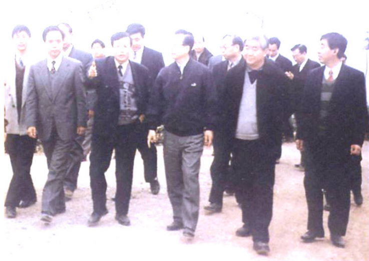
1998年2月中共中央政治局委员中央书记处书记国务院副总理温家宝(中)在泾阳视察工作