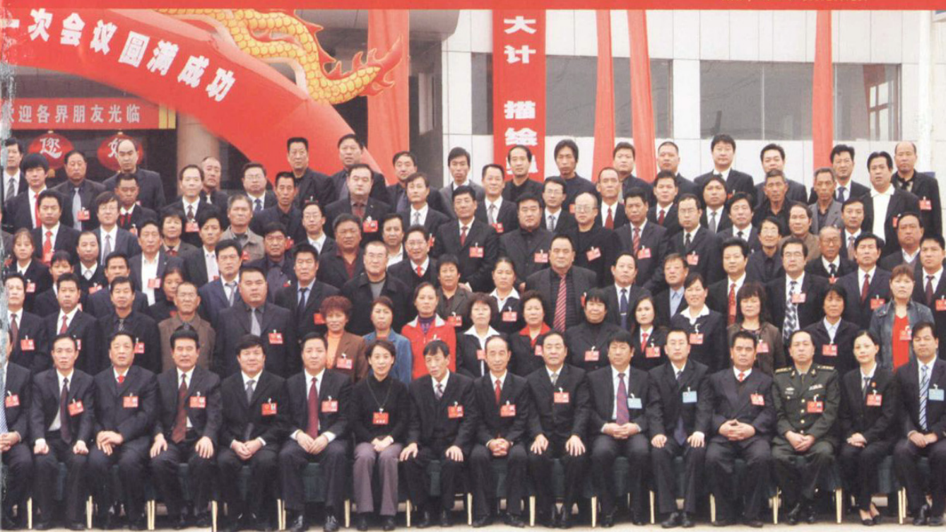
泾阳县第十五届人大代表合影