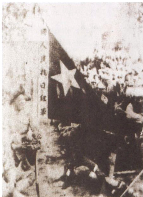
1937年8月中国工农红军在云阳镇召开改编为国民革命军八路军东渡抗日誓师大会