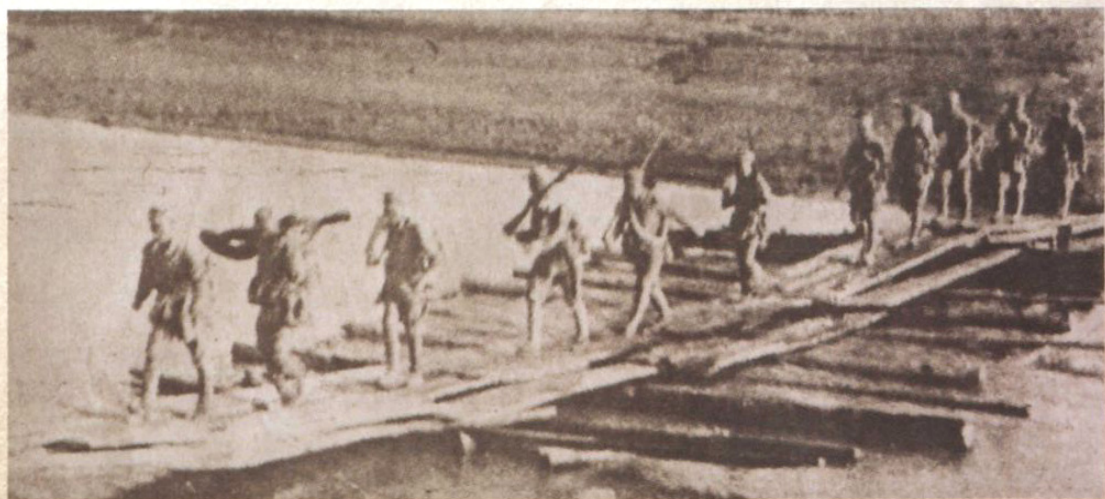
1949年5月一野六军解放泾阳后渡泾河南下