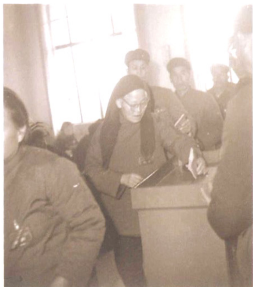
泾阳县八届人大一次会议人大代表投票选举