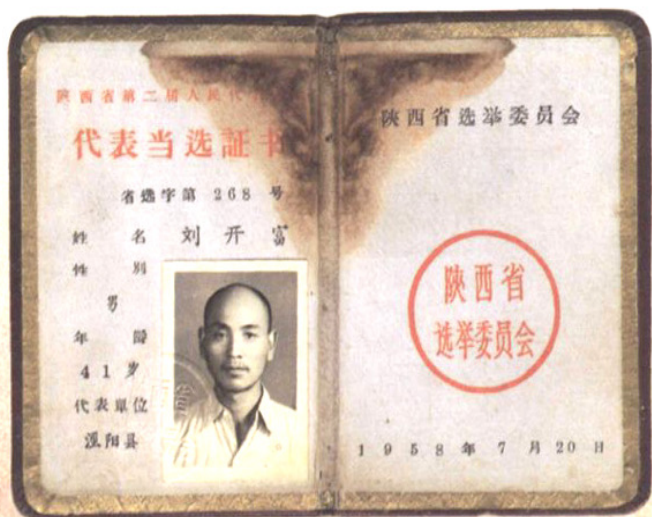
1958年陕西省人大代表当选证书