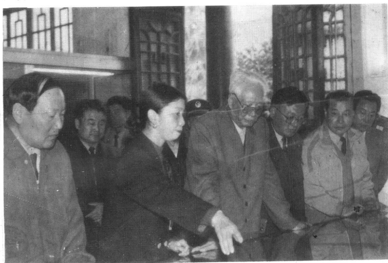
1996年10月29日中央军委副主席张震参观古汉台