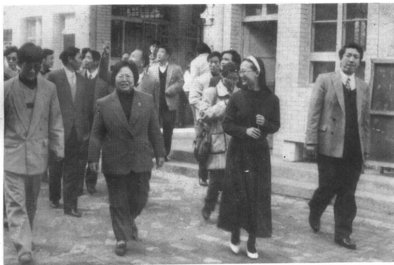
1995年11月9日国务委员、全国计生委主任彭珮云参观古汉台