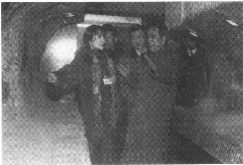
1998年1月21日陕西省委书记、省人大常委会主任李建国 参观古汉台褒斜栈道陈列室