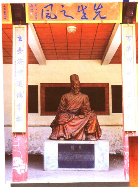
昆明昙华寺兰茂像