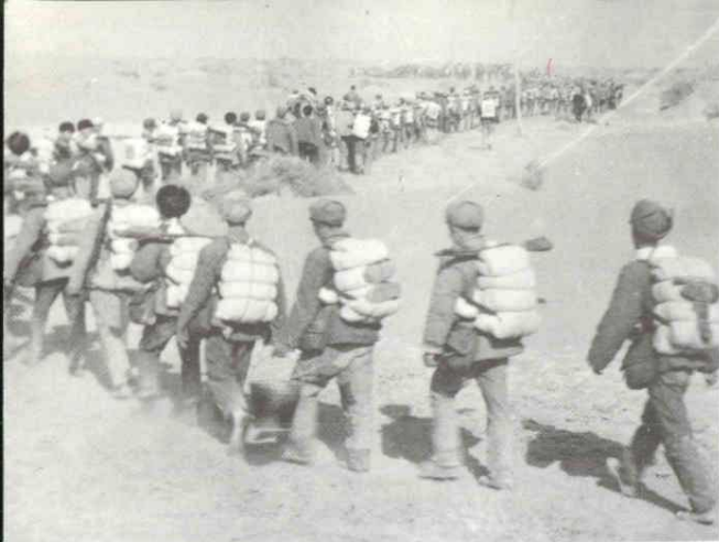
进军喀拉库勒。(1955 年秋)