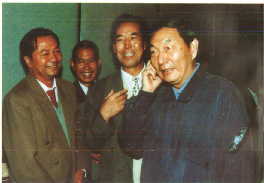
1995年9月11日,中共中央政治局常委、国务院副总理朱镕基视察农一师时与农一师政委王宏年、三团政委郑连真在一起。前自左至右:郑连真、王宏年、朱镕基。