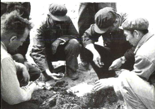
1958年,胜利七场政委雪糕(右一)和苏联专家(左一)等对土壤进行调查研究。