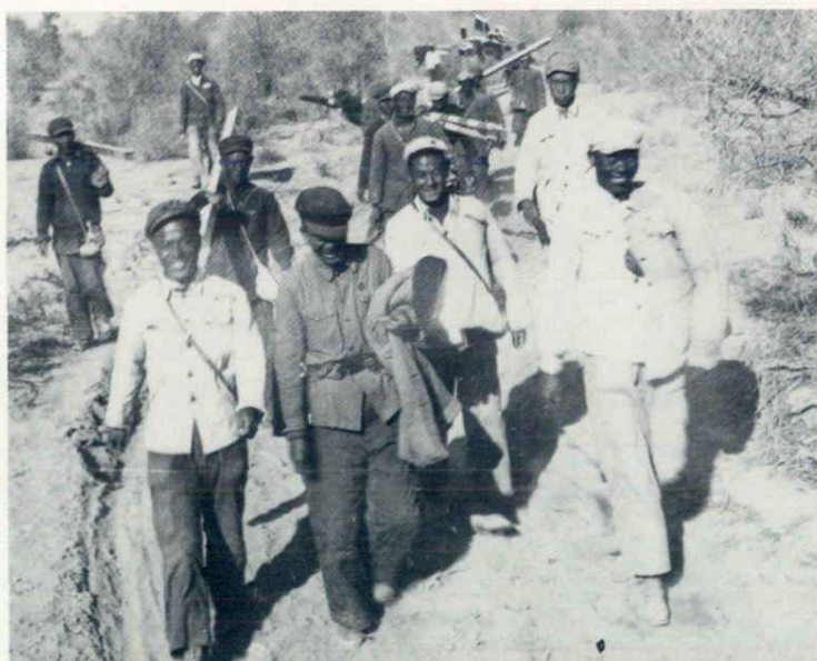
勘察喀拉库勒荒原。（1955年秋）