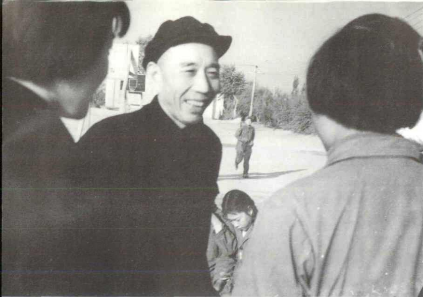
1964年10月6日,中共中央委员、国家农垦部部长王震视察胜利七场(现三团)时与职工亲切交谈。