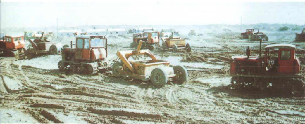
机械化开荒造田。 (1995 年)