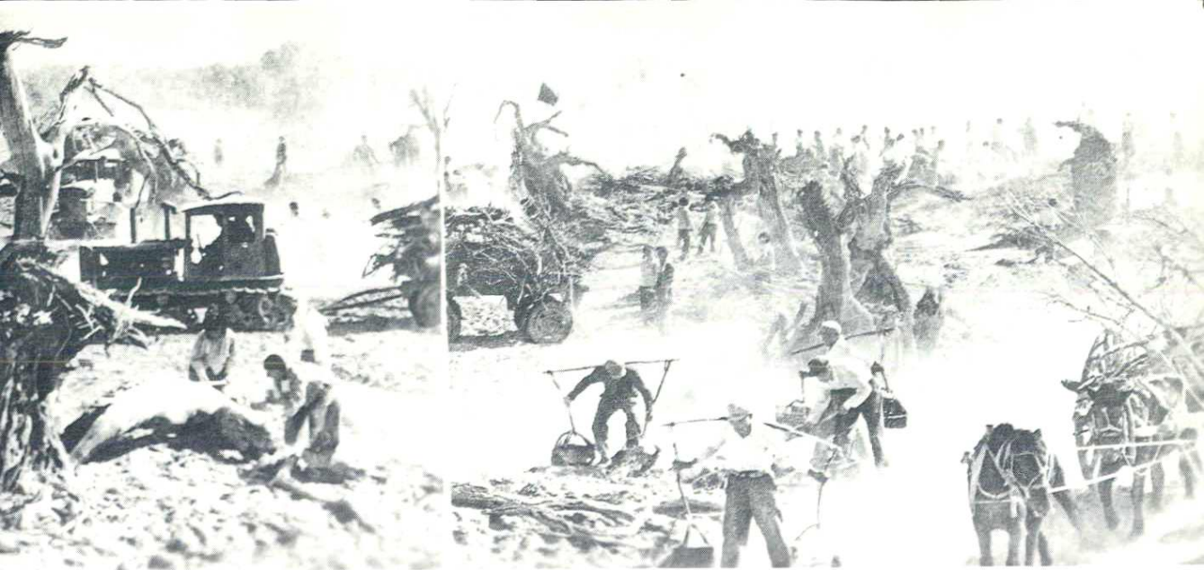
大规模开荒造田。(1956年)