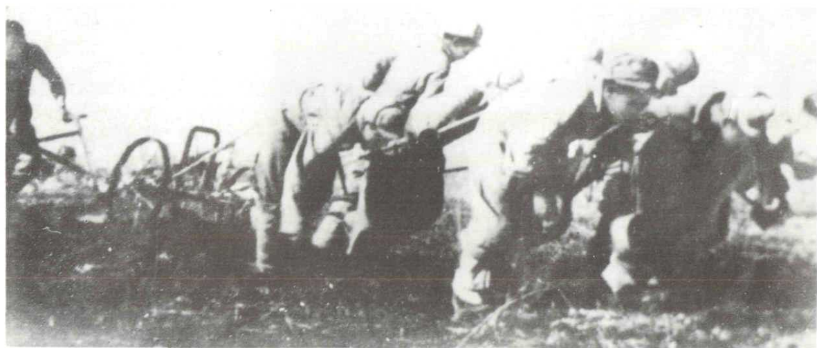
人力牵引“四马犁”耕地。(1956 年)