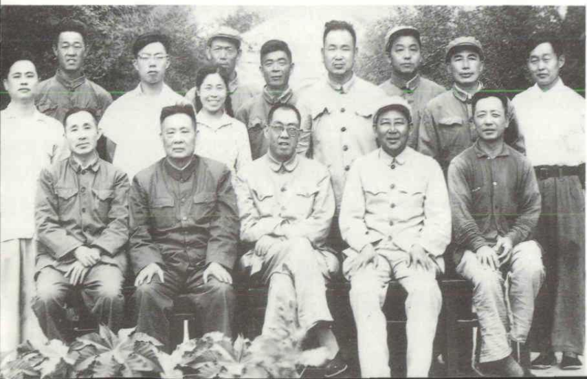
1963年7月3日,国家农垦部副部长刘型在兵团、农一师首长等陪同下视察胜利七场。前排左起:农一师政委杜宏鉴、兵团司令员陶峙岳、刘型、农一师师长林海清、农一师胜利一总场场长张耀奎;二排右起:七场副政委郭增品、场长张明显、党委书记王无逸、副场长杜立海。