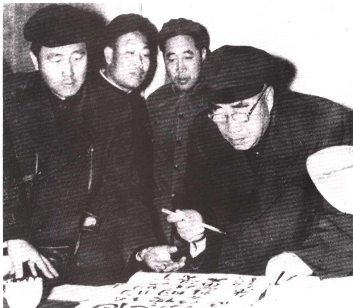
1958年11月14日朱德委员长视察永久沽厂(今天津碱厂)并题词。