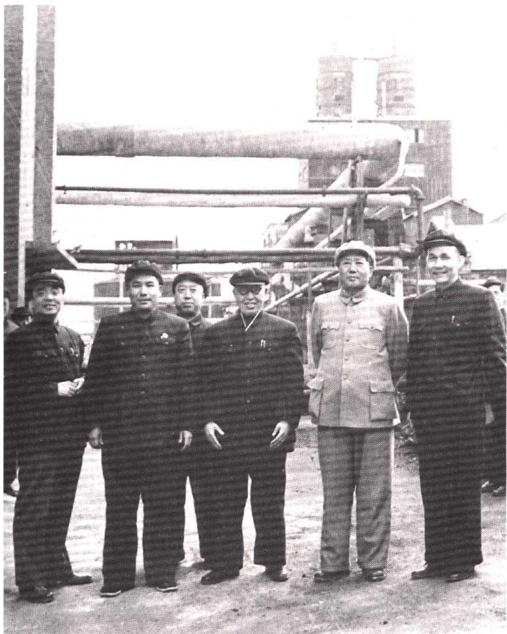
1954年4月23日毛泽东主席视察永利碱厂(今天津碱厂) (前排左起：杨尚昆、陈西平、李烛尘、毛泽东、黄火青。 后排：腾代远)。