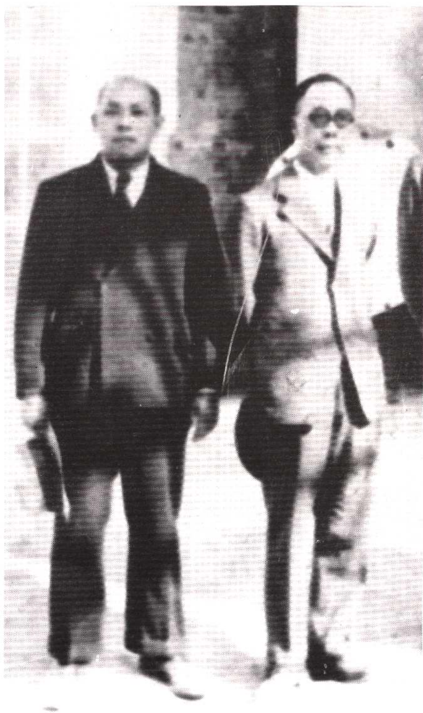
永利碱厂创始人范旭东与侯德榜合影。