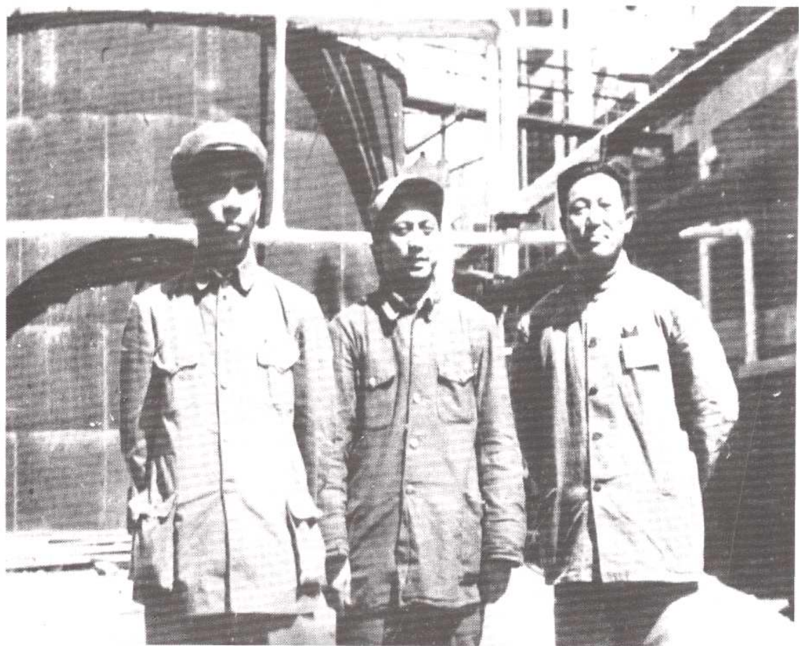
1949年5月7日刘少奇主席视察永利碱厂(今天津碱厂) 左起：刘少奇、周克刚（原塘沽区区长）、 佟翕然（永利碱厂厂长）。