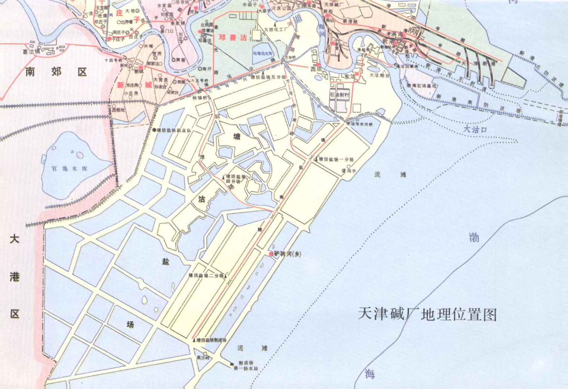
天津碱厂地理位置图