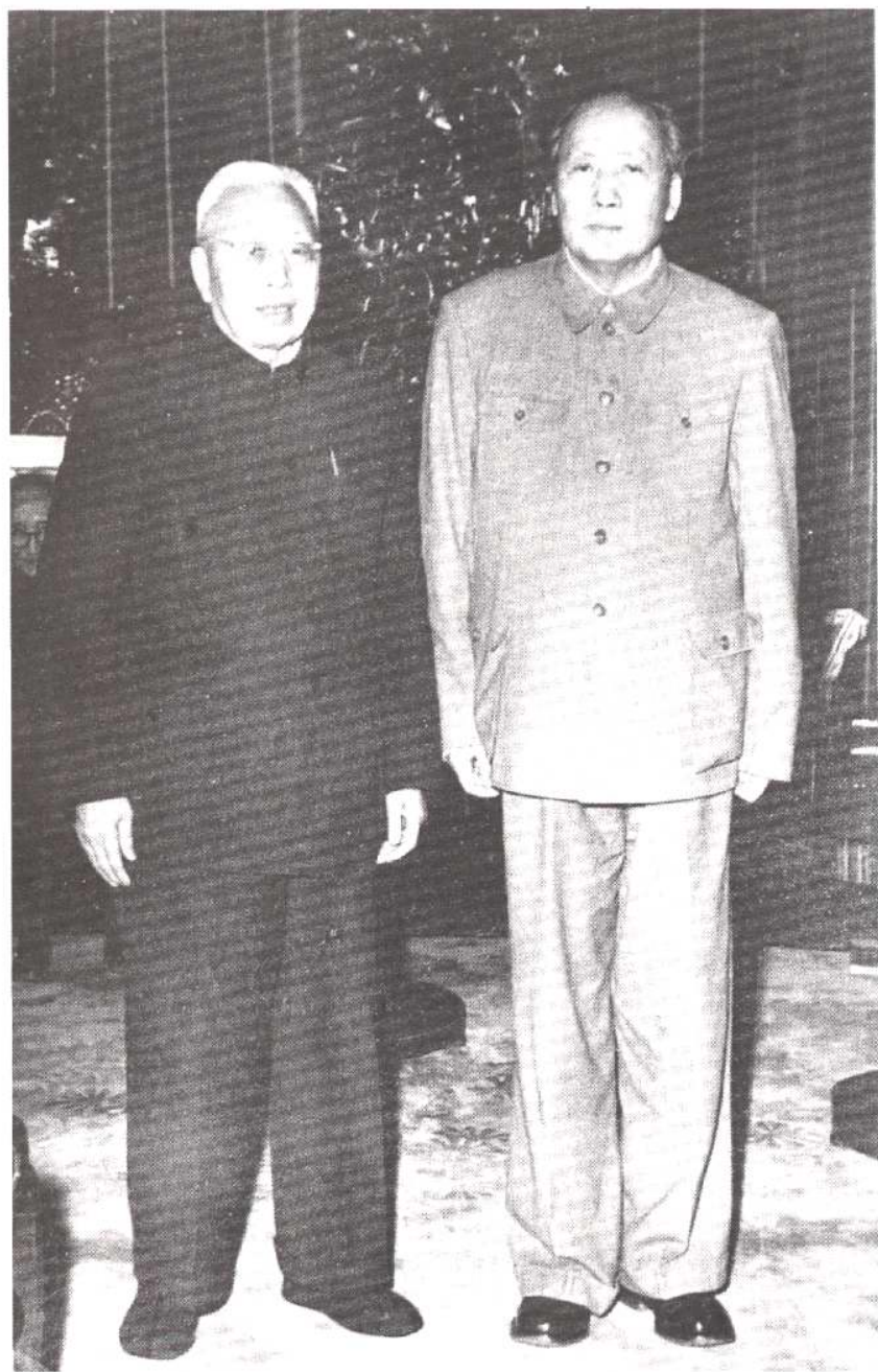
1956年毛泽东主席与永利碱厂创始人之一李烛尘合影。