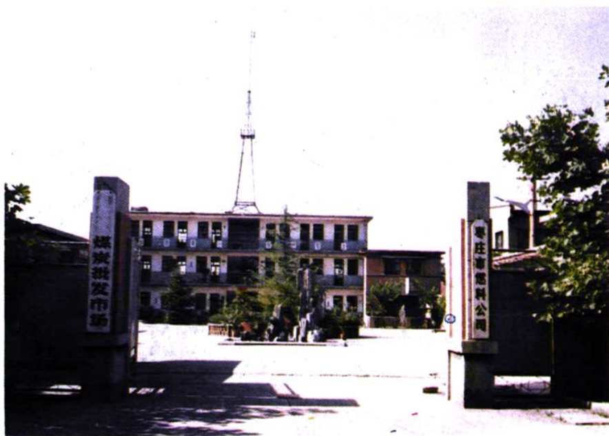
• 枣庄市燃料公司大门外貌