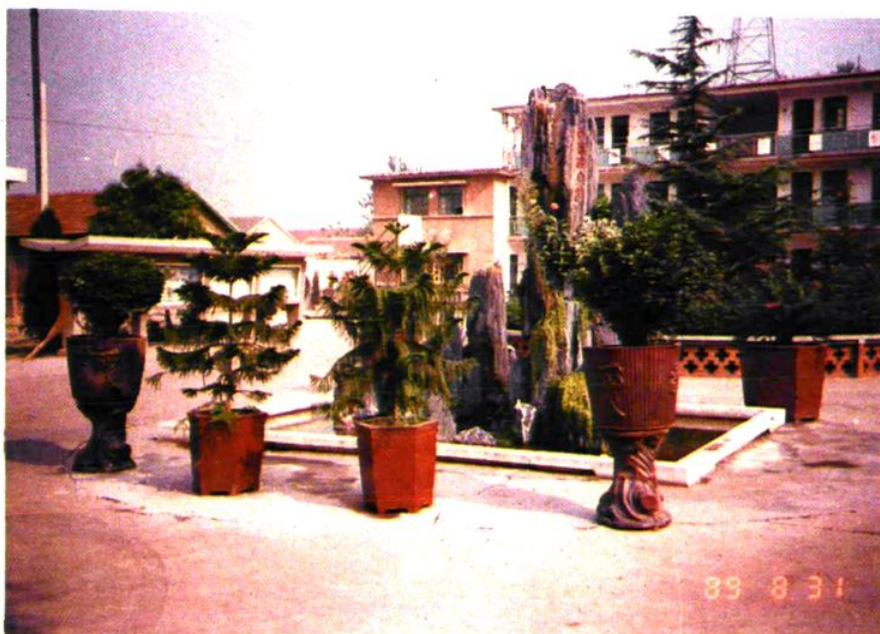
• 花木生輝 院內小景