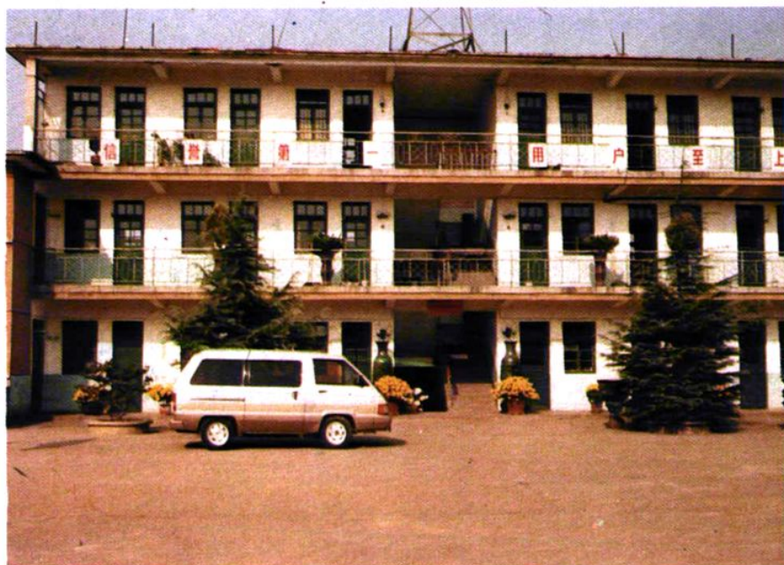
• 枣庄市燃料公司办公楼外貌