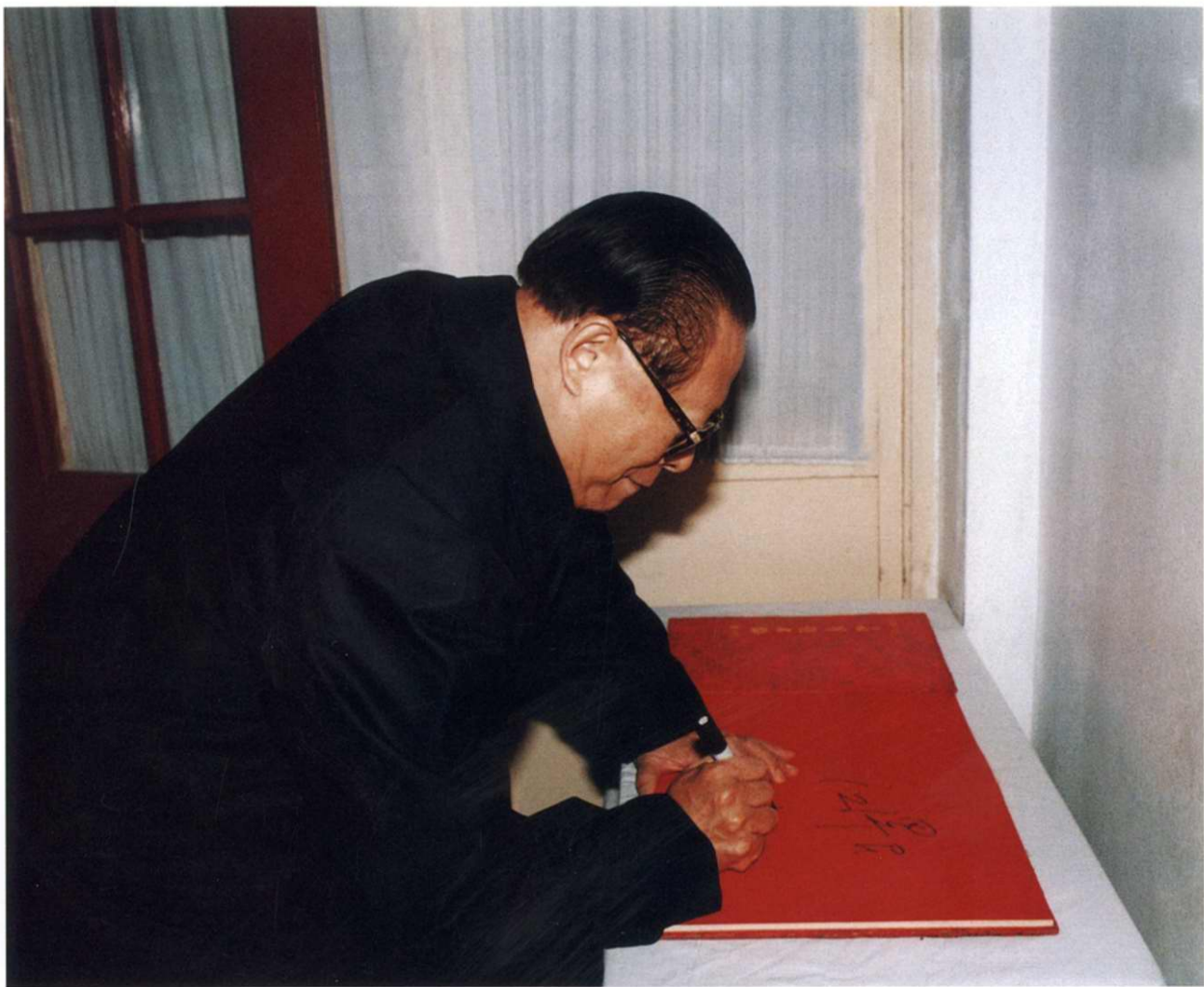
江泽民总书记在双清签字留念