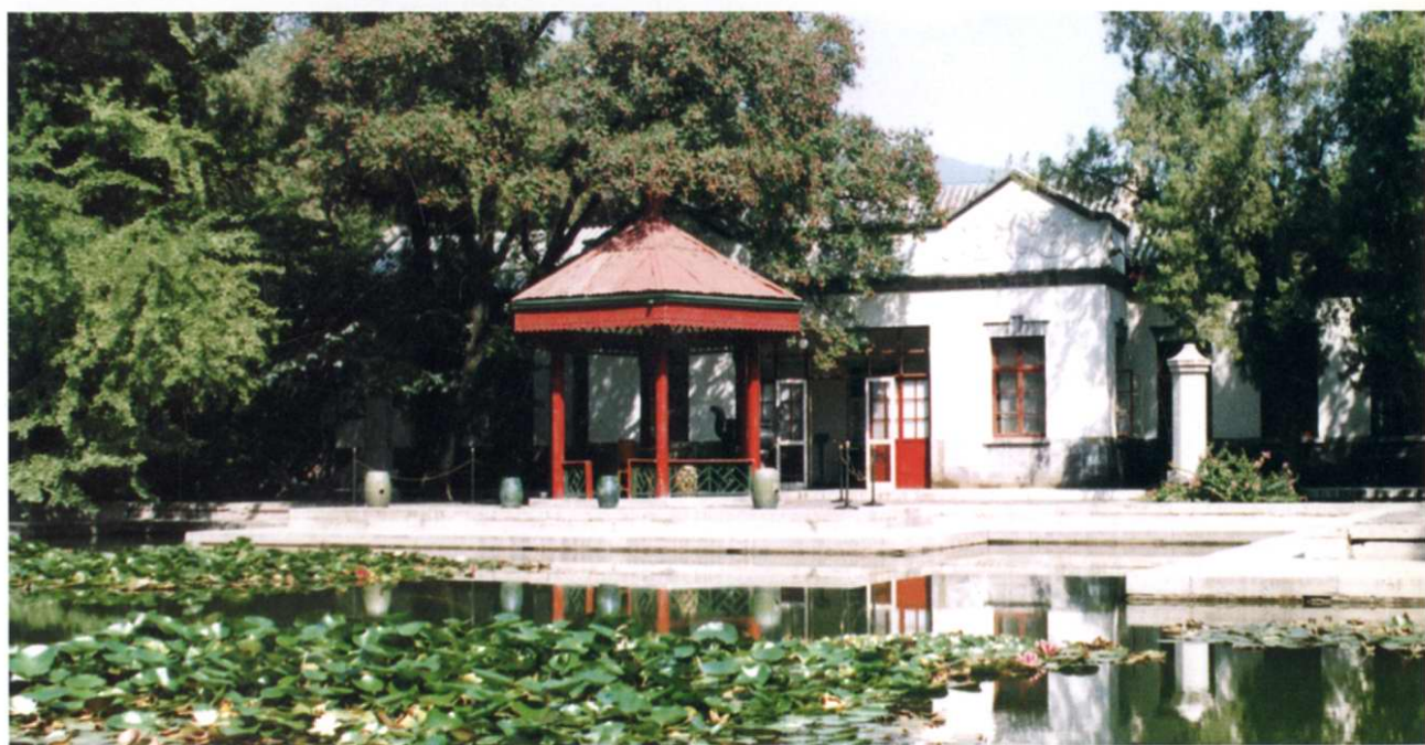
双清别墅·青少年教育基地