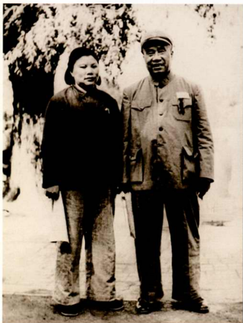
朱德 康克清在香山