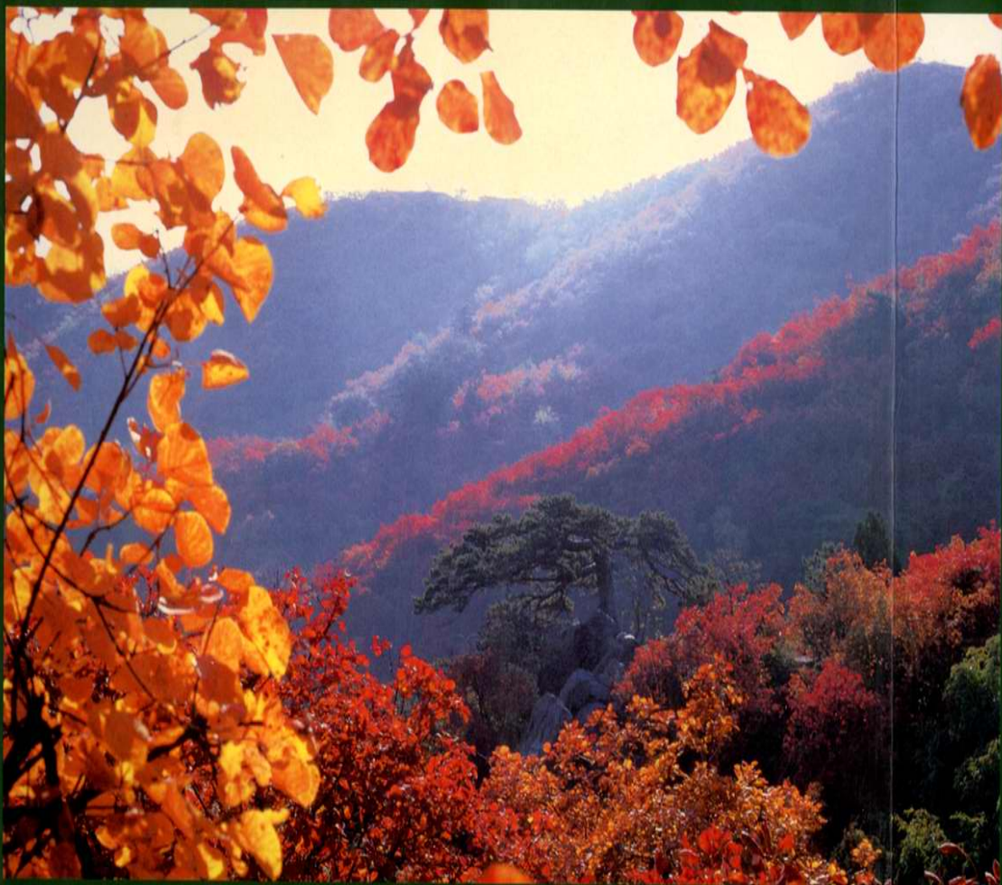
封面照片 香山红叶