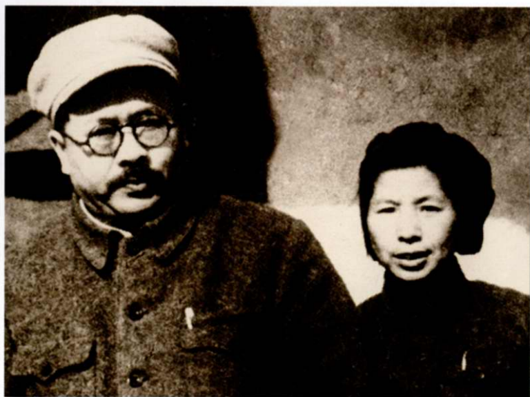
任弼时 陈琼英在香山