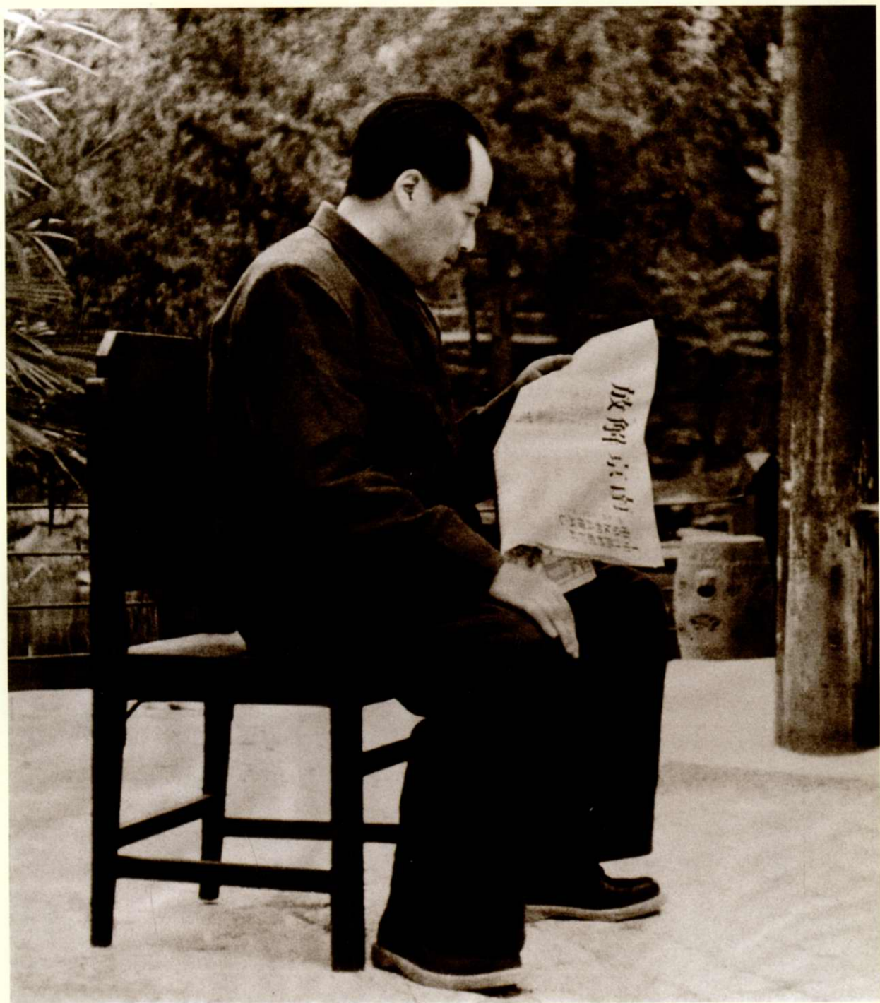
1949年4月毛泽东在香山双清别墅