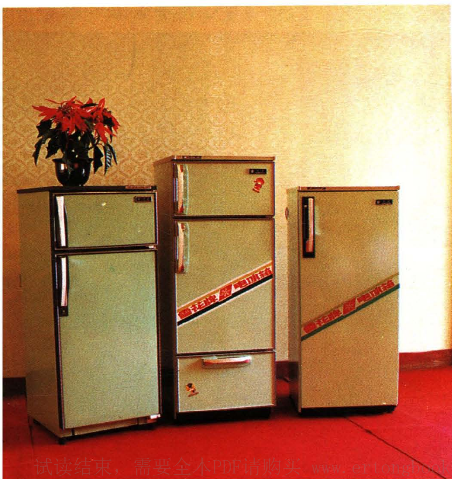
←雪花牌电冰箱——北京电冰箱厂生产