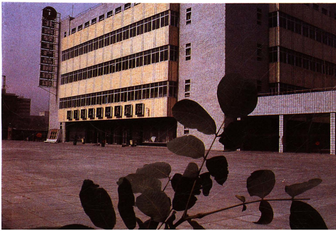
北京轻工产品展销馆