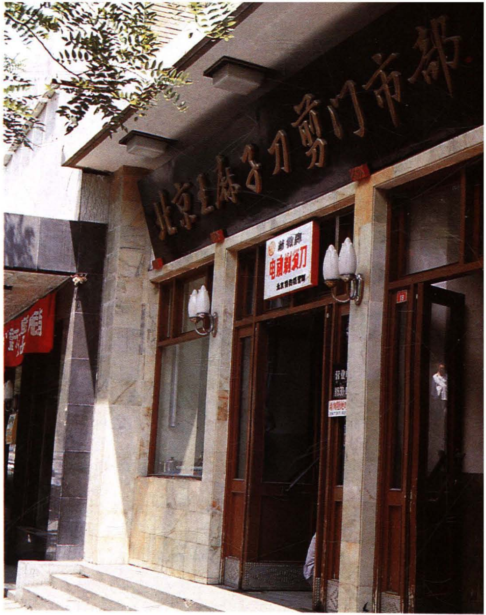
历史上的王麻子刀剪门市部