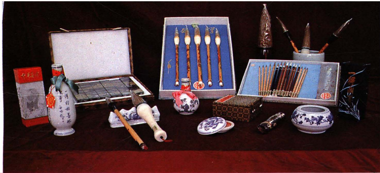
驰名中外的北京 “李福寿”高档书画笔、 “一得阁”高级墨汁和 八宝印泥