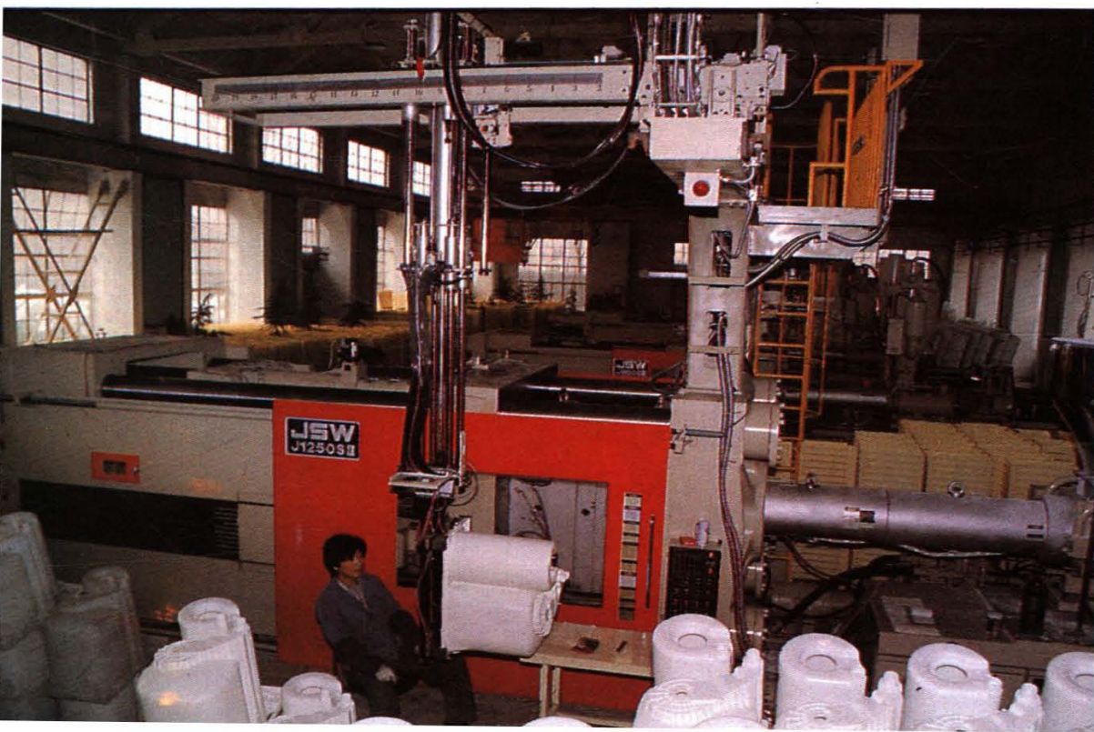
“白菊”喷淋双缸洗衣机塑料桶一次成型注塑机