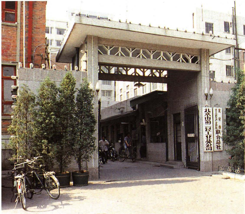
北京市第二轻工业总公司