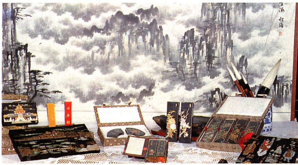
一得阁自行设计和 生产的各种高级图墨