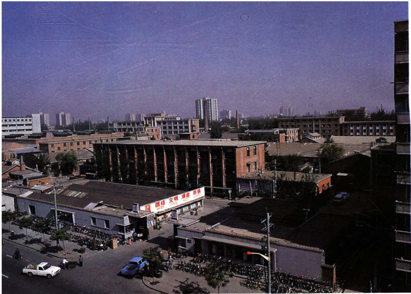
↑北京电冰箱厂厂貌