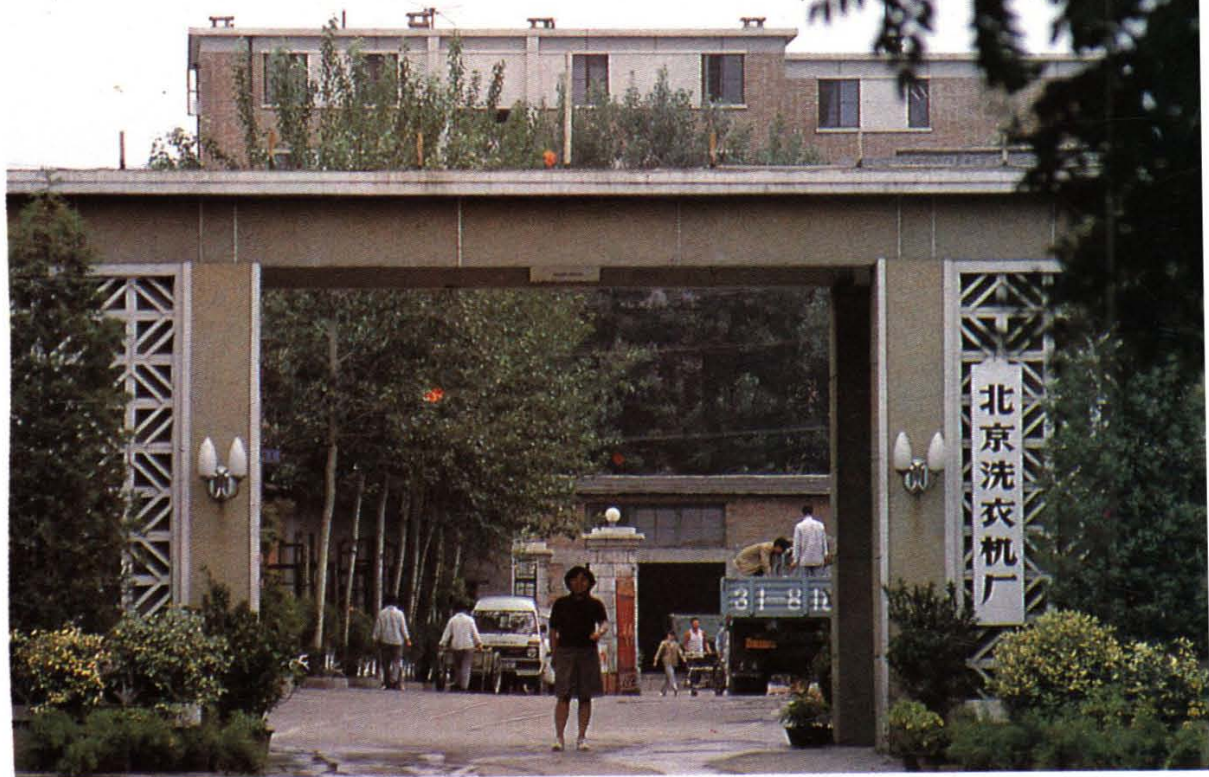
座落在北京朝阳门外的北京洗衣机厂