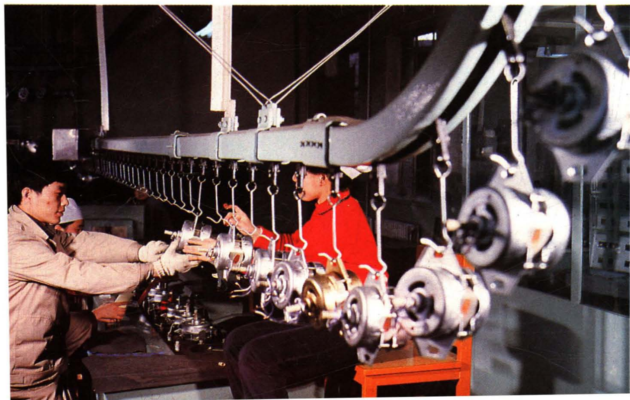
北京环宇电机厂洗衣机电机生产线