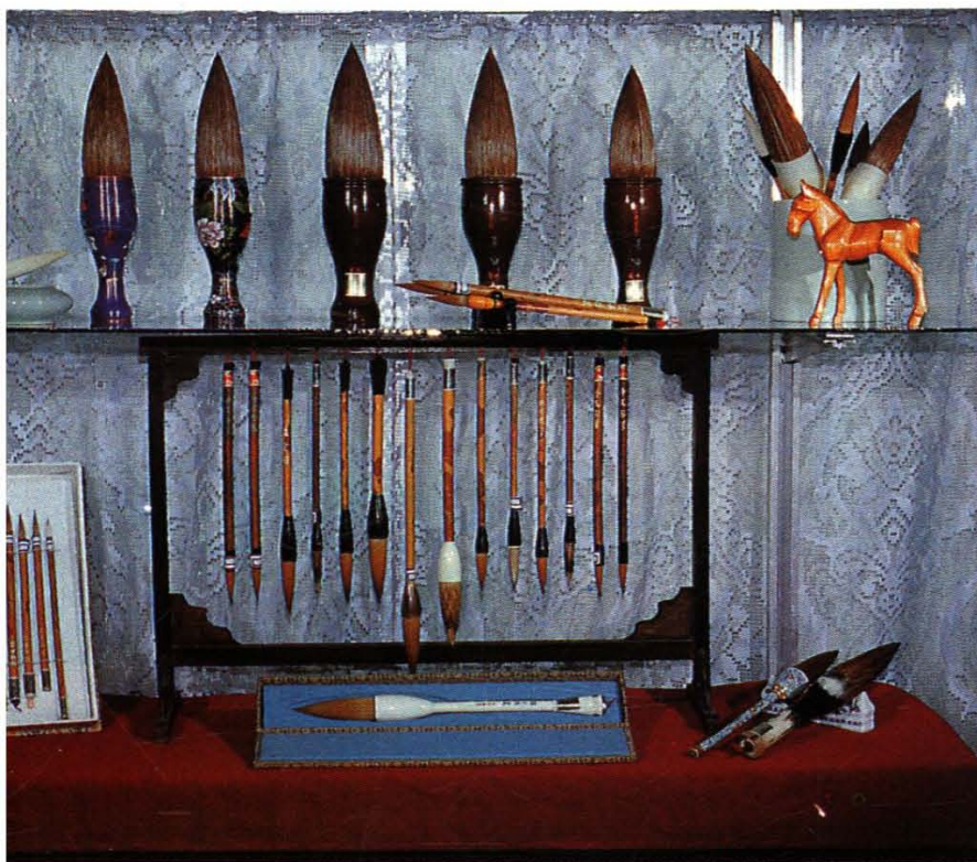
北京市制笔厂生产的 “李福寿”高档书画 笔