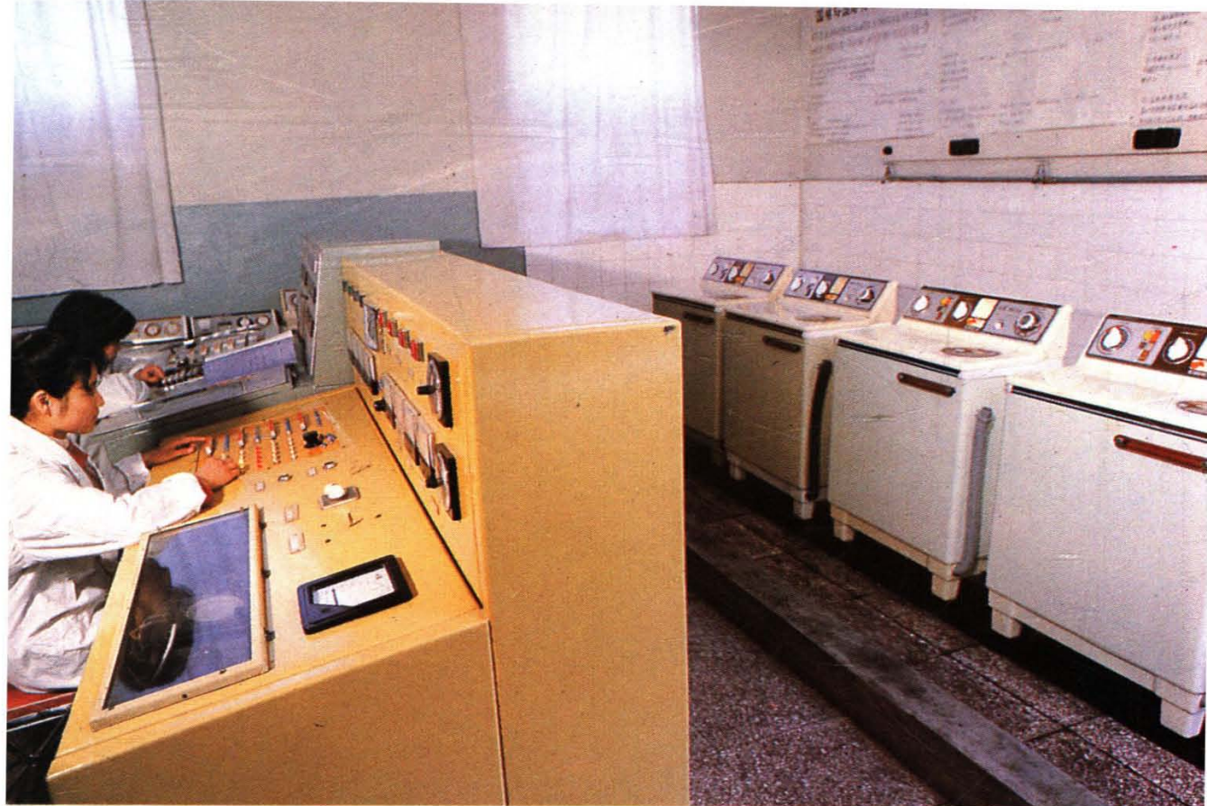
北京市洗衣机总厂“白菊”洗衣机质量测试室