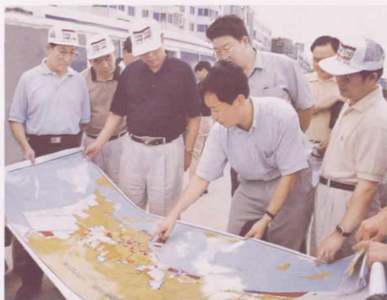
○ 2001年8月8日，省委书记张德江（左三）考察岱山中心渔港