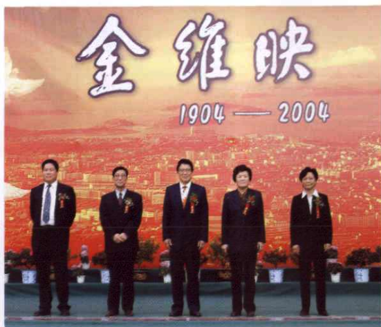
○ 2004年10月31日，全国人大常委会副委员长李铁映（中）在岱山出席金维映烈士诞辰100周年紀念活动暨铜像揭幕仪式