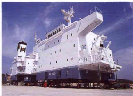
○ 船舶修造基地船台