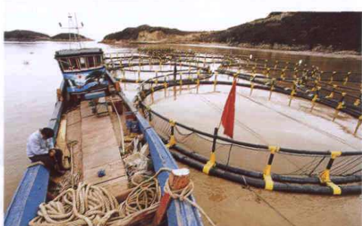
○ 梭子蟹深水网箱养殖