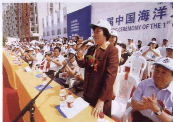
○ 2005年6月16日，全国政协副主席郝建秀在岱山出席首届中国海洋文化节开幕式