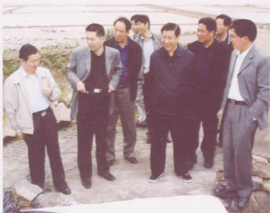
○ 2003年5月，省委书记、省人大常委会主任习近平（前排中）在岱山考察盐业生产