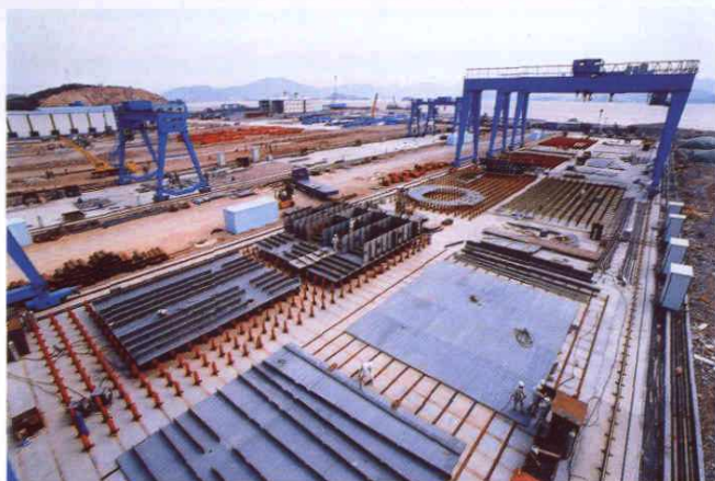
○ 位于秀山的日本常石集团船舶修造基地