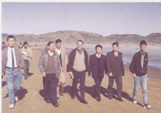
○ 1993年10月31日，省委副书记、省长万学远（右四）考察岱山