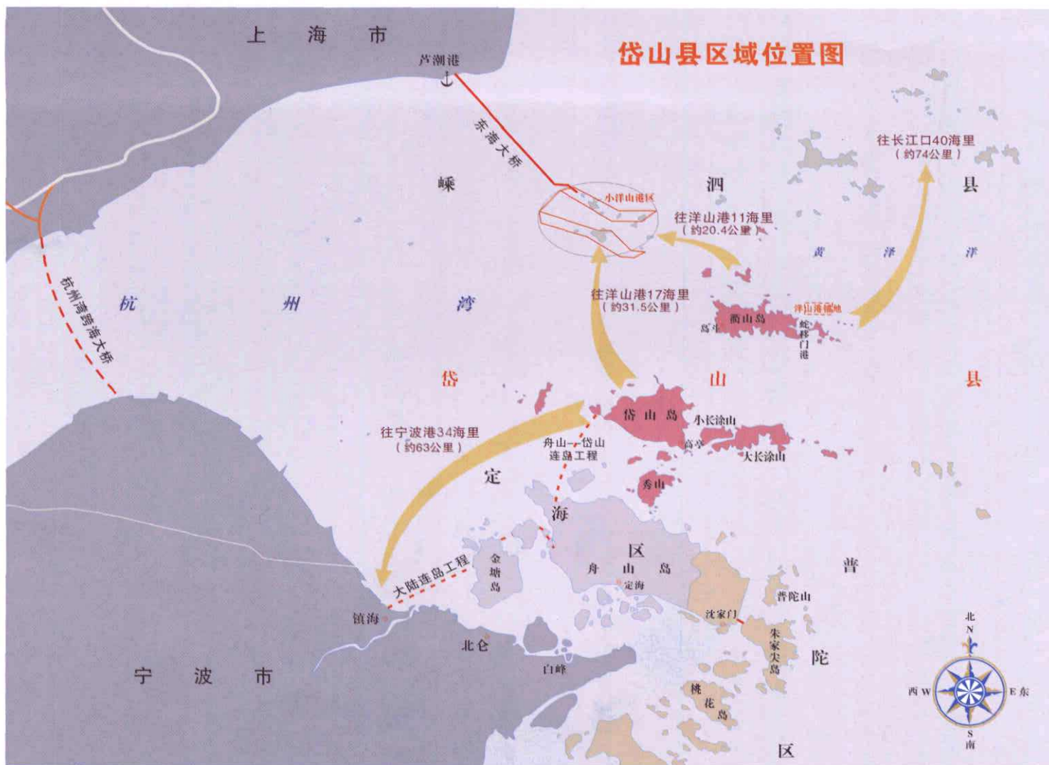
○ 岱山县区域位置图