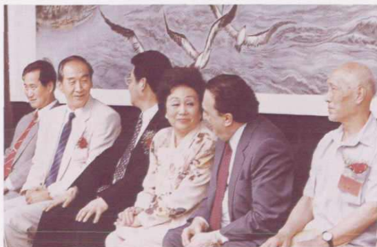
○ 1996年6月8日，国际知名人士陈香梅（右三）参加岱山双衢山港口开发有限公司成立揭牌仪式