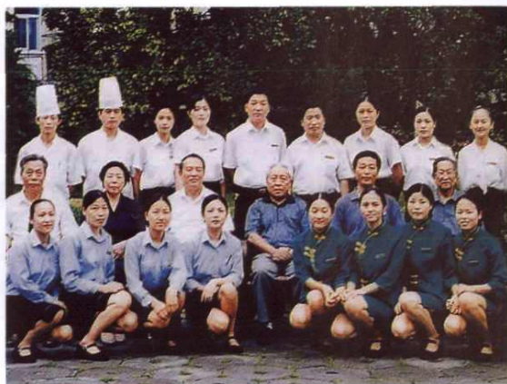
○ 2001年9月14日，全国政协副主席杨汝岱（第二排右三）视察岱山