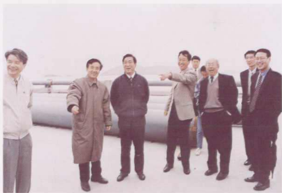
○ 1998年4月7日，省委副书记、省长柴松岳（左三）考察东海平湖油气田岱山原油中转站