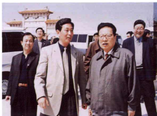
○ 2001年4月5日，原中共中央政治局常委、全国人大常委会委员长乔石（前右一）视察岱山