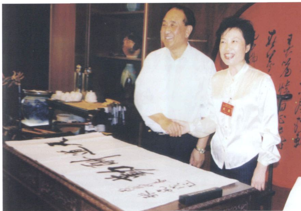
民盟中央副主席、民盟辽宁省委主委张毓茂 为民盟营口市委题词（2006年9月13日）