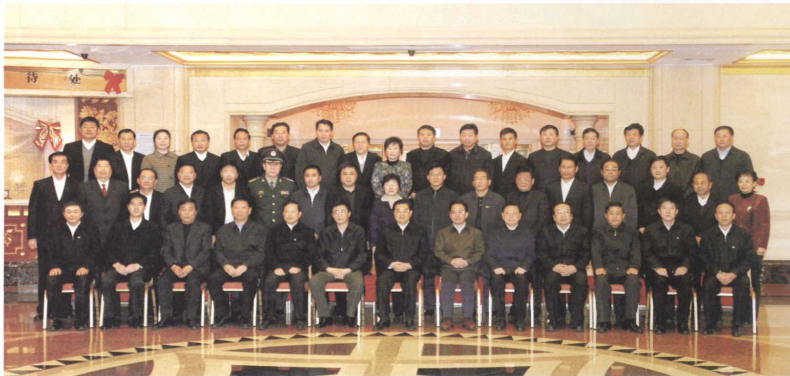
2009年12月12日，中共中央总书记、中央军委主席、国家主席胡锦涛亲切接见营口市党政领导并合影 民盟营口市委主委车竞（后排中）