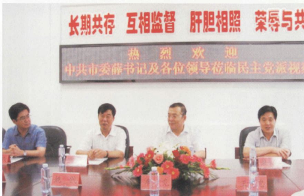
中共营口市委书记薛恒（右二），市委常委、秘书长梁永富（右一），市政协副主席、统战部部长贾群桐（左二）出席民盟等党派机关座谈