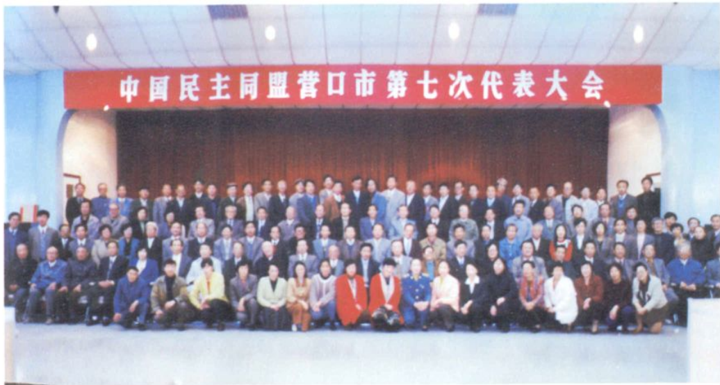
民盟营口市委第七次盟员大会与会盟员合影(1996年10月)