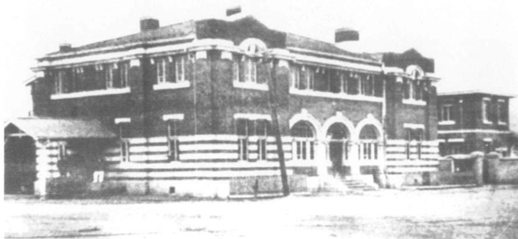
民盟营口市筹委会址（现为营口市红十字会办公楼）