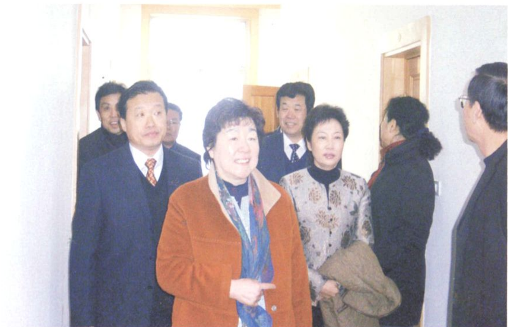
市政协主席王杰 (左二) 到民盟营口市委调研 (2008年2日)