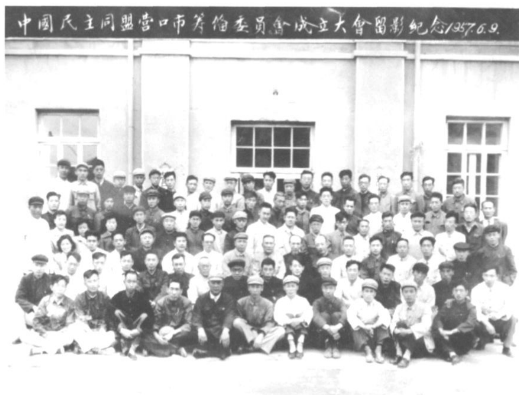
中国民主同盟营口市筹备委员会成立大会与会领导与盟员合影 (1957年6月9日)