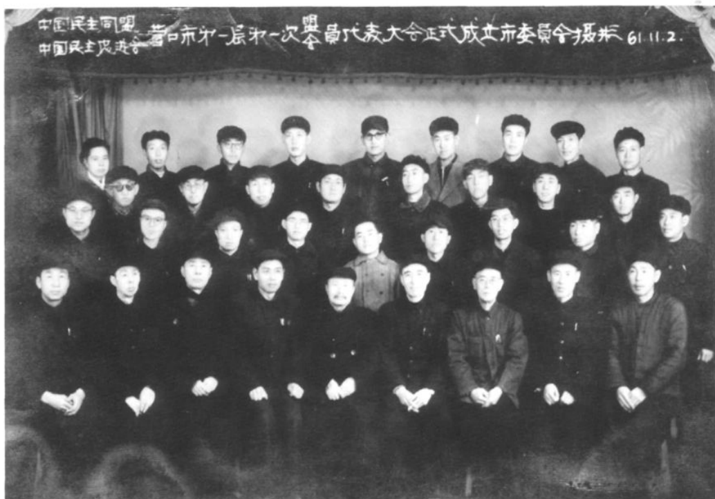
出席营口市民盟第一次盟员大会的盟员合影（1961年11月2日）