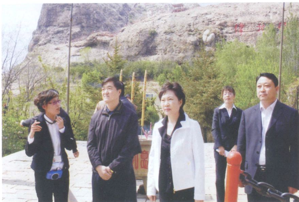
民盟中央副主席李重庵（左二）在营口视察（2009年5月）