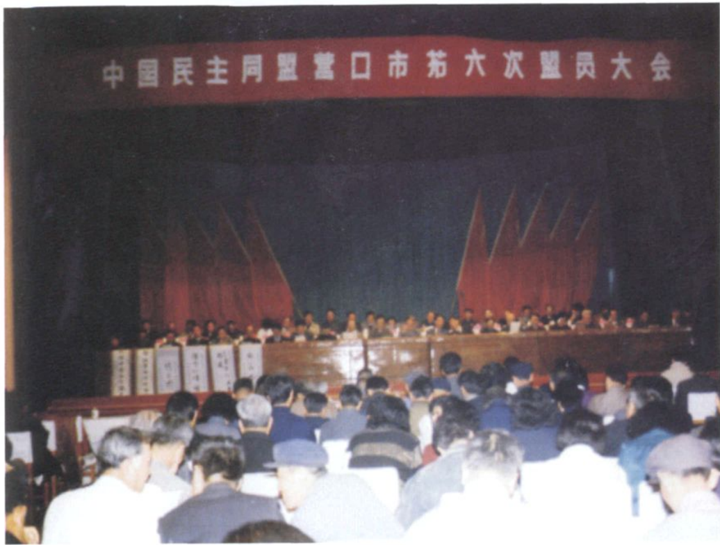
民盟营口市委第六次盟员大会会场(1992年4月)