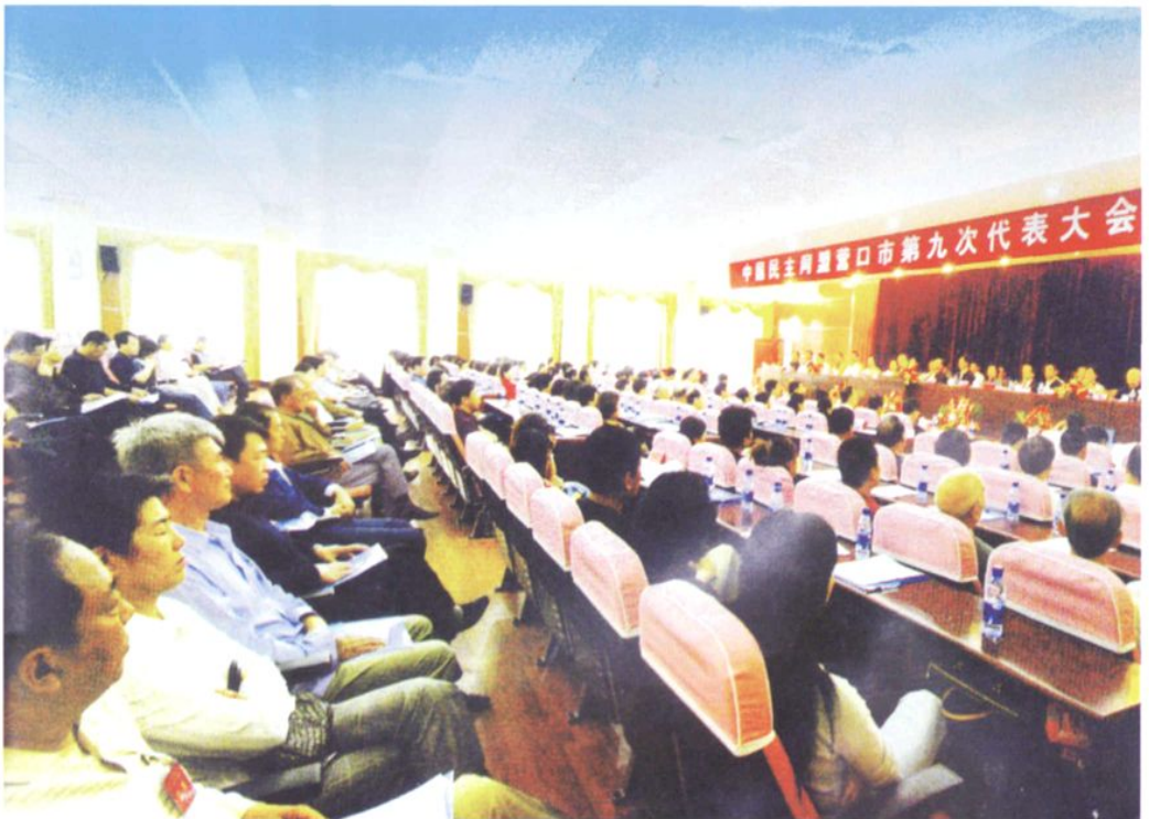
民盟营口市第九届盟员代表大会（2006年9月）