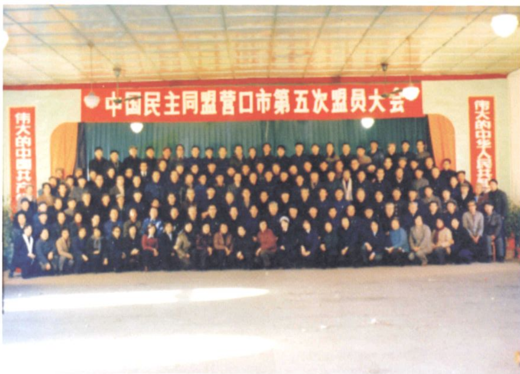
民盟营口市委第五次盟员大会与会盟员合影（1987年12月）