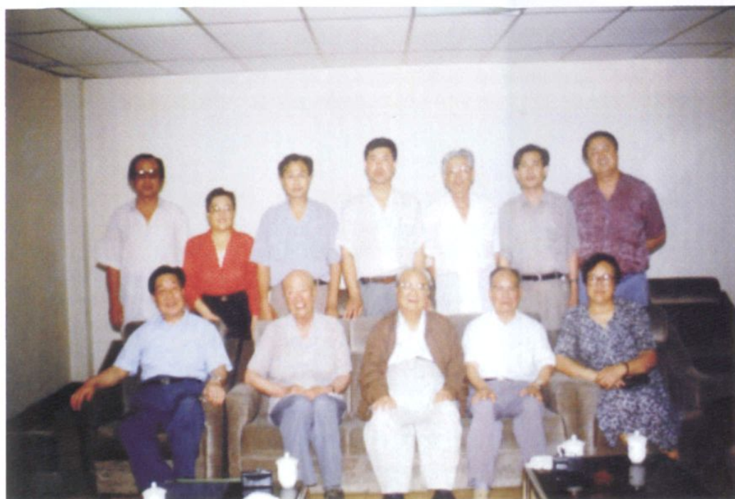
民盟中央主席费孝通（前中）到营口视察时与 民盟营口市委领导合影（1996年7月19日）