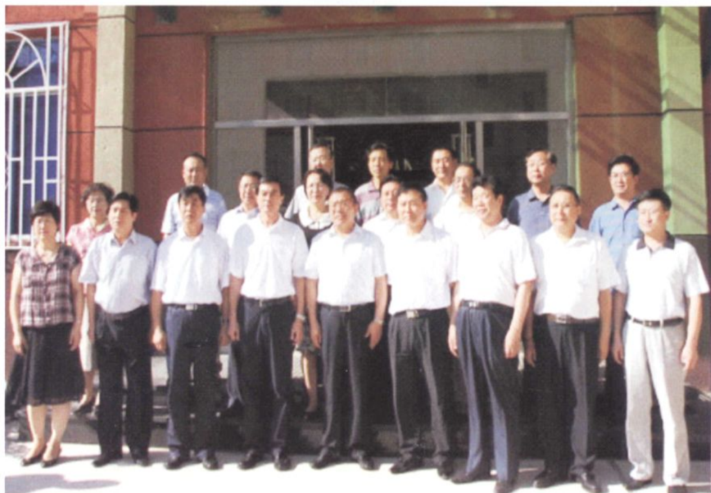
中共营口市委书记薛恒等领导与营口市各党派机关领导合影 (2010年8月16日)