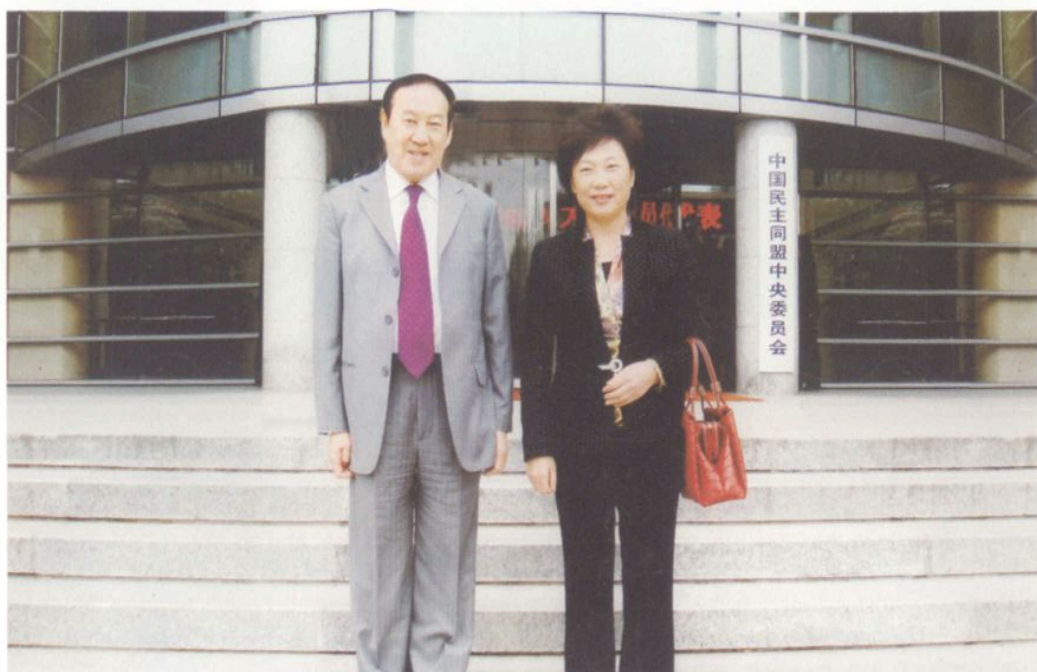
民盟营口市委主委车竞出席全国妇女第十次代表大会受到 全国人大副委员长、民盟中央主席蒋树声接见（2008年10月）