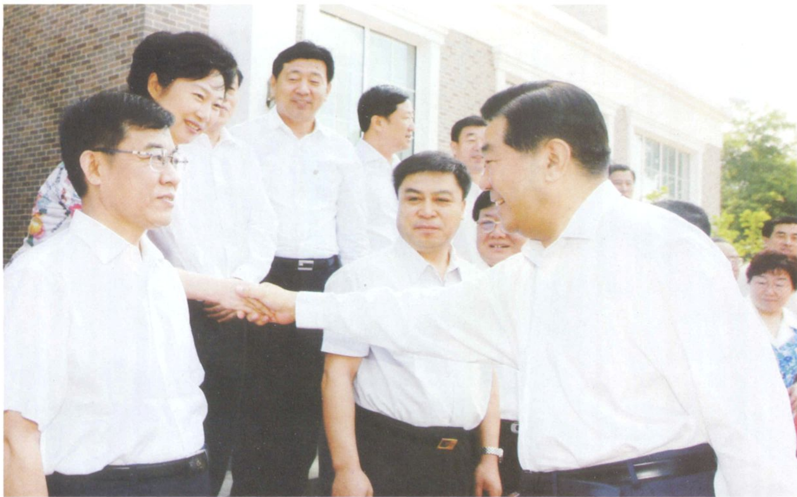
2009年6月12日，全国政协主席贾庆林在营口视察期间亲切接见民盟营口市委主委车竞