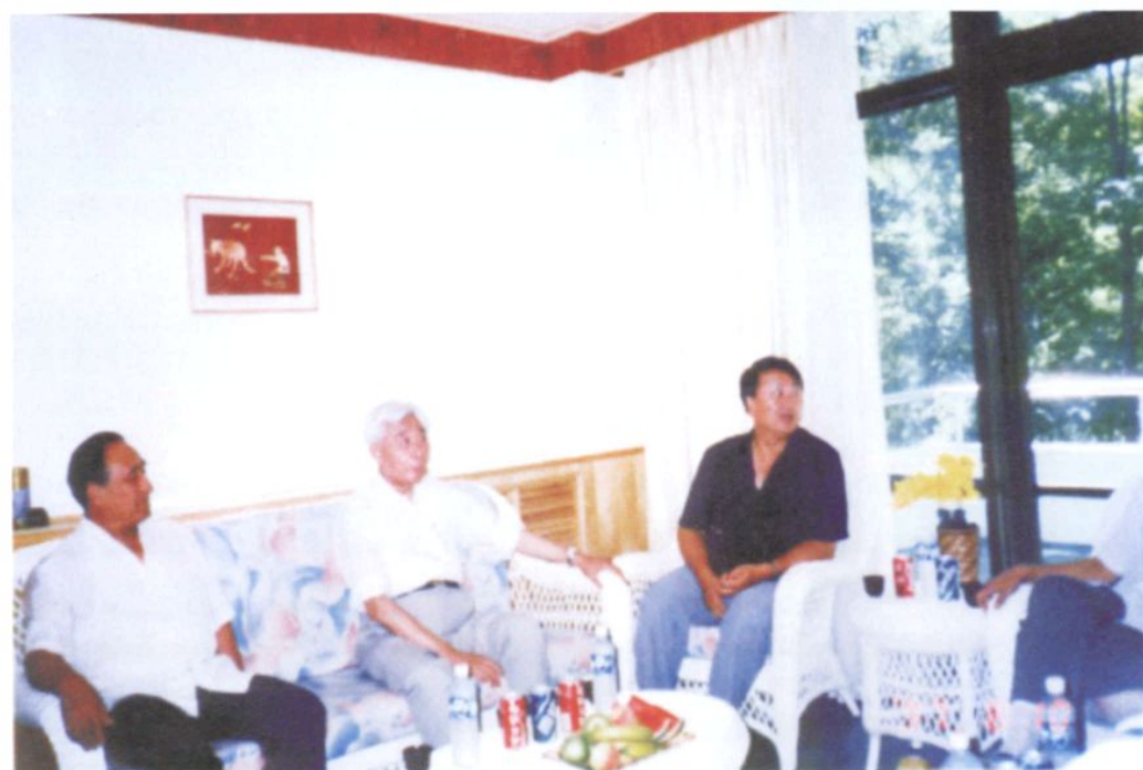
民盟中央（九届）主席丁石孙（中）在营口视察期间 与民盟营口市委领导座谈（1997年8月10日）