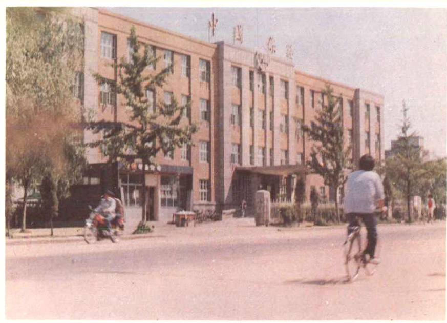
▶ 中国人民保险公司丹东市 支公司办公楼（丹东市振兴区 青年大街56号，购于1980年）