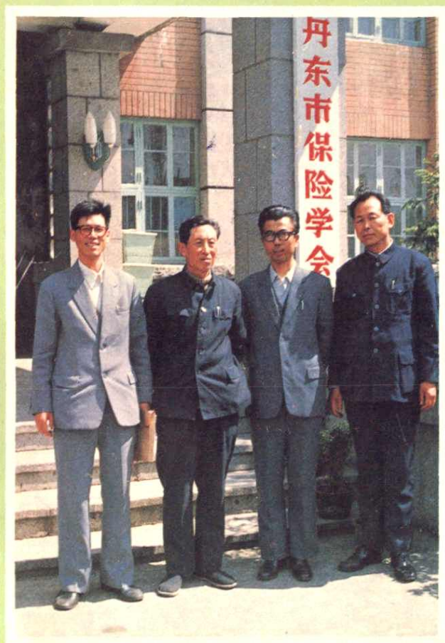
◀ 丹东市支公司领导班子合影