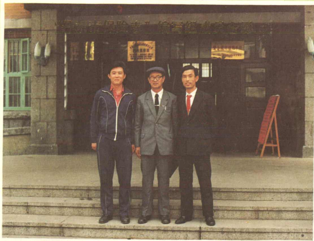
《丹东市保险志》编纂委员会编写组成员合影