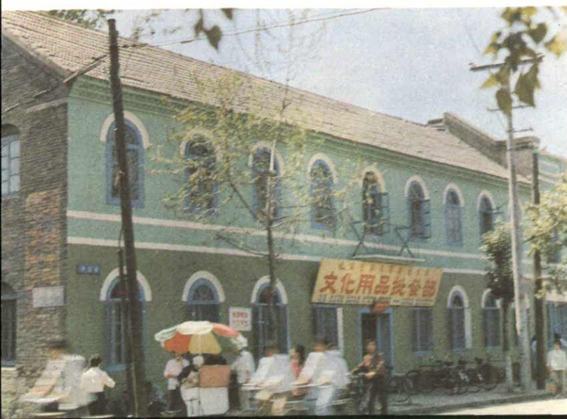
◀ 和(合)记保险公司旧址 (原中国政记轮船有限公司， 地址：现中富街)