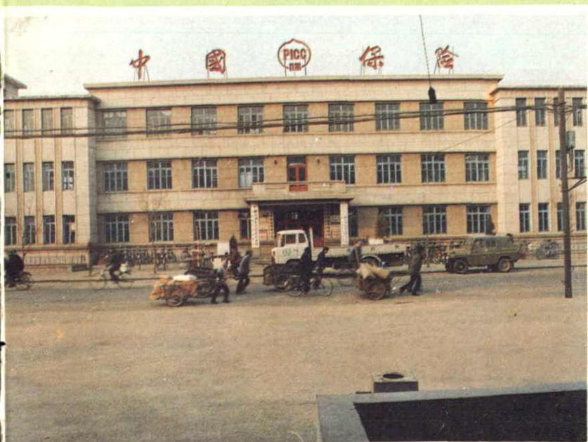
▶ 中国人民保险公司宽甸县支公司办公地址（1984年租用县政府招待所营业楼）