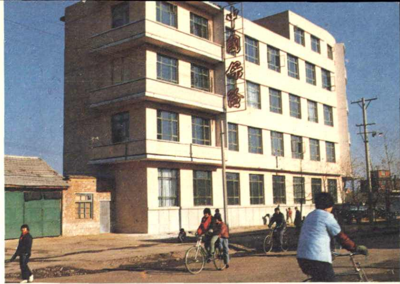
◀ 中国人民保险公司岫岩满族自治县支公司办公楼（购于1984年）