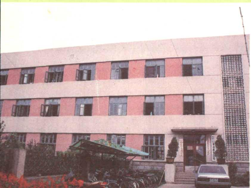
◀ 中国人民保险公司东沟县 支公司办公地址（1984年租用 丹东造纸厂东沟苇场办公楼）