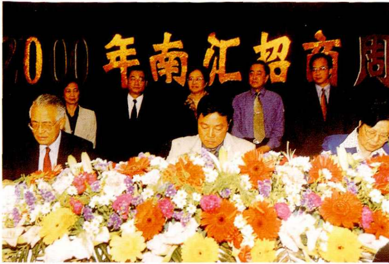
2000年5月16日， 举行2000年南汇招商周 项目签约仪式。