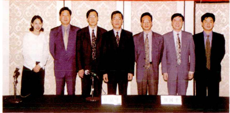
1998年11月16 日，南汇县人民政府招 商办在深圳特区举行面 向港澳、珠江三角洲的 中小型企业及自然人招 商引资新闻采访会。