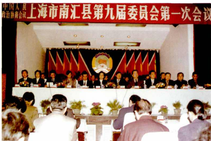
1998年3月15~20日，中国人民政治协商会议南汇县第九届委员会第一次会议召开。