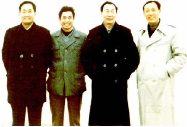
1989年1月2日，中共 上海市委副书记、市长朱 镕基视察芦潮港码头。