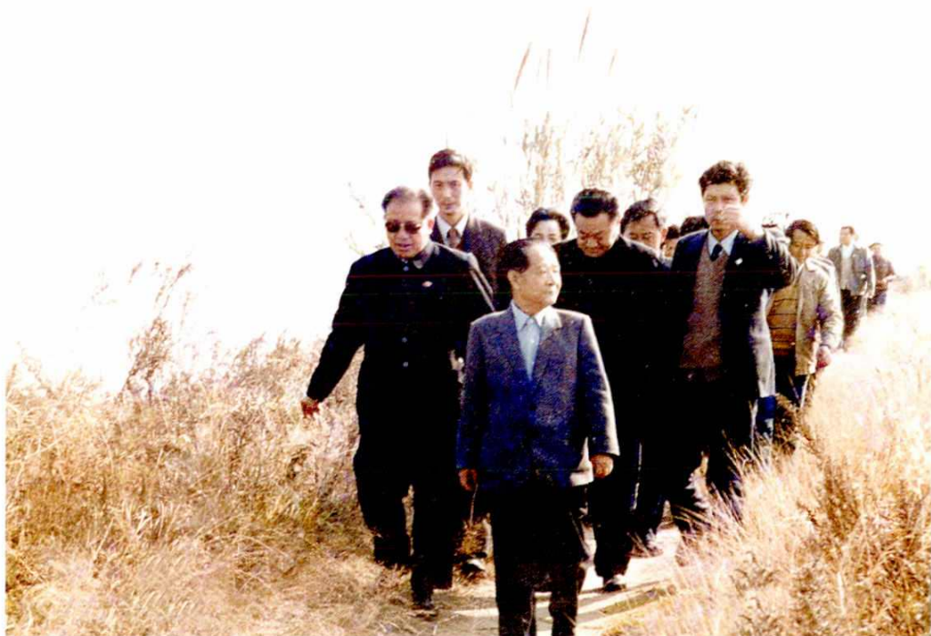
1986年11月19日，中共中央总书记胡耀邦视察芦潮港。