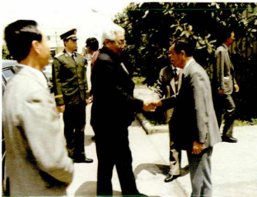
1992年5月11日，蒙古国总理达希·宾巴苏伦及夫人访问周浦乡。