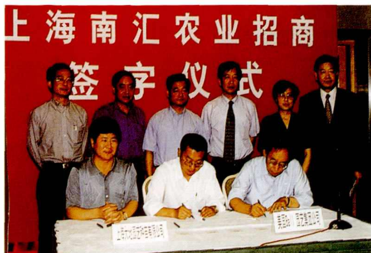
2000年5月24日，上海南汇农业招商签字仪式在上海国际会议中心举行。