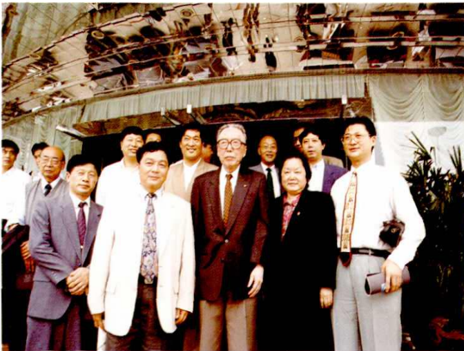
1996年5月27日，全国政 协副主席吴学谦在上海市人大常 委会主任陈铁迪陪同下视察南汇 康桥工业区。