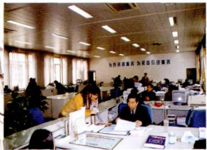
2001年成立南汇招商中心。