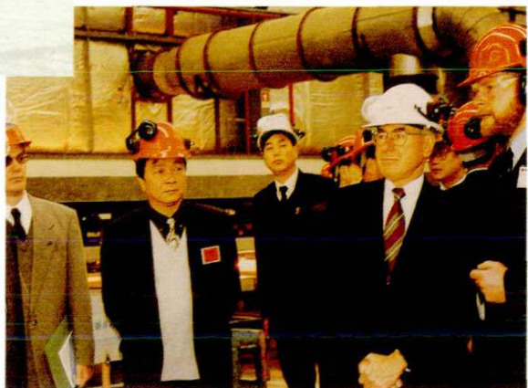
1997年3月29日，澳大利亚总理霍华德访问南汇。