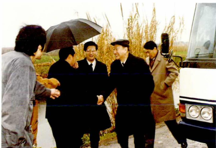
1995年1月，上海市市长徐匡迪在黄路乡看望农村基层干部。