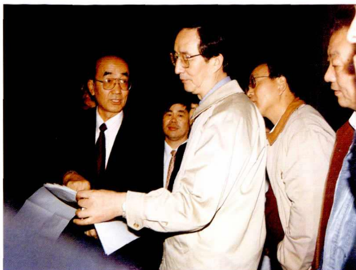
1997年11月21日，中共上海市委副书记、常务副市长陈良宇视察芦潮港。