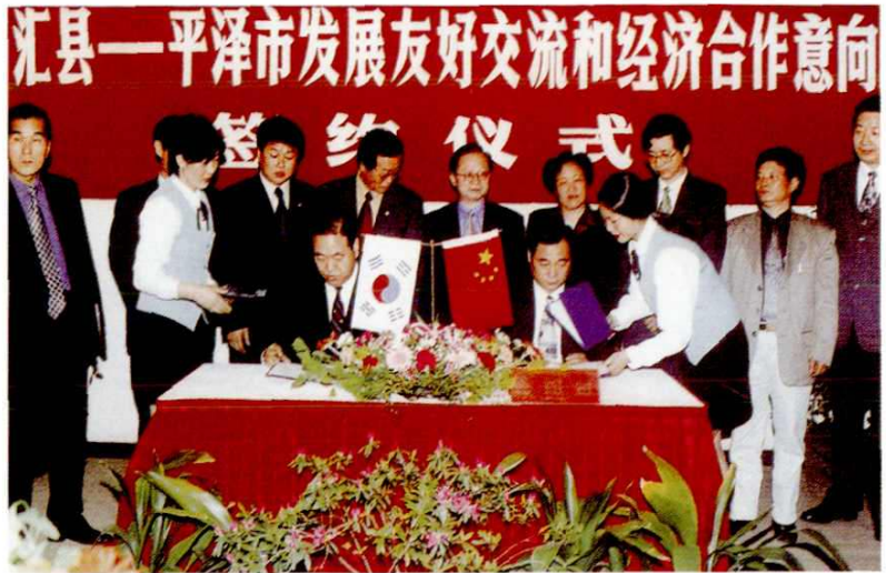
2000年4月29日，韩国平泽市市长金善基率代表团来南汇县参观访问，并签订《南汇县—平泽市发展友好交流和经济合作意向书》。