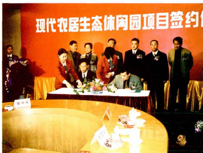
占地 80 公顷的加拿大独资现代农居生态休闲园于 2001 年底正式签约，项目将生态、休闲、观光的理念融入到现代农业中。