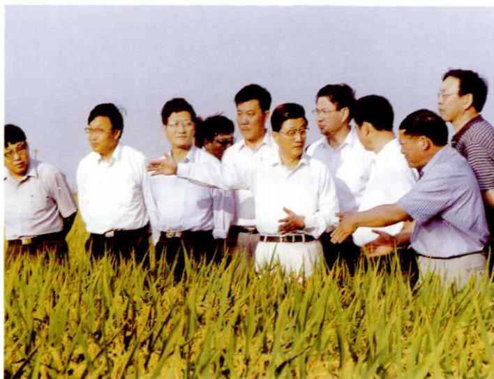
1997年10月8日，中共中央政治局委员、中共上海市委书记黄菊，市委副书记孟建柱，市委常委、市委秘书长宋仪侨，副市长冯国勤等市领导视察南汇县农业生产。