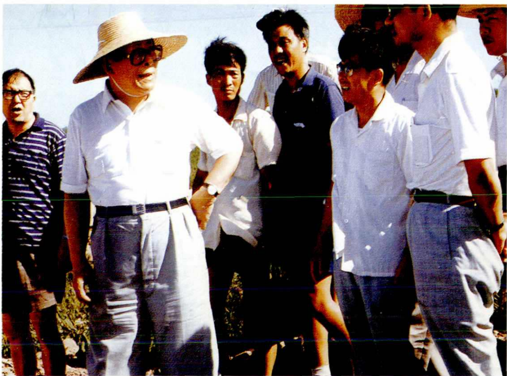
1986年8月1日，中共上海市委副书记、市长江泽民视察上海市废弃物老港处置场建设工程。