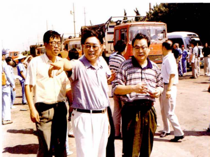
1998年8月12日，上海市政协主席王力平，慰问老港处置场环卫工人。