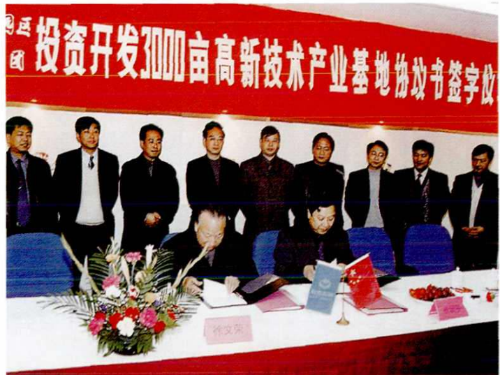
2000年中国横店集团在南汇工业园区举行投资建设高新技术基地的签约仪式。