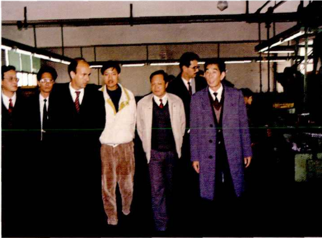
古巴部长会议执行委员会秘书一行参观周浦电池联营厂。