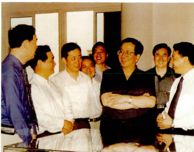
2001年6月15日，中共中央政治局候补委员，中组部部长曾庆红来南汇视察。