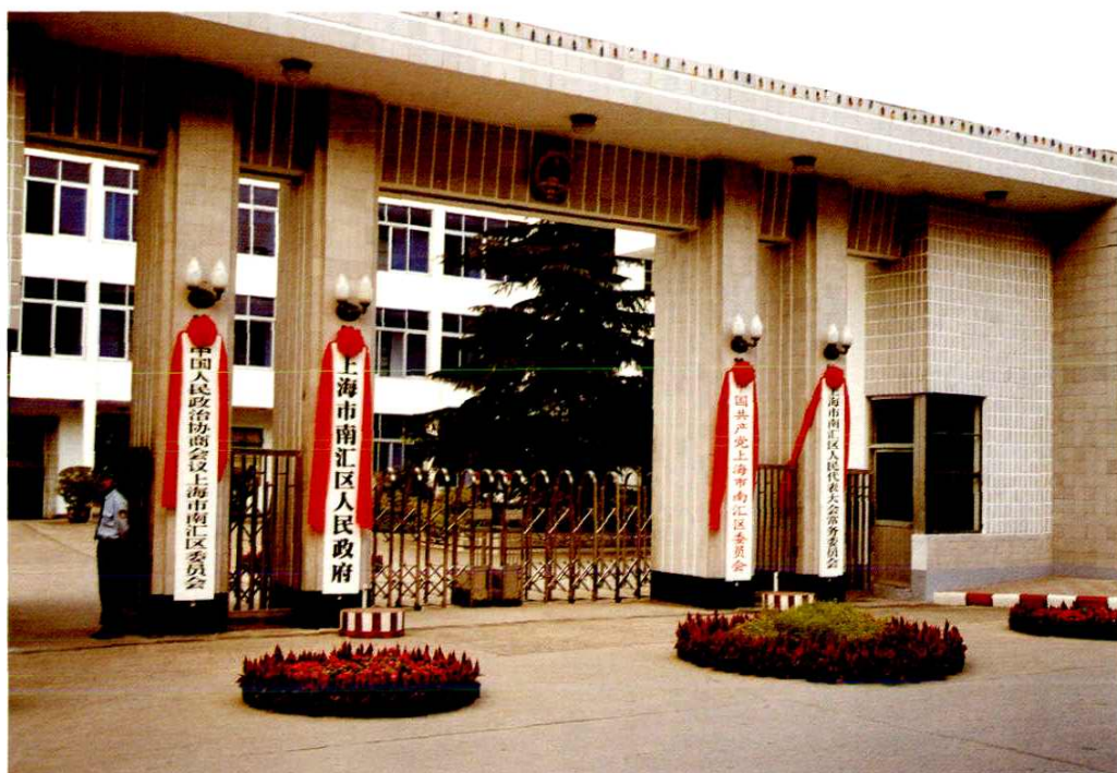
区委、区人大、区政府、区政协办公地点。