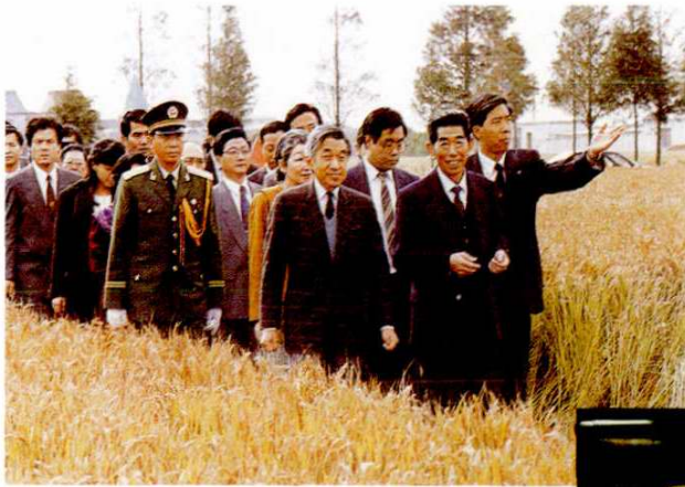
1992年11月28日，日本天皇明仁参观周浦乡。