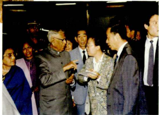
1992年5月23日，印度总统文卡特拉曼及夫人到百乐毛纺厂参观访问。