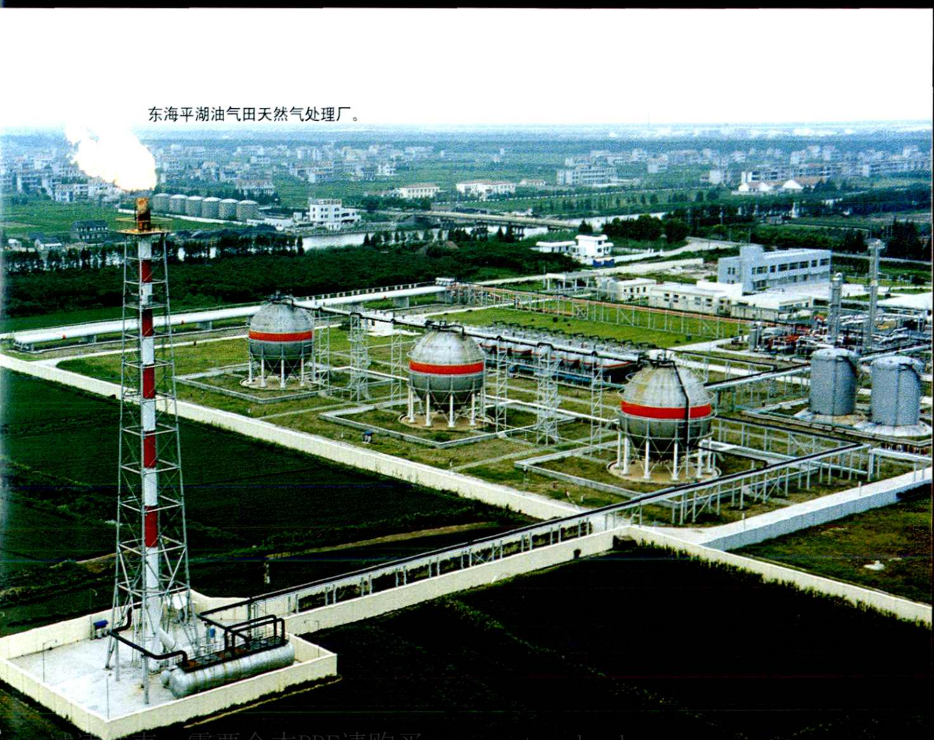
东海平湖油气田天然气处理厂。