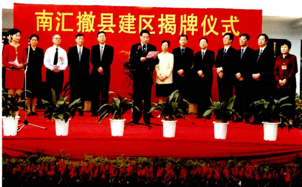
2001年10月12日，举行南汇撤县建区揭牌仪式，上海市人大常委会副主任漆世贵，副市长冯国勤等市领导出席揭牌仪式，中共南汇区委书记陈策，副书记、区长白文华、区人大常委会主任郭天成，区政协主席吴岭、区委副书记崔明华、孙雷、张才莲等区领导出席仪式，副市长冯国勤讲话。