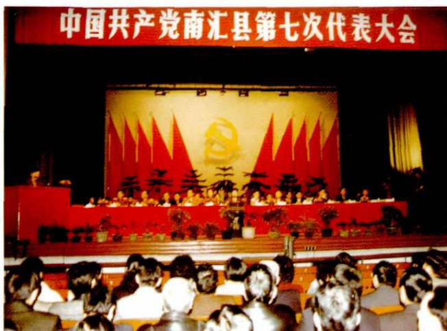
1998年1月12~15日，中国共产党南汇县第七次代表大会召开。