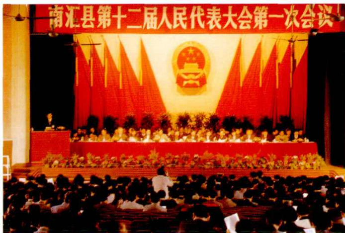
1998年3月16~21日，南汇县第十二届人民代表大会第一次会议召开。