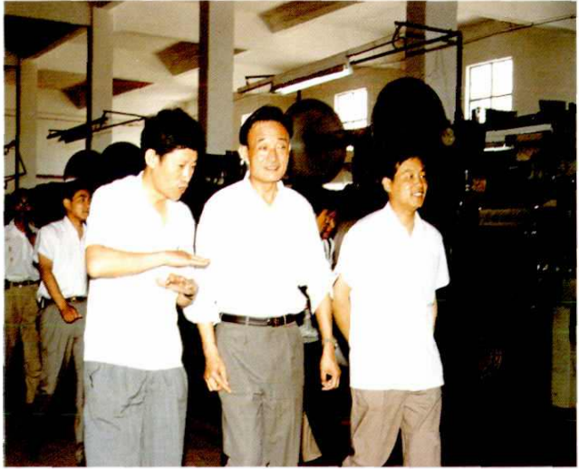
1993年6月，中共上海市委书 记吴邦国在中共南汇县委书记许德 明陪同下，到祝桥乡视察百恩斯花 色绒厂。