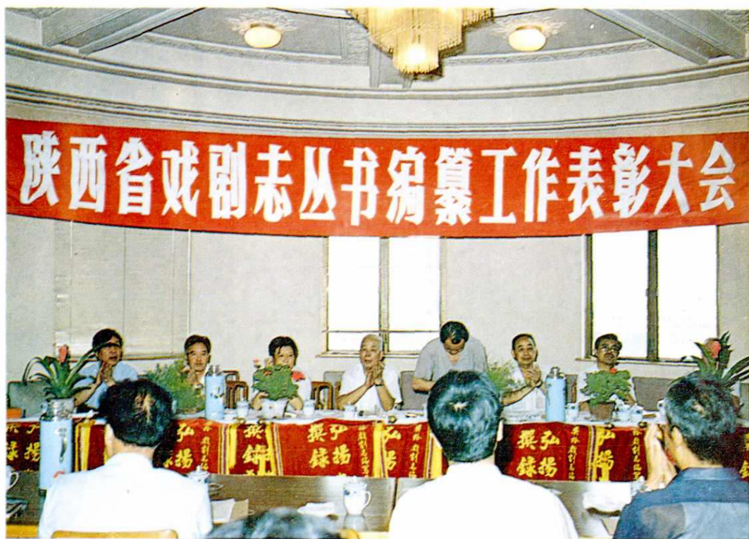
1992年8月陕西省戏剧志丛书编纂工作表彰大会