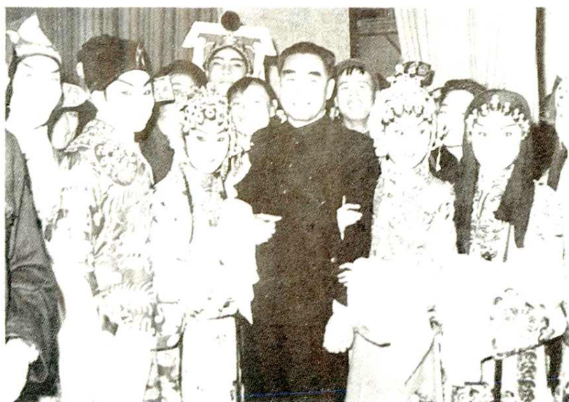
1959年周恩来总理接见陕西省赴京汇报演出团