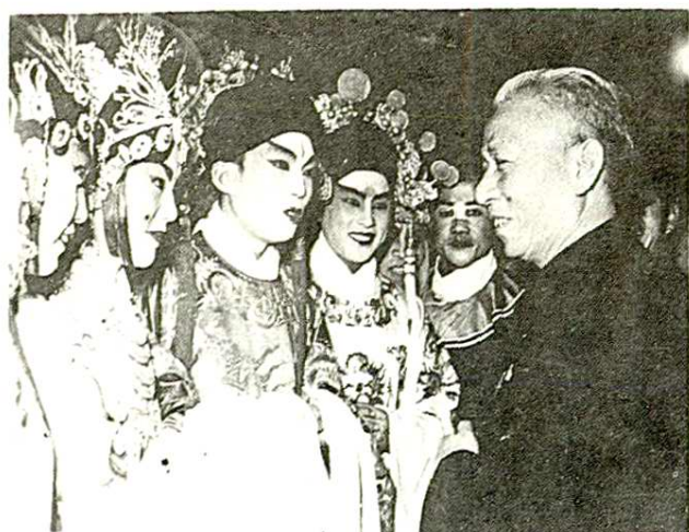
1959年11月刘少奇副主席在北京与陕西省赴京汇报演员在一起