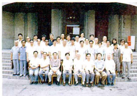
表彰大会与会代表