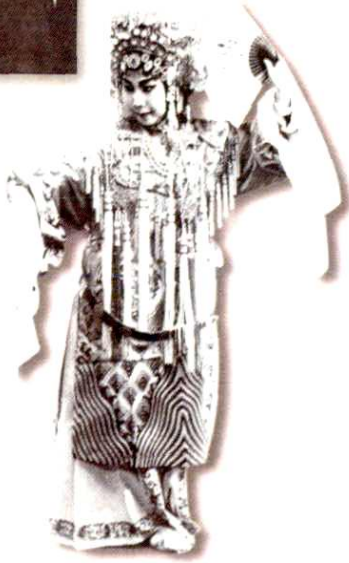
名老艺人杨金凤在《回荆州》中扮演孙尚香