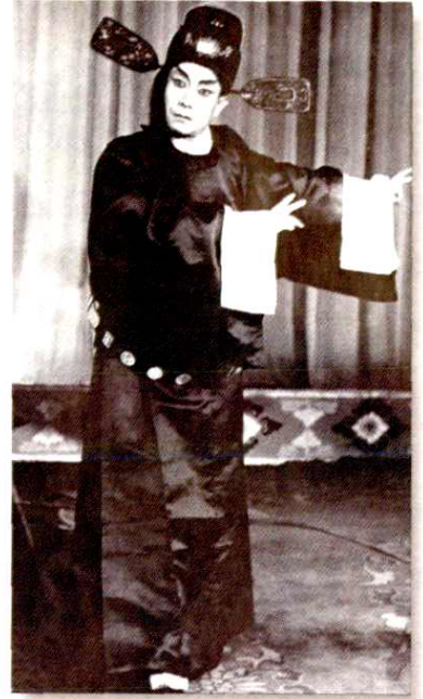
《周仁回府》是秦腔“家底戏”，妇孺皆知。周仁这个角色，过去一直用须生扮演，30年代之后著名演员任哲中改用小生扮演，唱腔、表演俱佳，在西北地区观众中颇有影响，有“活周仁”之誉