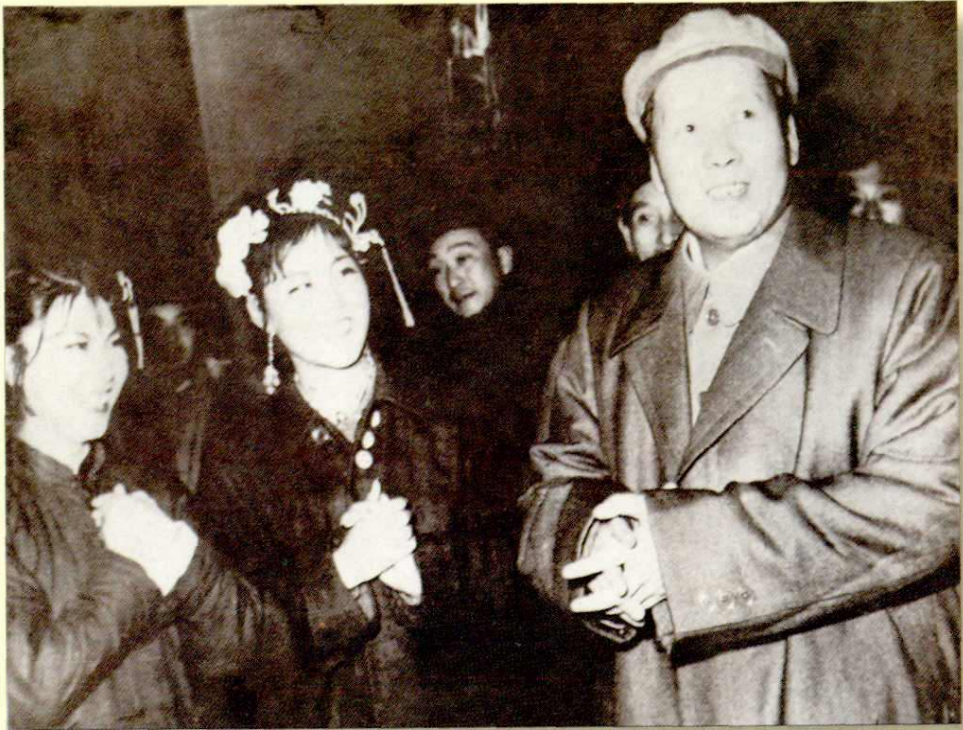
1957年毛泽东主席在长春电影制片厂和秦腔演员在一起