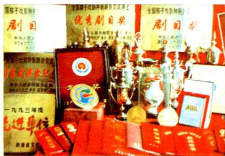
陕西省戏曲研究院历年获得的部分奖状奖品