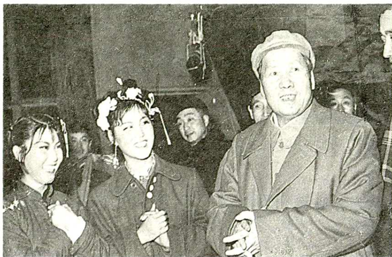
1957年毛泽东主席在长春电影制片厂与秦腔演员在一起