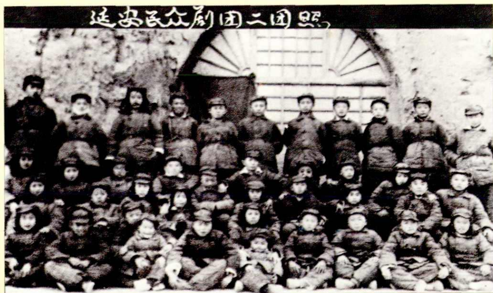
延安民众剧团二团照