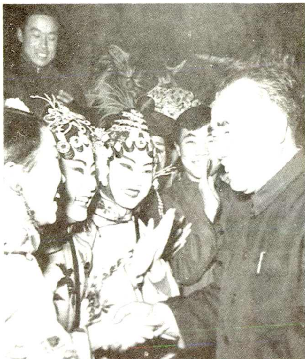
1959年朱德委员长 在北京与陕西省赴京汇报 演出团演员在一起