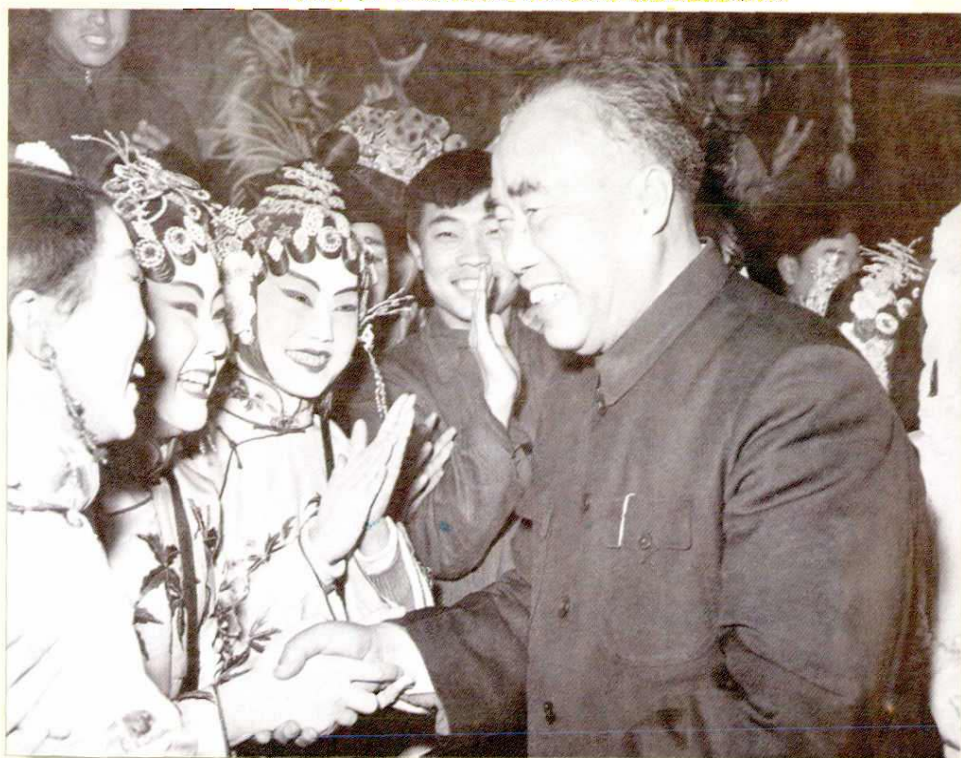
1958年朱德委员长接见陕西省赴京汇报演出团演员