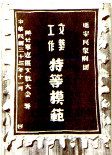
1944年陕甘宁边区文教大会为民众剧团颁发的“特等模范”奖旗