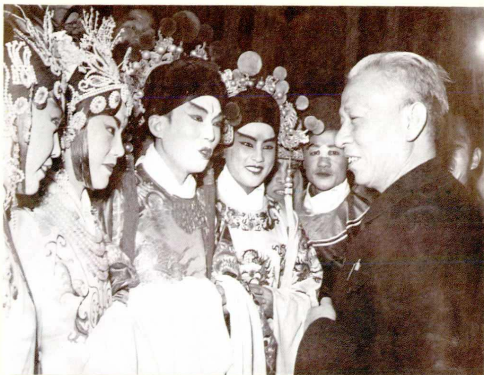
1958年刘少奇主席接见陕西省赴京汇报演出团演员