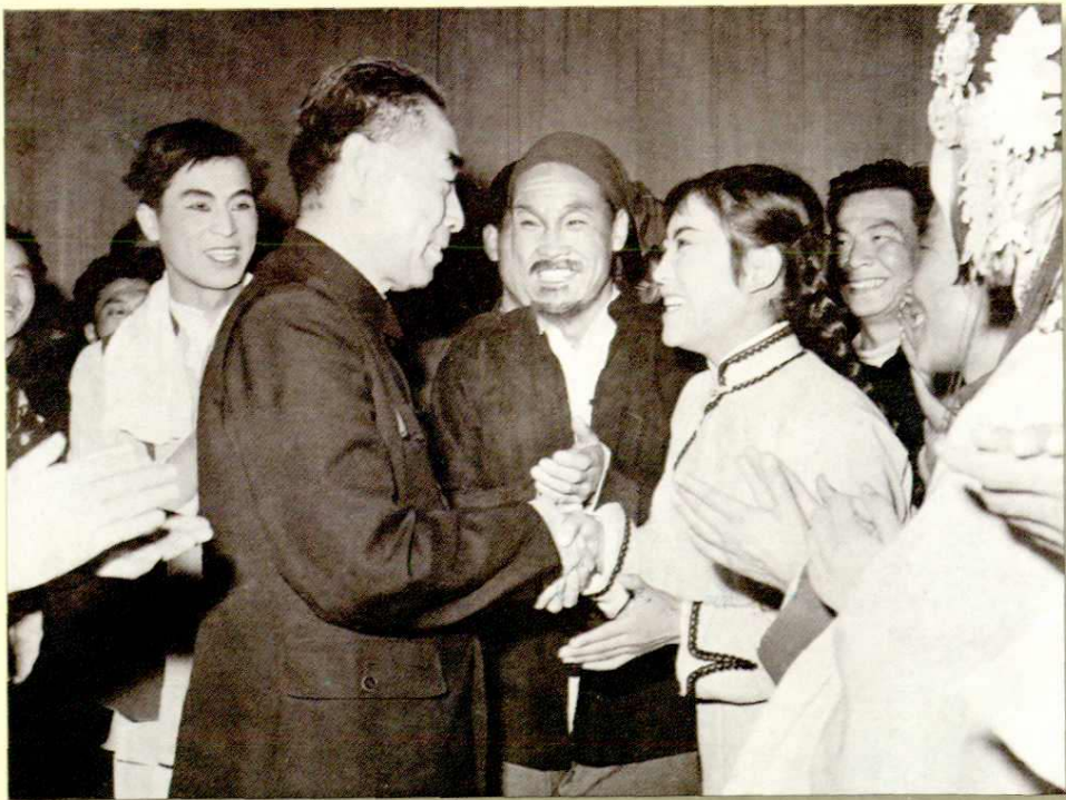
1958年周恩来总理接见陕西省赴京汇报演出团演员